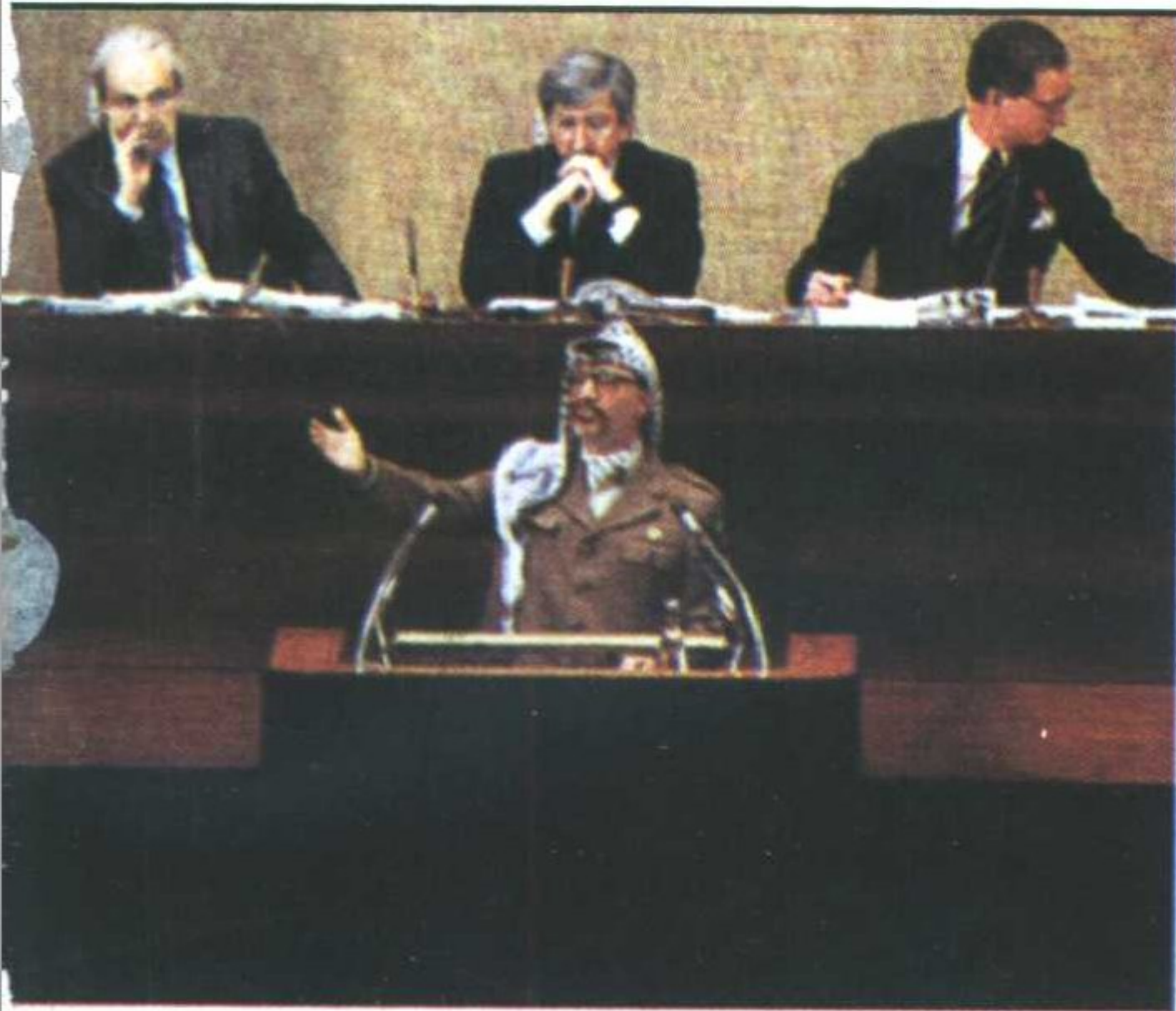
左上：阿拉法特1993年12月13日在联合国发表演讲，宣布承认联合国242号和338号决议。