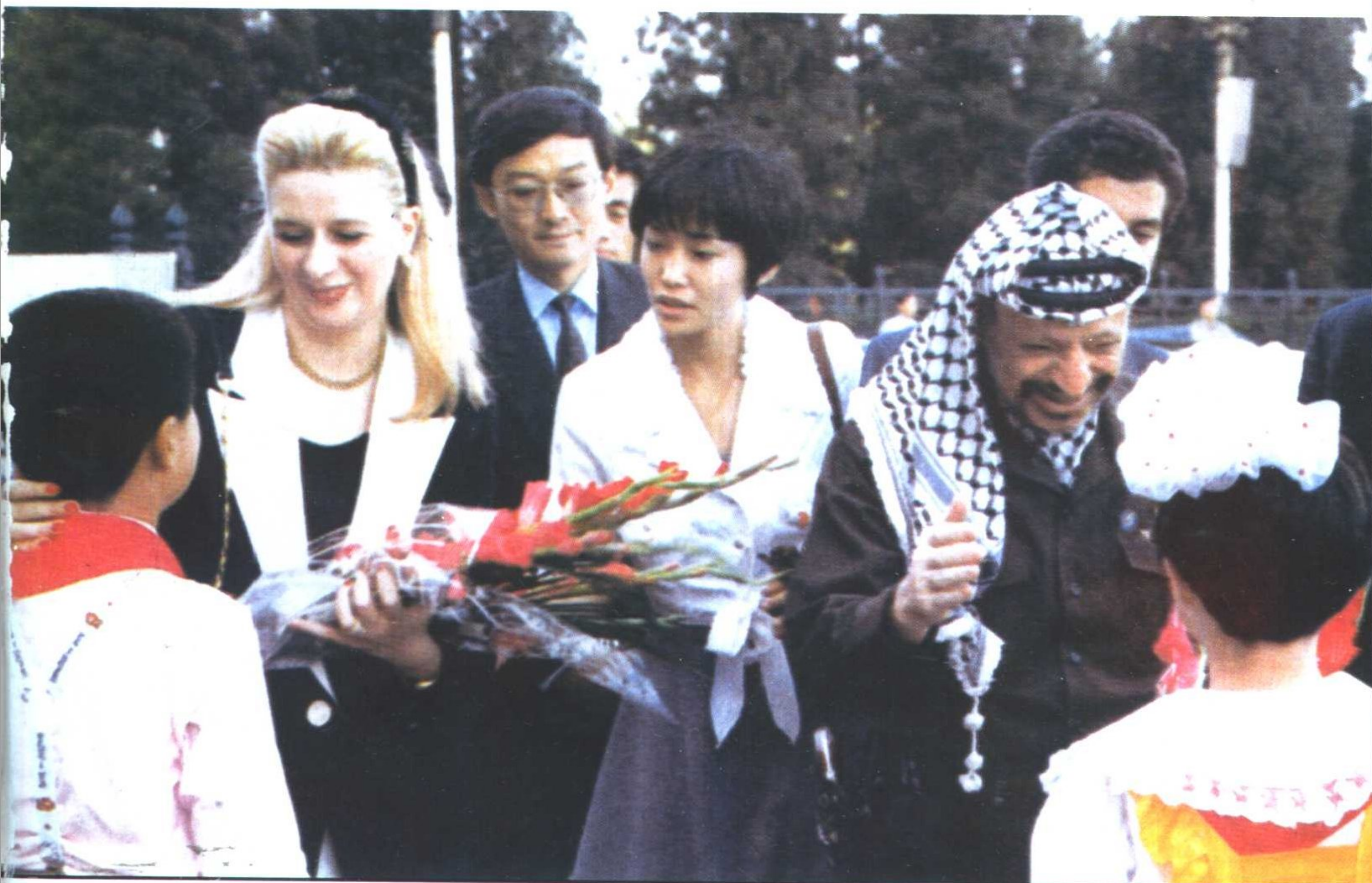
下：1993年，阿拉法特偕夫人到中国，接受中国儿童献花。