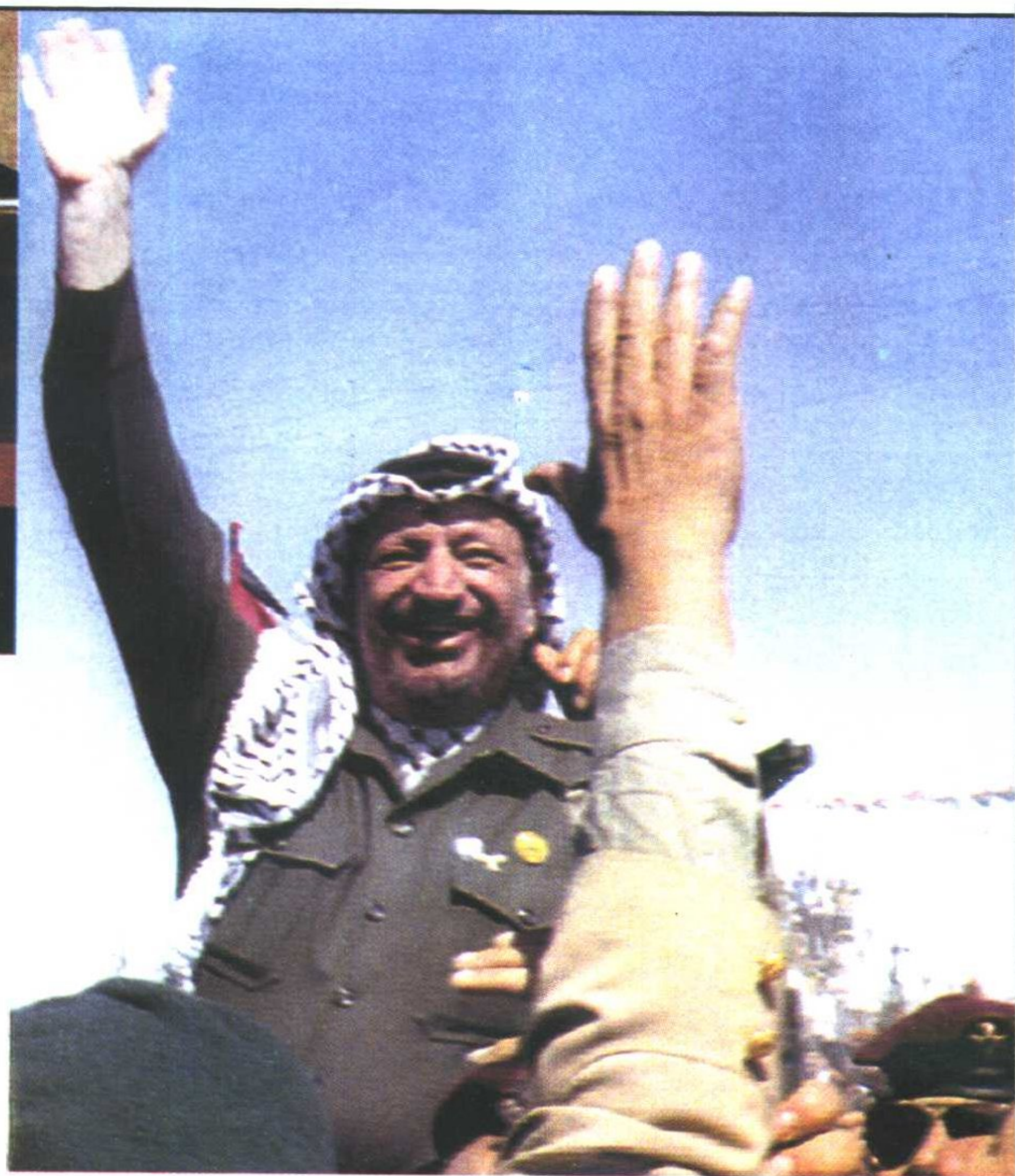
右上：1994年7月1日，阿拉法特回到阔别27年的加沙。人们簇拥着把这位巴解英雄抬起，阿拉法特眼噙泪水，向欢呼人群致意。