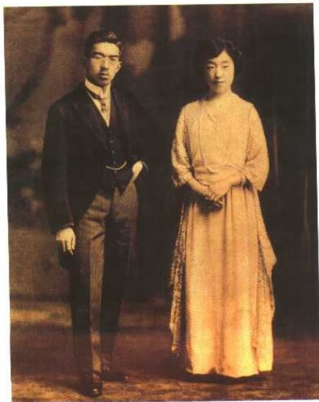
1923年，刚刚结婚的裕仁皇太子与良子皇太子妃。