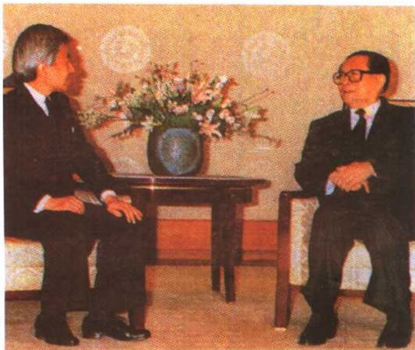
1992年4月，江泽民访日期间会见明仁天皇。