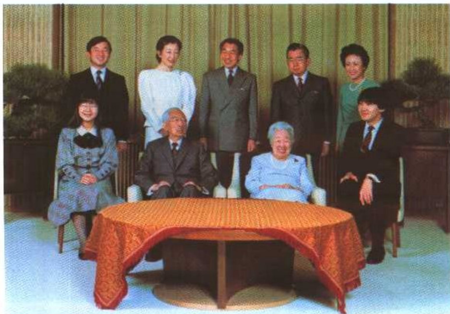
天皇一家。前排左起：纪宫清子、昭和天皇、良子皇后、礼宫文仁。后排左起：浩宫德仁、美智子皇太子妃、明仁皇太子、常陆宫正仁、常陆宫妃。