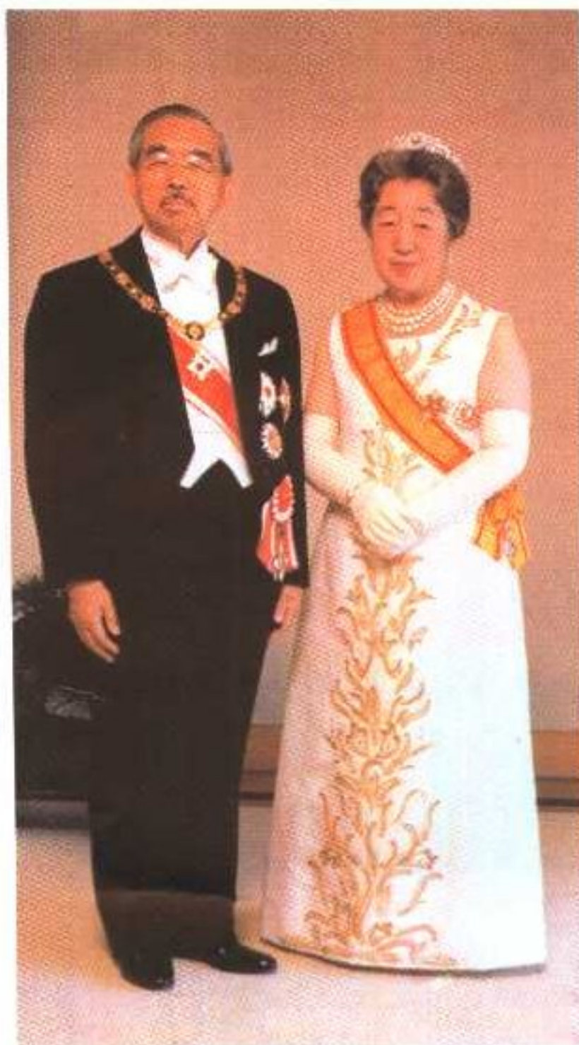
昭和天皇与良子皇后摄于1975年