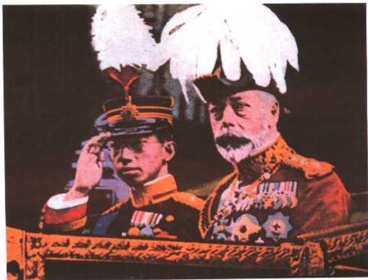
1921年，英王乔治五世陪同访英的裕仁皇太子乘马车前往白金汉宫。