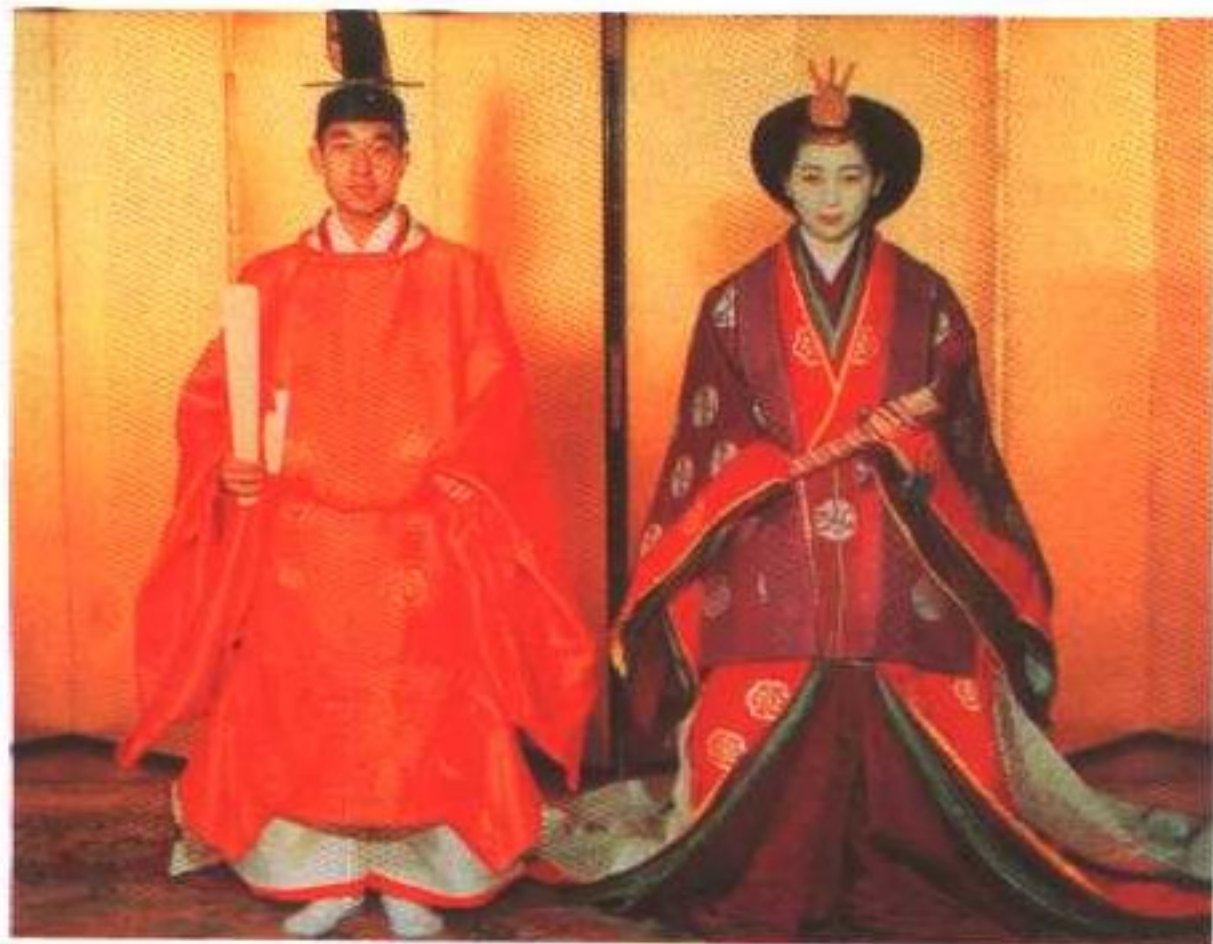
1959年4月10日，明仁皇太子与美智子皇太子妃举行大婚之礼。