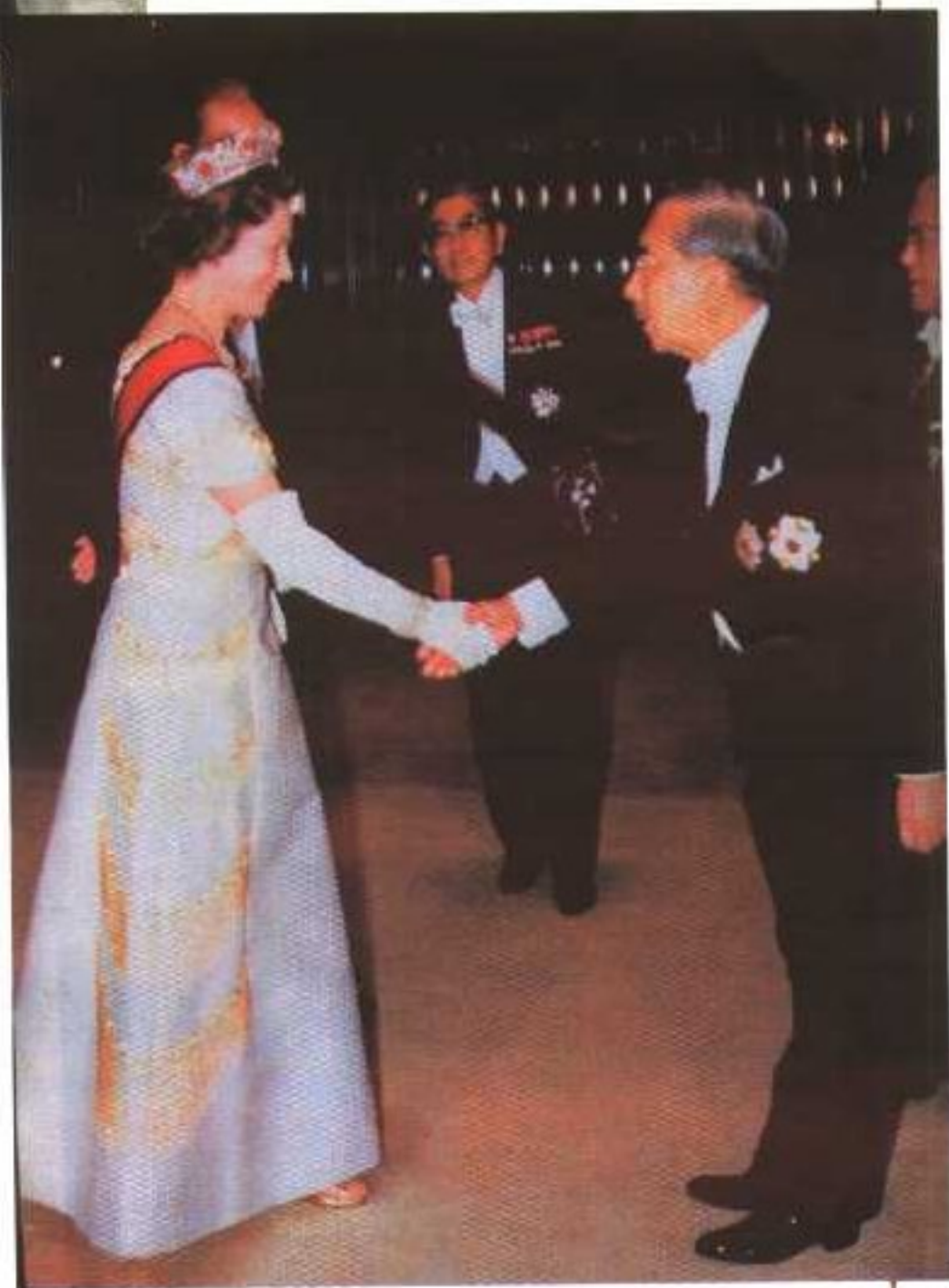
英国女王伊丽莎白二世访日，昭和天皇在宫中举行宴会欢迎英女王。