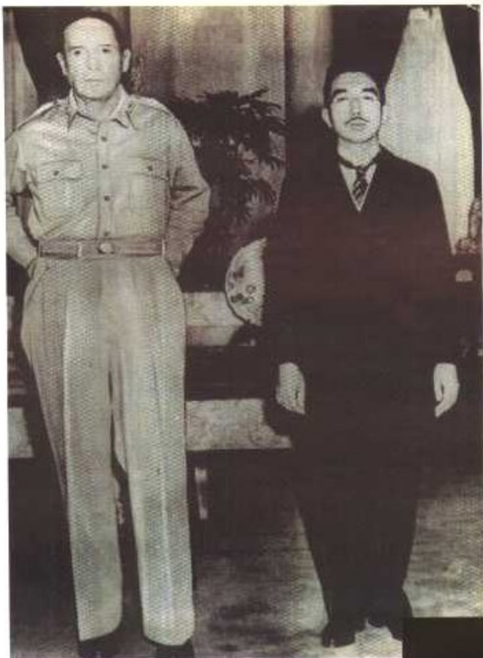
一九四五年九月二十七日，昭和天皇前往美国驻日使馆，拜见驻日盟军最高司令官麦克阿瑟。