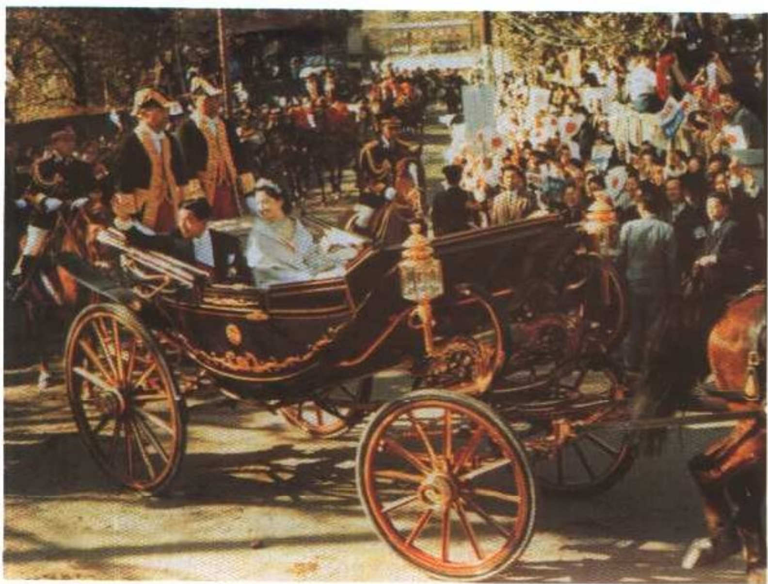
新婚的明仁皇太子与美智子皇太子妃乘坐富丽古雅的马车，路边聚集了53万群众庆贺婚礼。