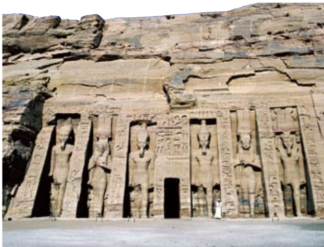
🔥 · 这六尊雕像被雕刻在拉美西斯二世为其妻涅菲尔塔丽修建的神庙上，其中四尊是拉美西斯二世的雕像，两尊是涅菲尔塔丽的雕像。

随着埃及与赫梯帝国成为友好邻邦，两国经济文化交流日益频繁，这时候，埃及新都比一拉美西斯便越来越多地穿梭着来自亚、非两洲的人，他们目睹这个古老国度的崭新首都如此宏伟、如此繁华，禁不住将对它的