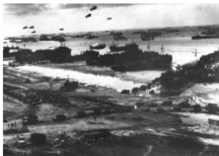
盟军在诺曼底登陆

1944年,欧洲战事正酣。盟军发起了诺曼底登陆战役,一举突破了德军苦心经营的“大西洋壁垒”,在欧洲开辟了第二战场。登陆后,盟