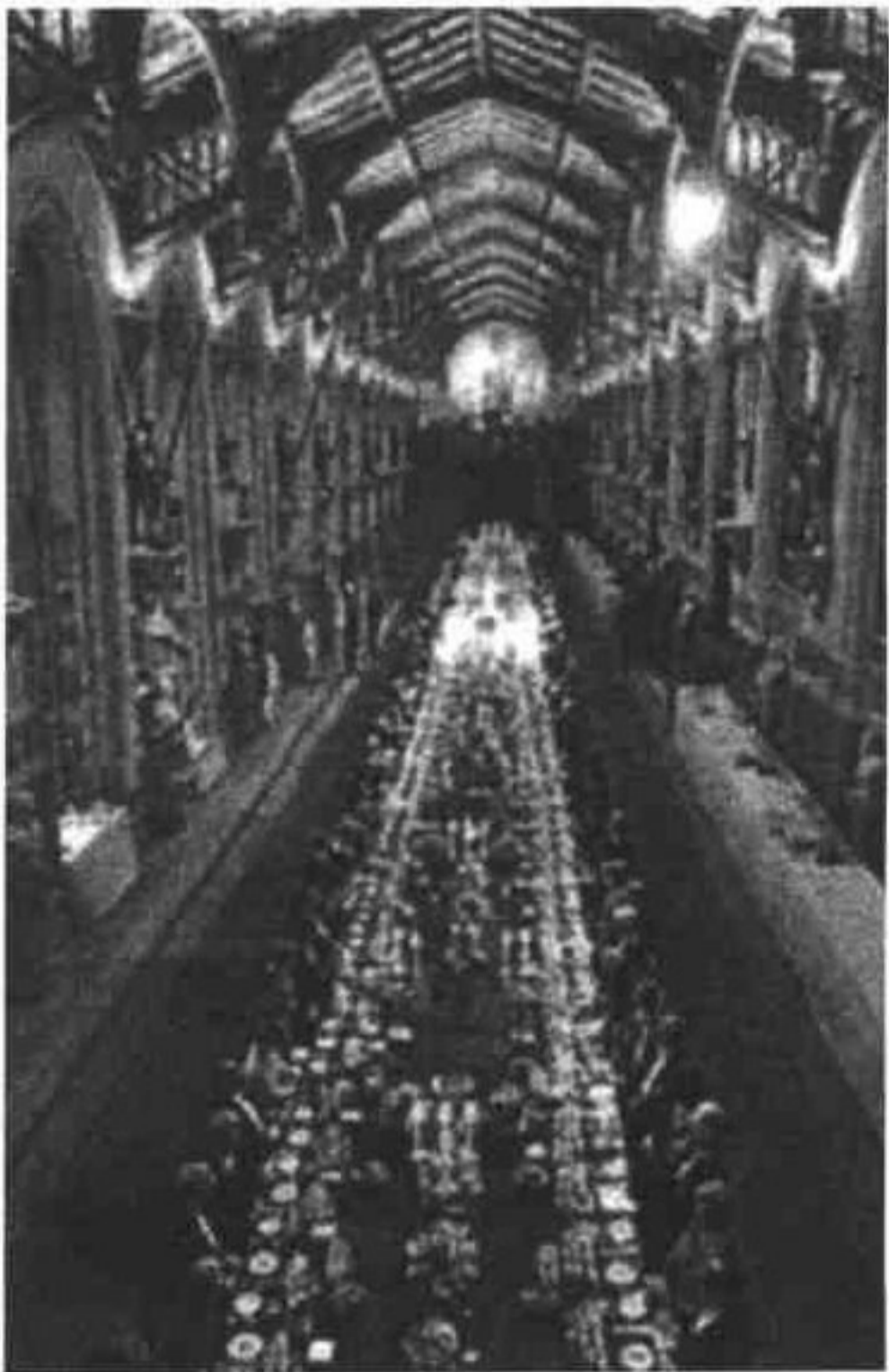
英国国宴气派非凡

中国的国宴菜具有色、香、味、型俱佳的特点，很具民族特色，在世界上享有盛誉。它的组配和烹饪非常考究，既注重营养价值，又重视滋补养生的功效。尤其