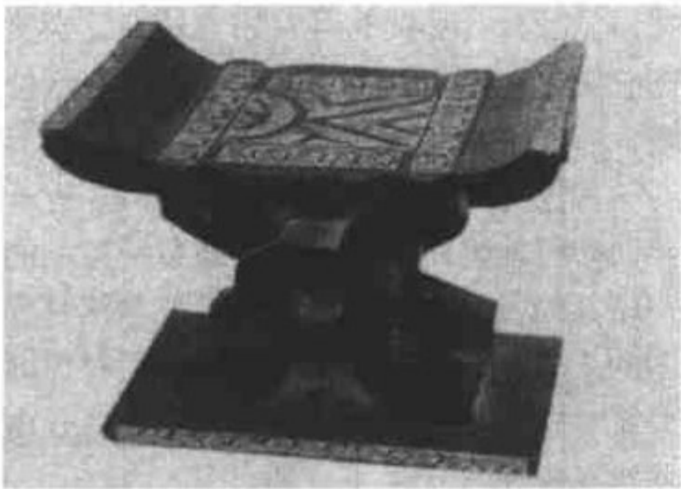
象征王权的加纳金凳。向外国领导人赠送仿制金凳是最友好的表示。

送礼把握不准对方喜好也会出问题。俄罗斯总统叶利钦得知美国总统克林顿喜爱萨克斯管，为了讨好他，便让著名工匠专门为克林顿制作了一支，十分精美。谁