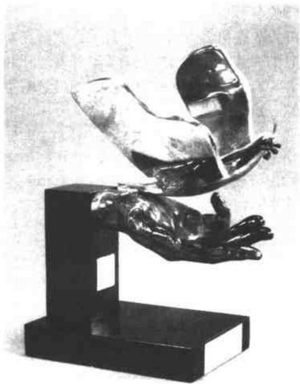
1987年5月，联合国秘书长佩雷斯·德奎利亚尔赠给中国领导人邓小平的铜镀金掌托和平鸽。

就，他将一条去过太空的狗所生的小狗送给了肯尼迪总统。有趣的是，当苏联大使将小狗送到肯尼迪手里的时候，小狗吓得尿了尿。