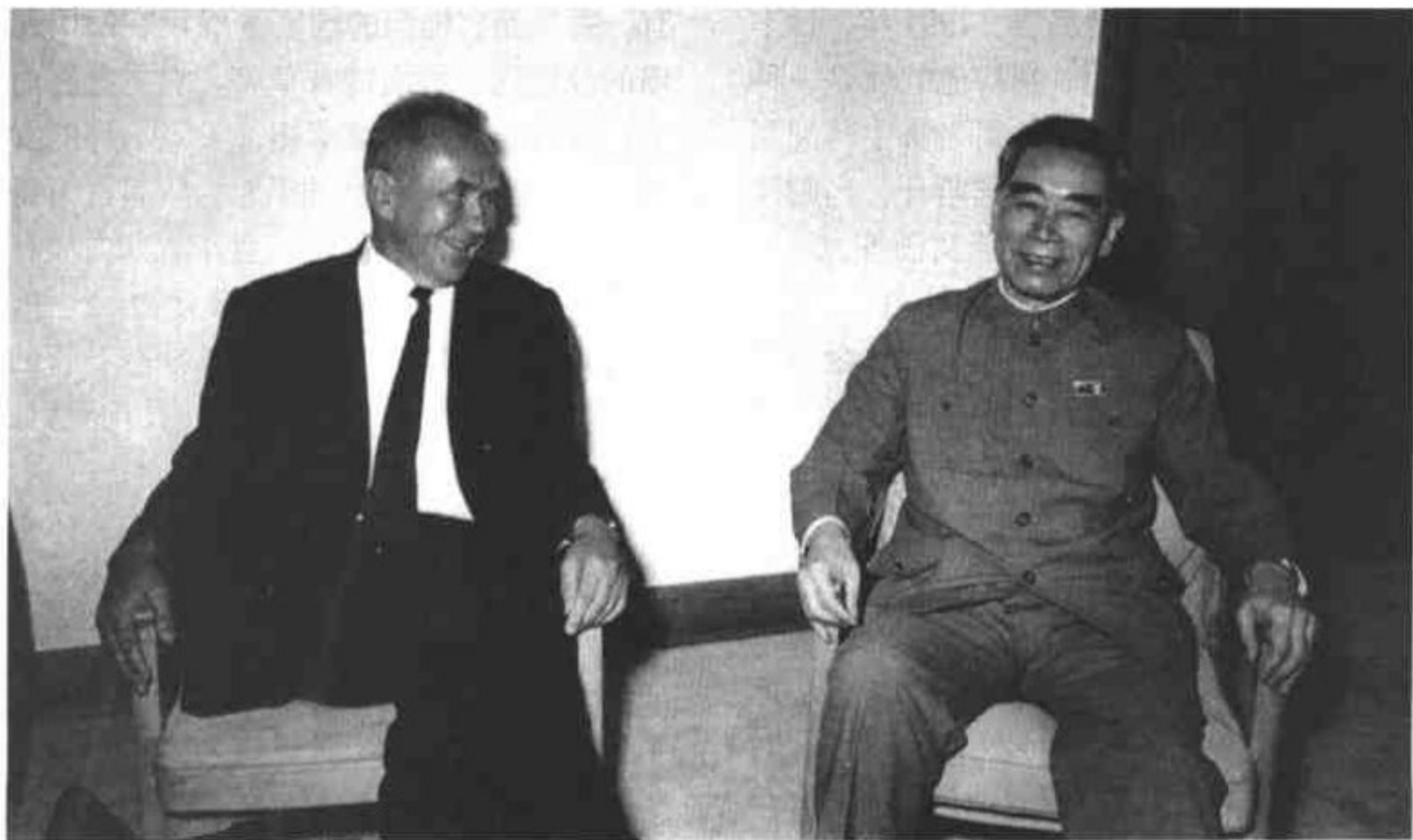
1969年9月周恩来在北京首都机场会见柯西金

吃！”周恩来看出他的心态，问道：“柯西金同志，还需要吗？”出人意料的是，柯西金竟毫不推辞地说：“很好吃，还需要。”