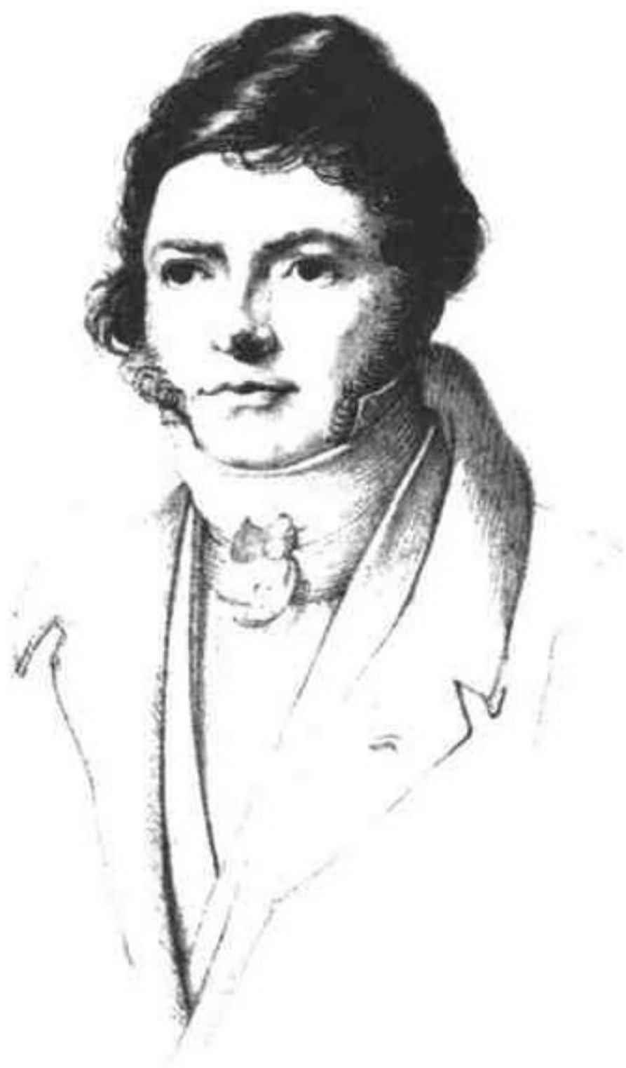
法国天才文字学家商博良

1808年，商博良在前人研究的基础上，开始了对《罗塞达碑》上的古埃及象形文字进行了长达14年的潜心研究。他对碑石中的三种文字进行了比较研究，用希腊文与埃及象形文对应比较的办法，首先破译出象形文字中的“托勒密”国王的名字，并由此受到启发，推测埃及象形文字可能不光表意，还表音。于是，他将代表“托勒密”象形文字变化成罗马字母加以表示，然后，再用罗马字母去拼读象形文字。他用这种办法成功地找出了亚历山大等好几个人名。他还将埃及象形文字和俗体文字进行比较，找出了它们的相似之处，并编成对照表。然后进行互换验证，并与有关的其它的碑文、资料进行对比，从中找出规律。经过长期努力，释读工作终于取得突破性进展。1822年9月29日，商博良将他的研究成果写成论文《就象形文字拼音问题给M·达西先生的信》在巴黎科学院大会上做了宣读。与会者肯定了他的研究成果，报以热烈的掌声。这一天，也被认为是埃及学的誕生日。从此，古埃及象形文