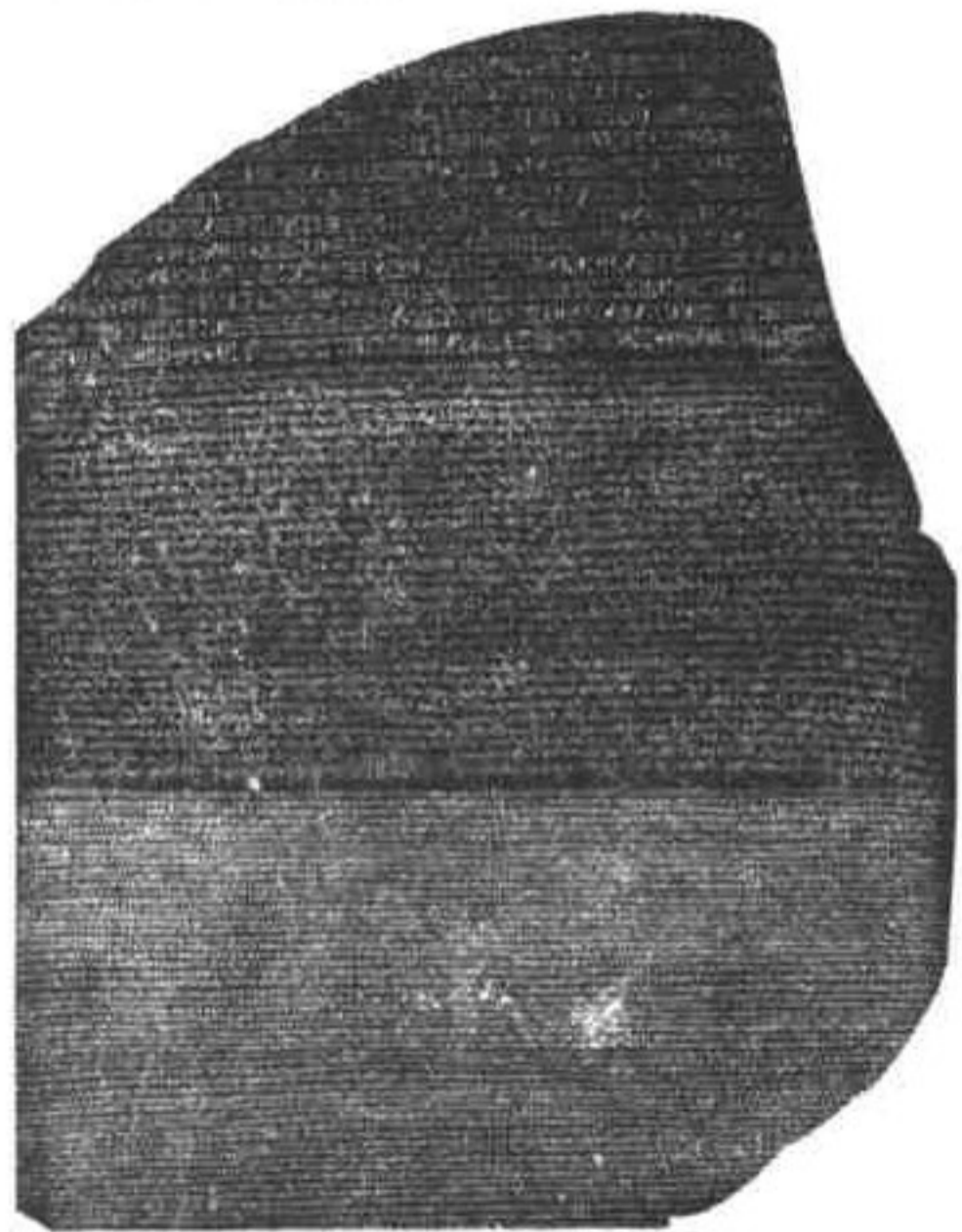
《罗塞达碑》。1799年法国士兵在埃及罗塞达镇挖战壕时发现。上刻埃及象形文字、埃及俗体文和希腊文三种文字。

在世界古文字的研究中，有两处文字对古文字的释读起过重要作用。一是位于伊朗克尔曼沙市贝希斯顿村的《贝希斯顿铭文》。这段铭文刻在一块巨大岩壁上，由三种楔形文字组成。通过对它的研究，专家们解开了西亚楔形文字之谜。另一个是在埃及罗塞达镇发现的《罗塞达碑》，这上面也有三种文字，专家们通过对它的研究，解开了古埃及象形文字之谜。