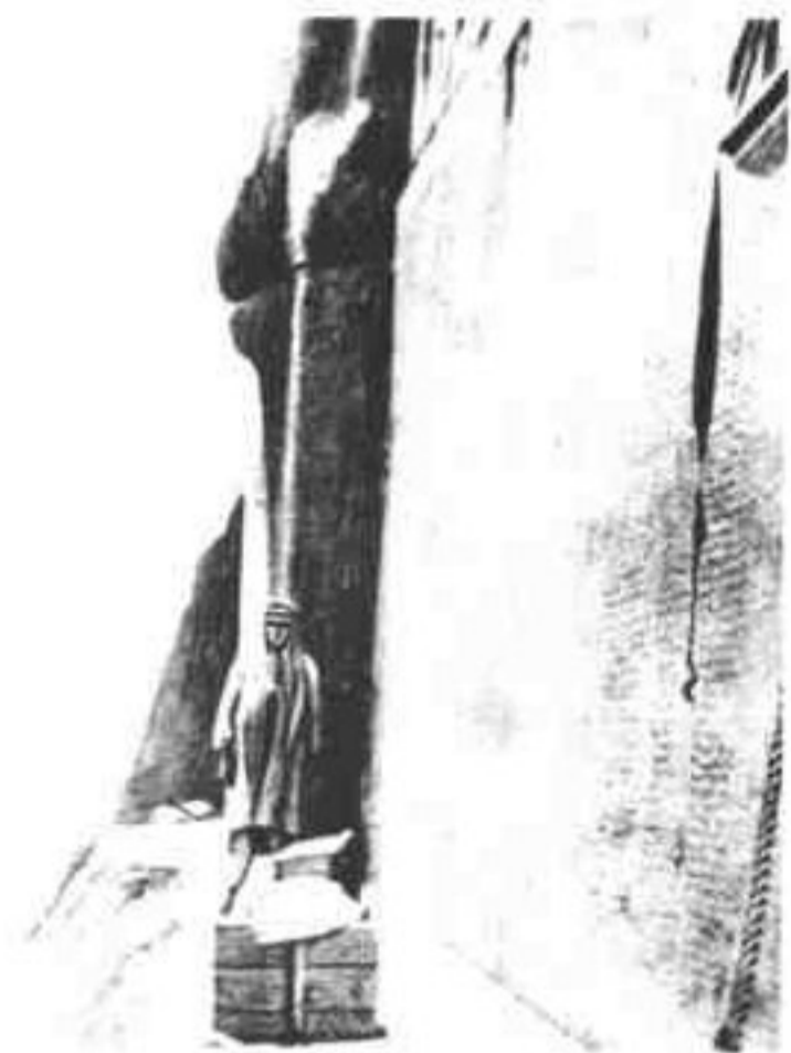
《贝希斯顿铭文》刻在离地面约100米的巨大岩壁上。上刻有波斯文、埃兰文和巴比伦文三种文字。