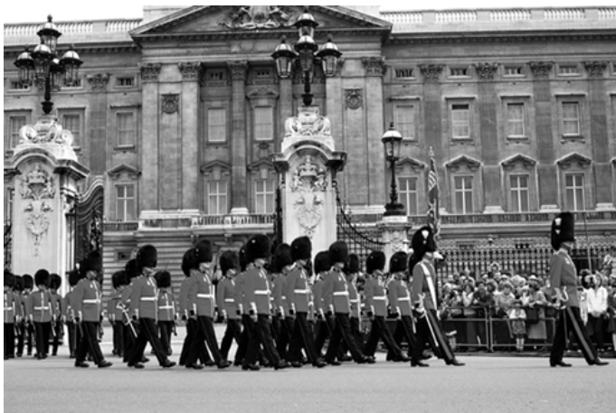
白金汉宫前禁卫军交接仪式

典仪厅、会客厅、舞厅、音乐厅、画廊、图书室、集邮室等厅室较为重要。这些厅室都饰以光彩夺目的冰晶玻璃和雕花玻璃的大吊灯，还设置了金碧辉煌的天花板，铺着高级豪华的地毯，其家具和陈设品都是稀世