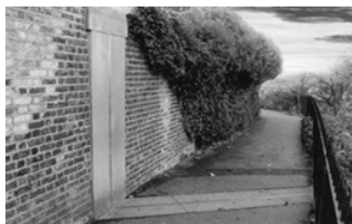
通过格林威治天文台的本初子午线

英国摄政王汉弗莱于 15 世纪初在这里建了一座用来窥视进入伦敦的船只的瞭望塔。1675 年，当时在位的英王查理二世将瞭望塔改建成英国皇家格林威治天文台。1884 年，国际天文工作者决