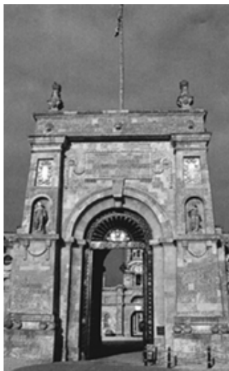
布莱尼姆宫的东门

宫。此外，这个宫殿的建筑也吸收了意大利建筑的部分因素。浪漫主义是布莱尼姆的主要风格特征。