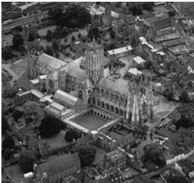
从空中俯视坎特伯雷大教堂

由回廊、会议厅、寓所、教堂、食堂、医院等建筑组成,建筑庞大,可以供150名修道士修行。这个修道院后又于公元7~8世纪成为神学中心。11世纪,修道院内又建造了一座连接修道院教堂和圣玛利亚教堂的圆殿,并修建了一座用来安葬坎特伯雷的几位大主教的新教堂。