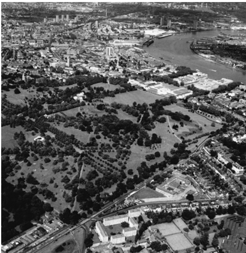
格林威治海岸地区景观