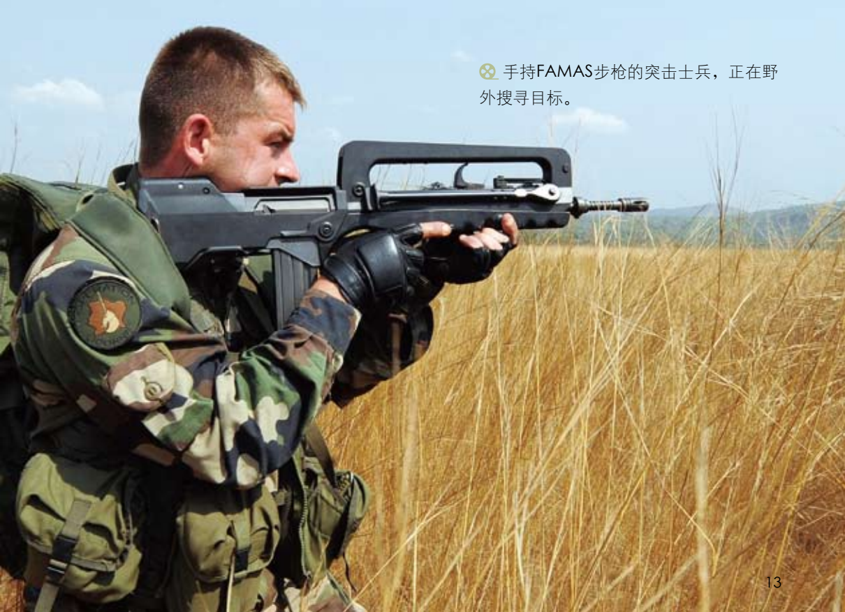
手持FAMAS步枪的突击士兵，正在野外搜寻目标。