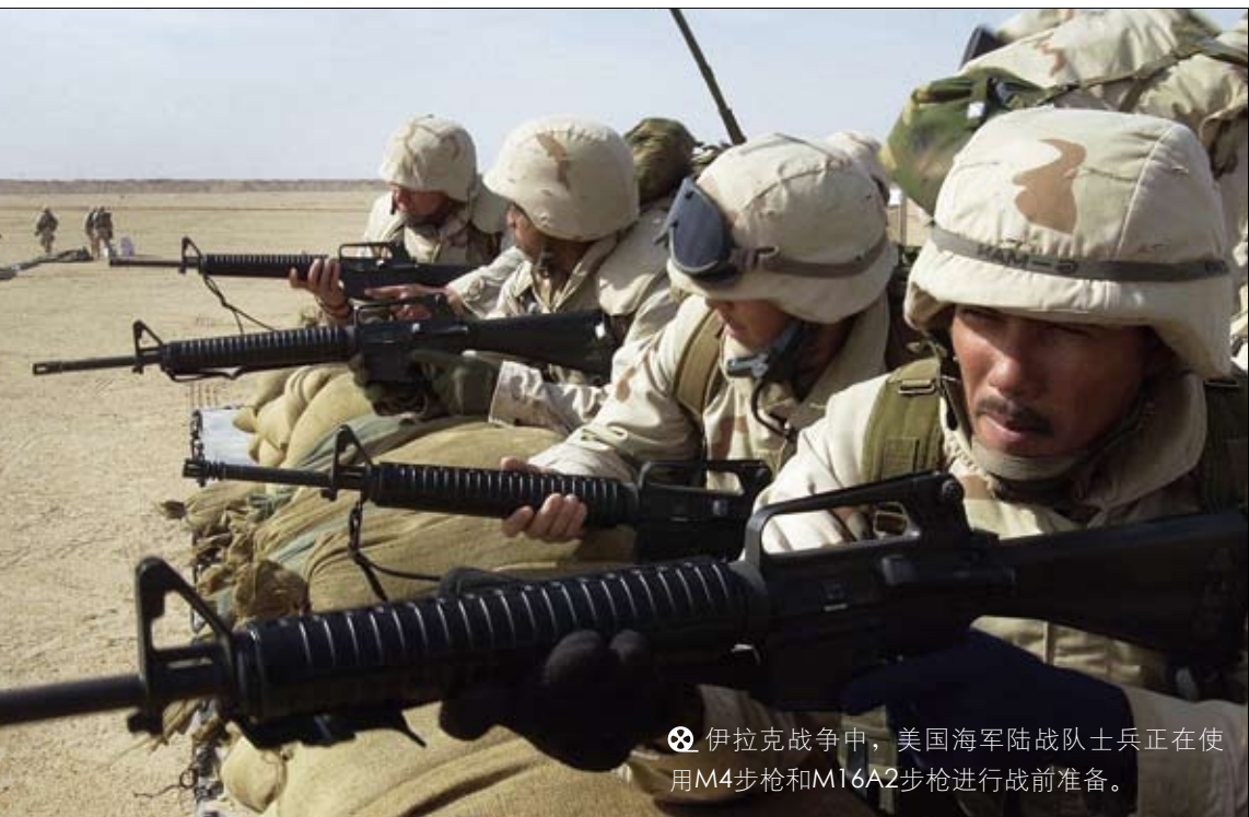
🔫 伊拉克战争中，美国海军陆战队士兵正在使用M4步枪和M16A2步枪进行战前准备。