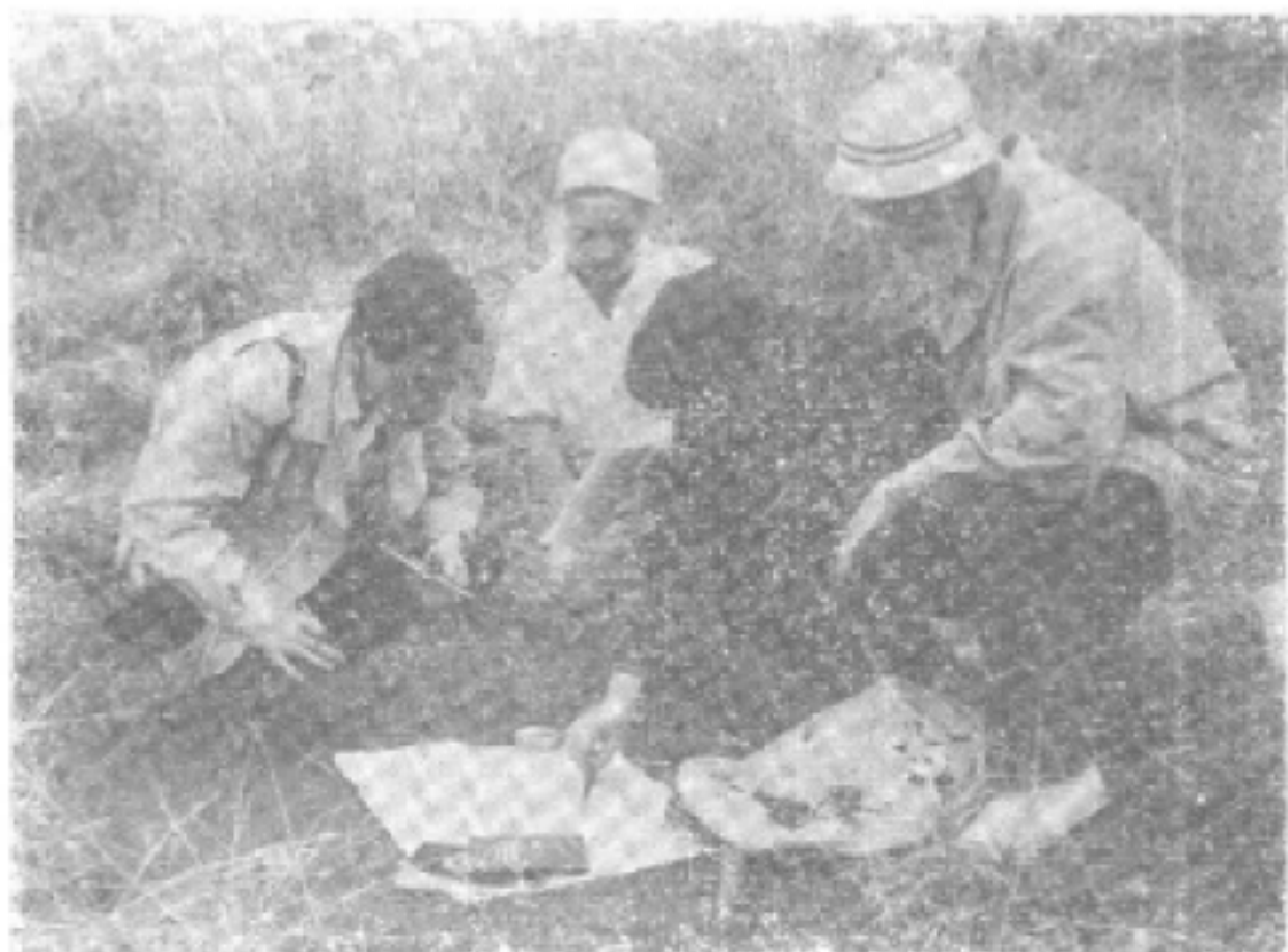
图三：中外专家在始兴马市镇铺背考察“红层”