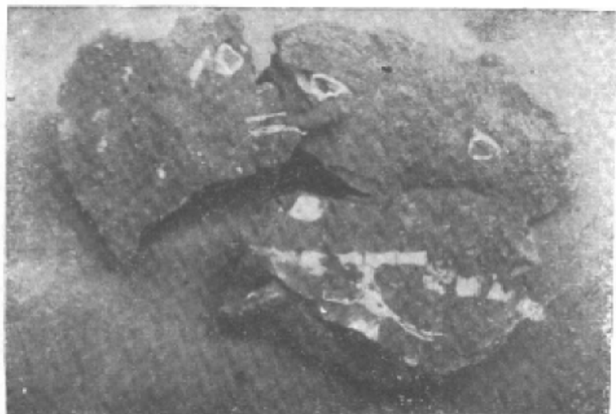
图二：始兴出土的恐龙骨化石