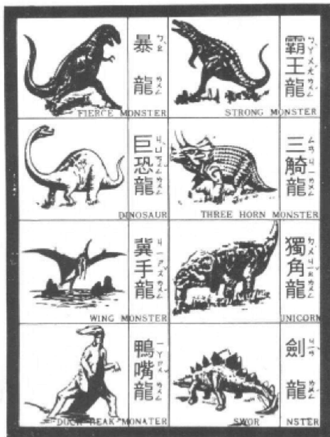
图五：原载台湾始兴同乡会会刊《墨江》第五期