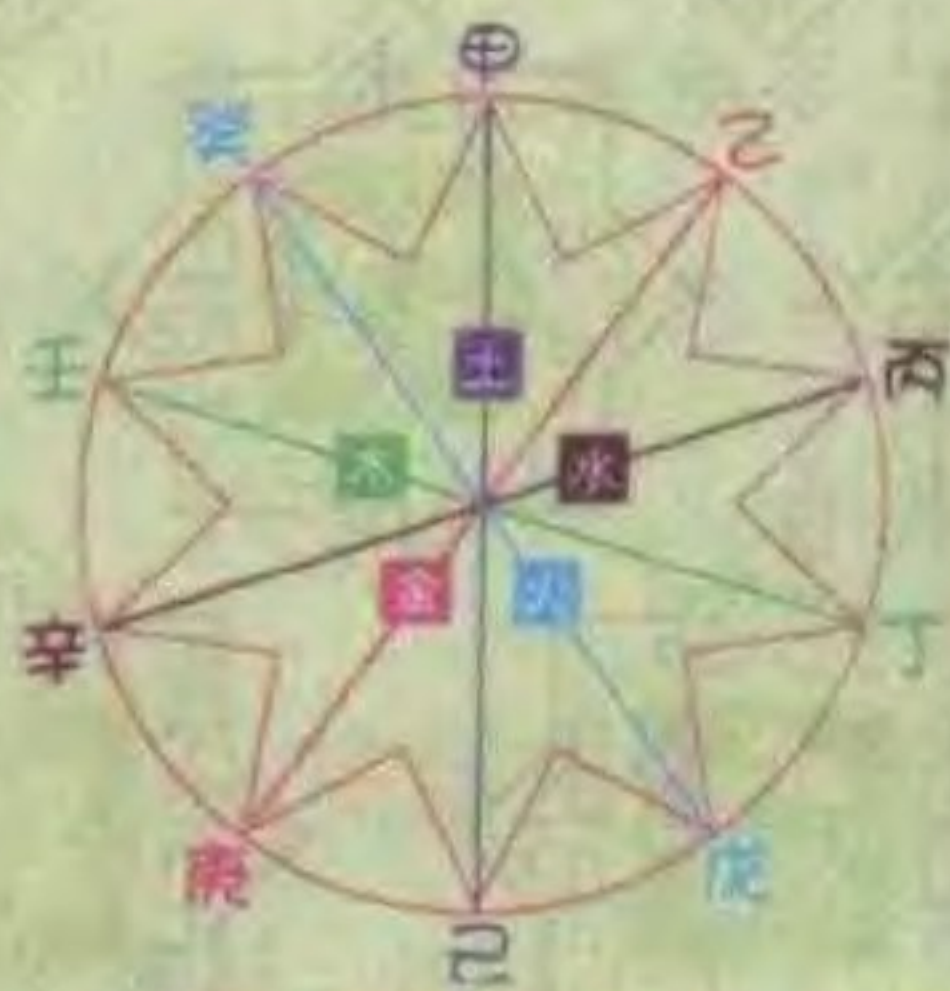
天干相合的关系图表

在此你或许会有疑问，六十甲子图表，应该是从甲子一直排到癸亥，共六十个组合，但第8页图却从甲申开始排。其实这两种排法都一样，只要读者从肖鼠那一行横排，就可找到“甲子”，如此推算下去，所得答案都一样。而本书这种编法，主要是让读者了解十二生肖与天干、地支的关系。