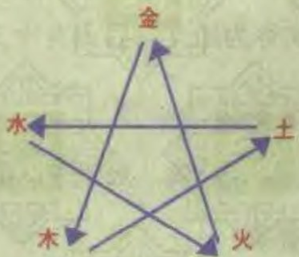
五行相克的关系图表