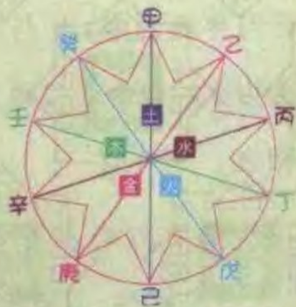
天干相合的关系图表

在此你或许会有疑问，六十甲子图表，应该是从甲子一直排到癸亥，共六十个组合，但第8页图却从甲申开始排。其实这两种排法都一样，只要读者从肖鼠那一行横排，就可找到“甲子”，如此推算下去，所得答案都一样。而本书这种编法，主要是让读者了解十二生肖与天干、地支的关系。