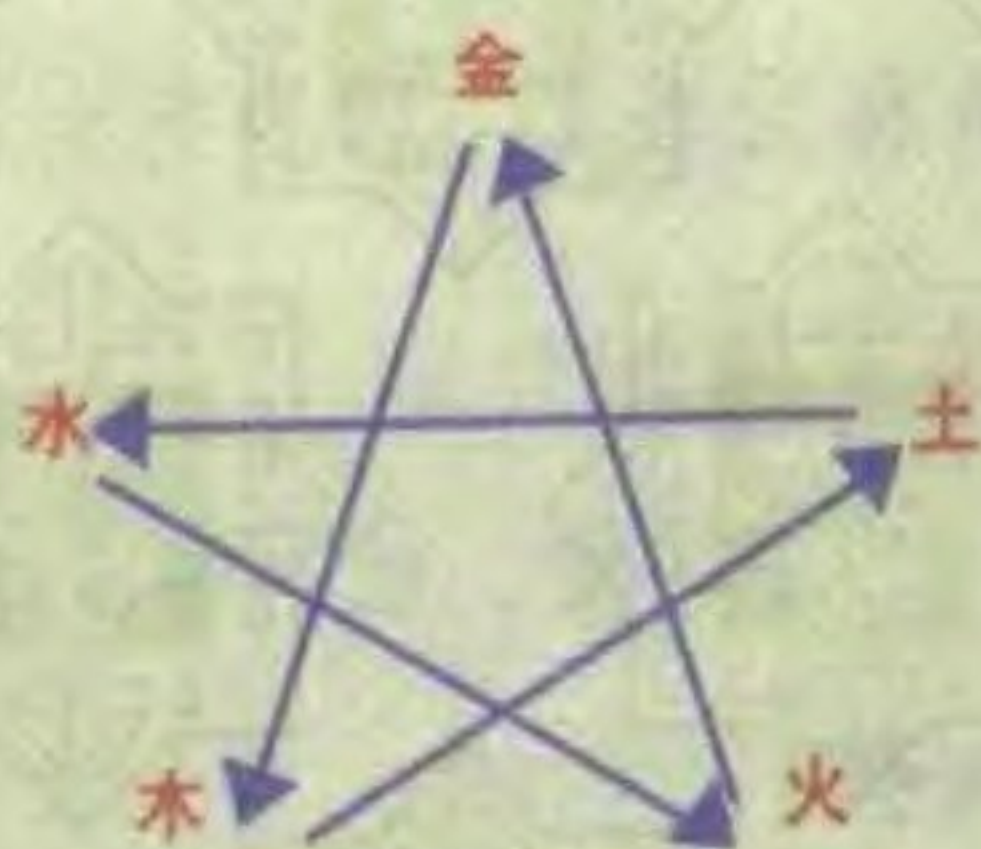
五行相克的关系图表