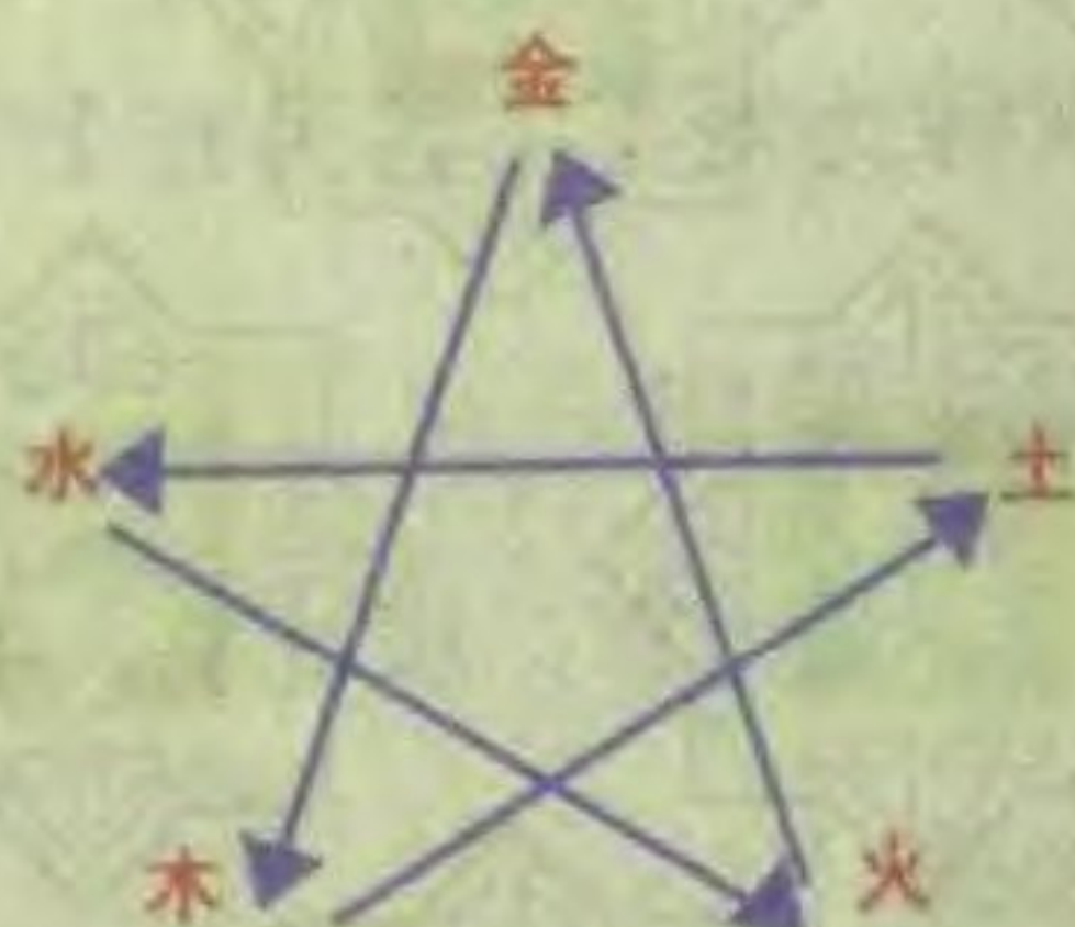
五行相克的关系图表