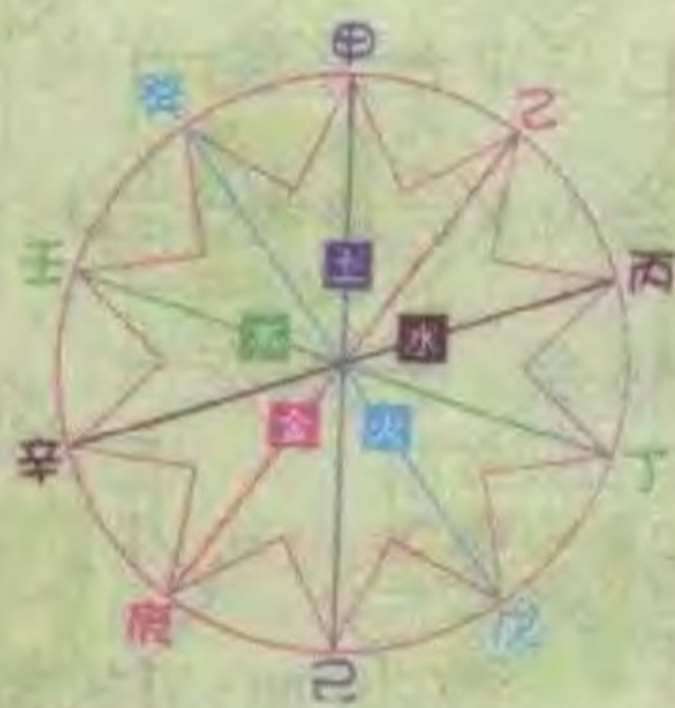
天干相合的关系图表

在此你或许会有疑问，六十甲子图表，应该是从甲子一直排到癸亥，共六十个组合，但第8页图却从甲申开始排。其实这两种排法都一样，只要读者从肖鼠那一行横排，就可找到“甲子”，如此推算下去，所得答案都一样。而本书这种编法，主要是让读者了解十二生肖与天干、地支的关系。