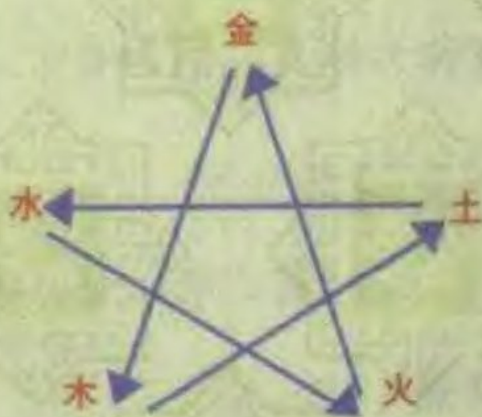
五行相克的关系图表