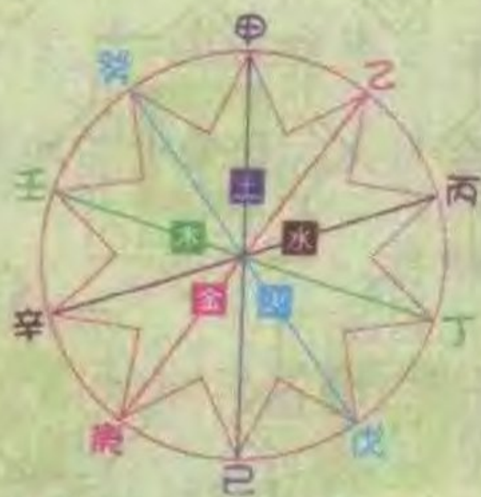
天干相合的关系图表

在此你或许会有疑问，六十甲子图表，应该是从甲子一直排到癸亥，共六十个组合，但第8页图却从甲申开始排。其实这两种排法都一样，只要读者从肖鼠那一行横排，就可找到“甲子”，如此推算下去，所得答案都一样。而本书这种编法，主要是让读者了解十二生肖与天干、地支的关系。