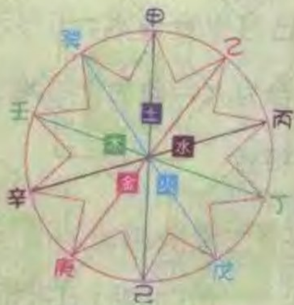
天干相合的关系图表

在此你或许会有疑问，六十甲子图表，应该是从甲子一直排到癸亥，共六十个组合，但第8页图却从甲申开始排。其实这两种排法都一样，只要读者从肖鼠那一行横排，就可找到“甲子”，如此推算下去，所得答案都一样。而本书这种编法，主要是让读者了解十二生肖与天干、地支的关系。