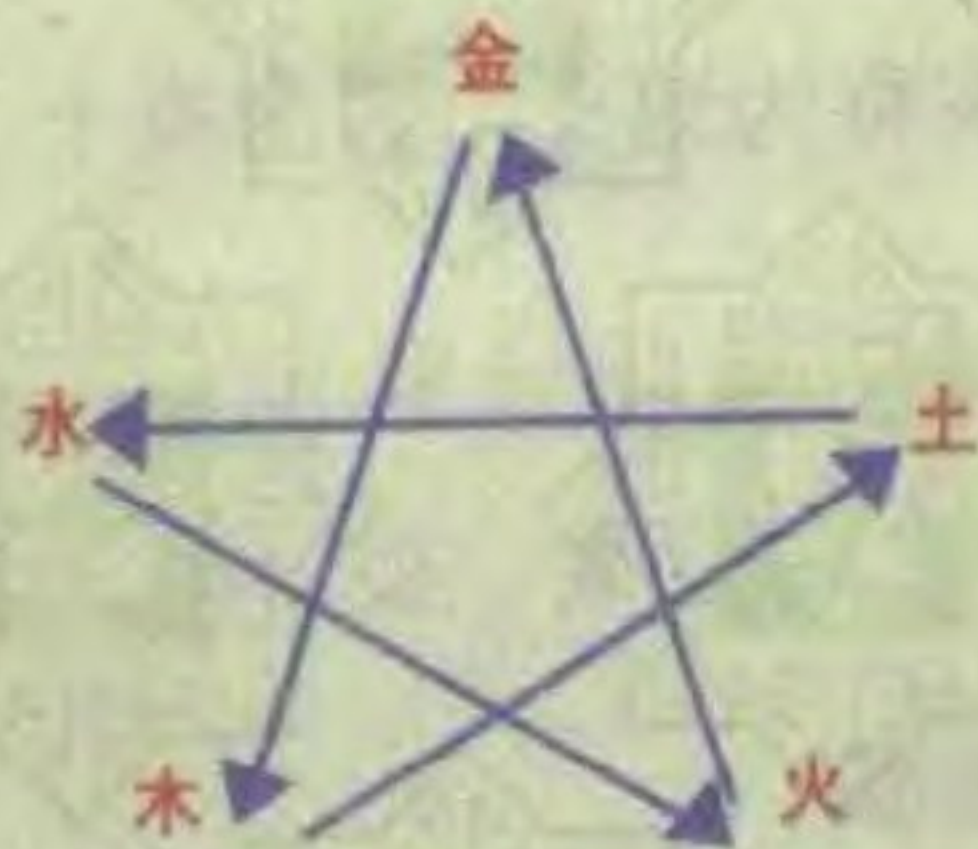
五行相克的关系图表