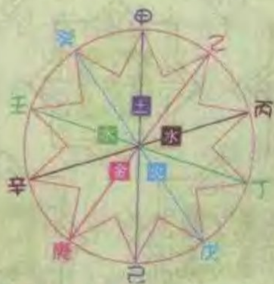
天干相合的关系图表

在此你或许会有疑问，六十甲子图表，应该是从甲子一直排到癸亥，共六十个组合，但第8页图却从甲申开始排。其实这两种排法都一样，只要读者从肖鼠那一行横排，就可找到“甲子”，如此推算下去，所得答案都一样。而本书这种编法，主要是让读者了解十二生肖与天干、地支的关系。