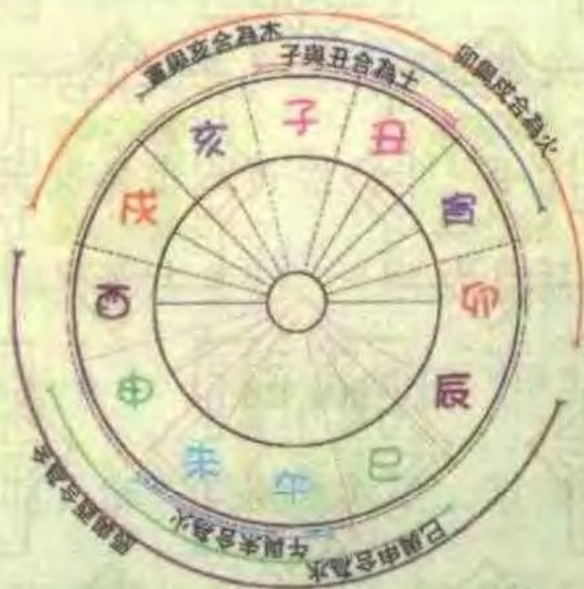
十二地支相合的关系图表

甲与己合为土；乙与庚合为金；丙与辛合为水；丁与壬合为木；戊与癸合为火。此五个组合，称为天干五合。