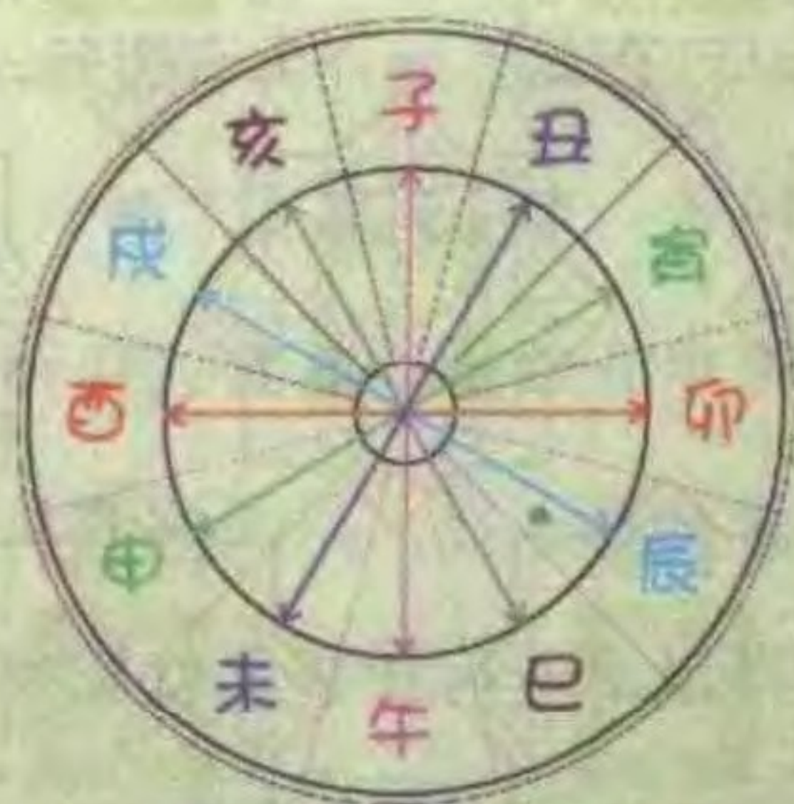
十二地支相冲的关系图表

子与丑合为土；寅与亥合为木；卯与戌合为火；辰与酉合为金；巳与申合为水；午与未合为火。此为十二地支相合。