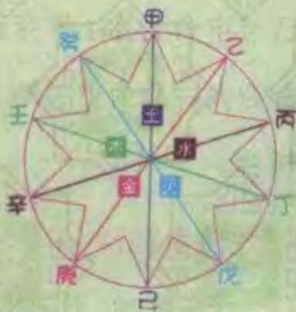
天干相合的关系图表

在此你或许会有疑问，六十甲子图表，应该是从甲子一直排到癸亥，共六十个组合，但第8页图却从甲申开始排。其实这两种排法都一样，只要读者从肖鼠那一行横排，就可找到“甲子”，如此推算下去，所得答案都一样。而本书这种编法，主要是让读者了解十二生肖与天干、地支的关系。