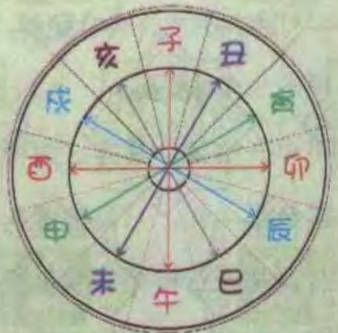
十二地支相冲的关系图表

子与丑合为土；寅与亥合为木；卯与戌合为火；辰与酉合为金；巳与申合为水；午与未合为火。此为十二地支相合。