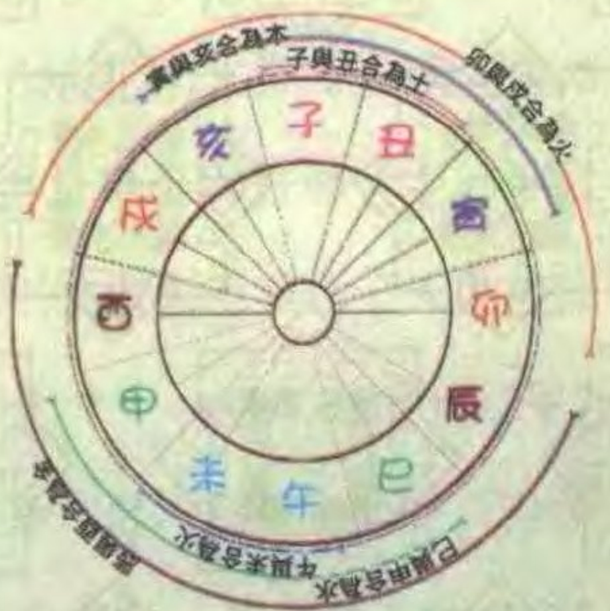
十二地支相合的关系图表

甲与己合为土；乙与庚合为金；丙与辛合为水；丁与壬合为木；戊与癸合为火。此五个组合，称为天干五合。