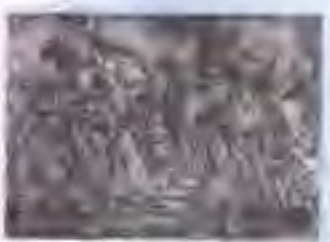
图 7 北宋元 祐中七神仙图