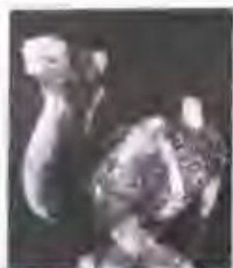
图 3 丝绸之路