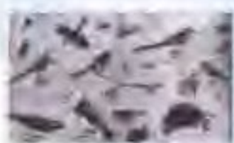
图 4 唐之