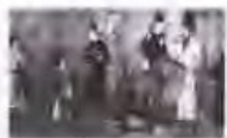
图 5 五代十国 的政权更迭