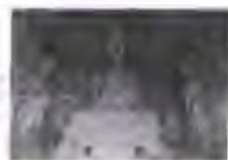
北魏 龙门石窟 高40米