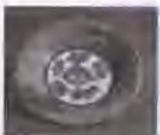
图 6 北宋铜钱