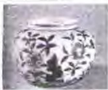
明 青花缠枝花卉纹罐