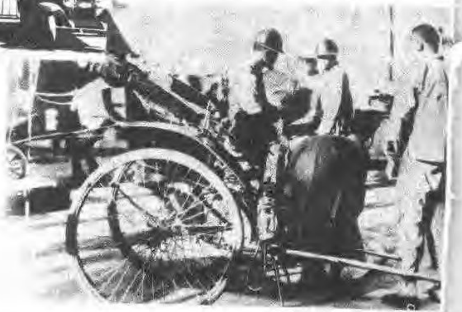
▼日军在小西门外搜索行人