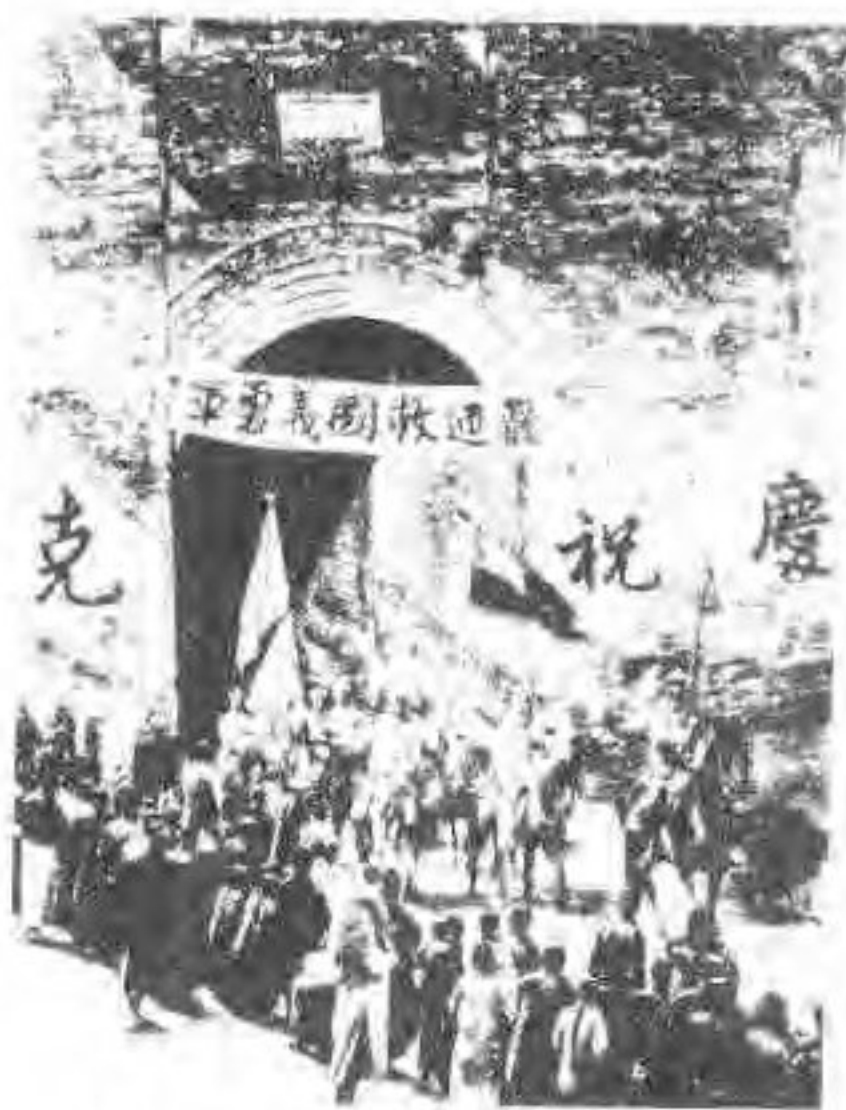
▲1932年春，义勇军攻打沈阳城，由小东门进入城内。这是当时摄下的群众欢迎的情景。