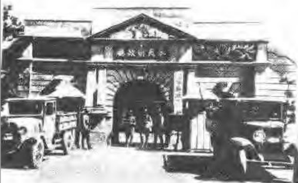
▲日军占据辽宁财政厅