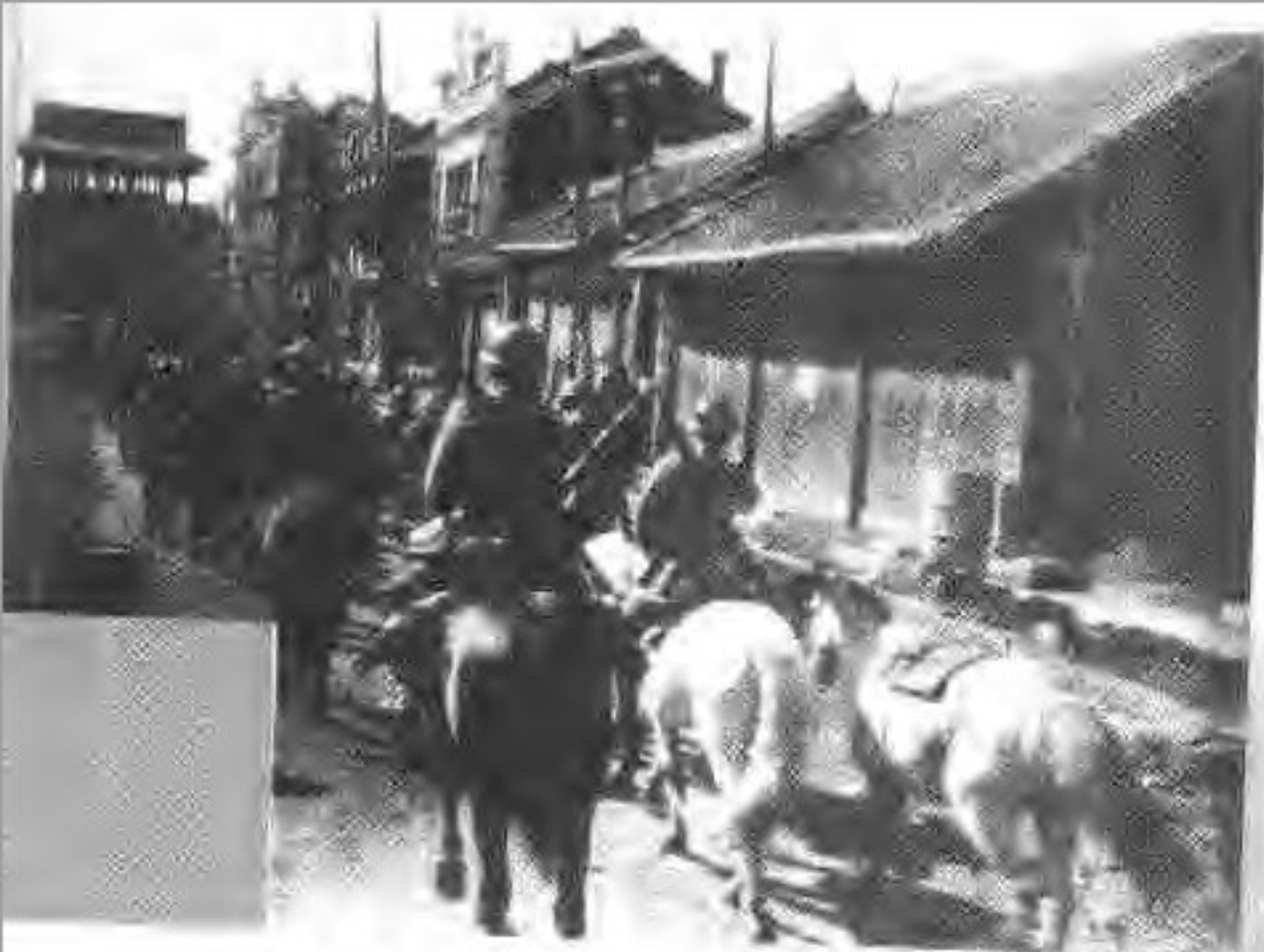
▲日军从小西门入城