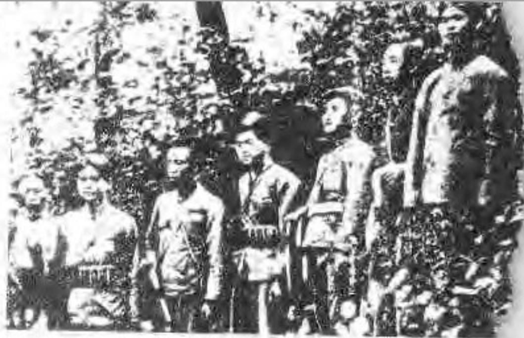
◀ 锦西我军在奋勇抵抗