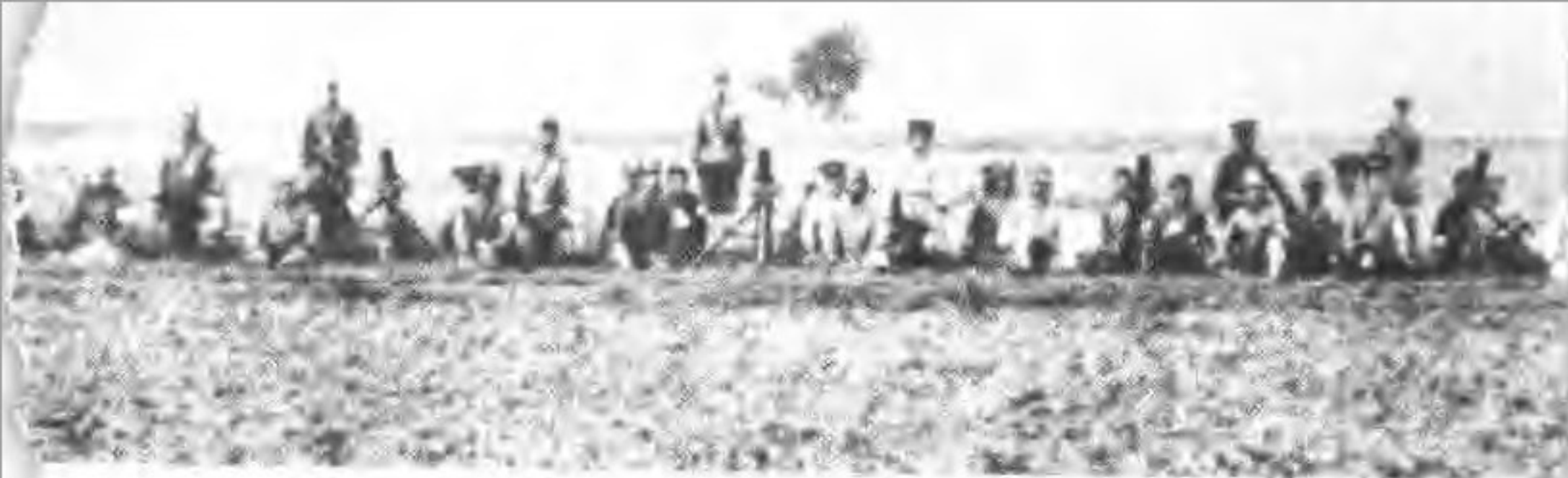
▲日本帝国主义的侵略激起中国人民的强烈反抗。这是东北国民救国军炮兵连之一部。