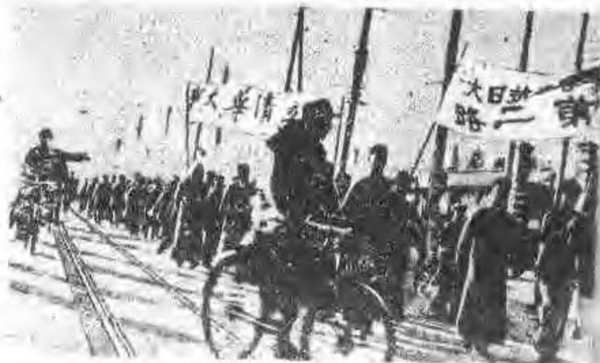
◀ 这是上海人民群欢在上海公共体育场召开市民抗日救国大会