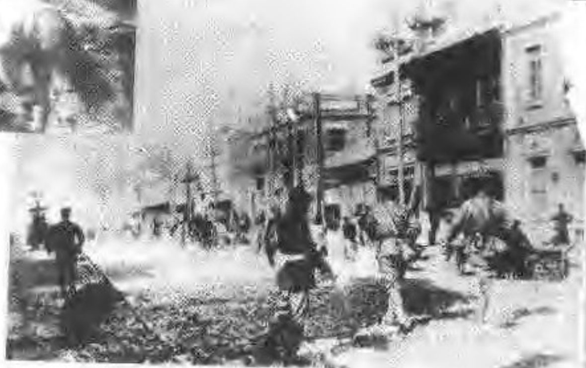
▲日军在城内四平街（现中街）耀武扬威