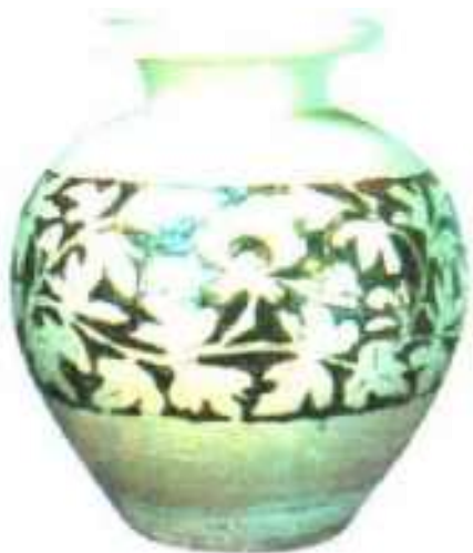
辽·剔花牡丹纹瓷罐

高38.5厘米、口径19.7厘米。大口卷沿，短颈，圆肩，圆腹，平底。腹部施剔雕枝牡丹，空白处填黑，再施透明釉。黑白对比强烈，造型敦厚质朴。