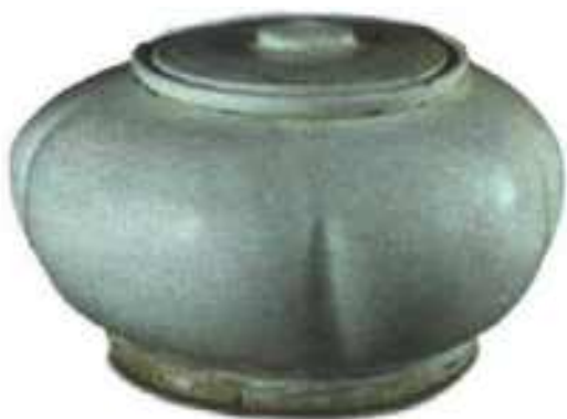
辽·白釉瓜棱形盖罐

不但没有强健起来，反而越来越糟，更谈不上长生不老了。这时候，耶律璟才发现自己受了女巫的骗，亲手