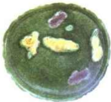
辽·陶三彩刻花鹭莲纹盘

陶盘浅式，九瓣菱花口，盘心平坦，圈足。内底以细线画出荷塘景色，水中一只鹭鸶穿游荷莲中，鹭鸶与莲花涂黄色，荷叶涂葡萄紫色，其余地方施绿釉，十分精美。