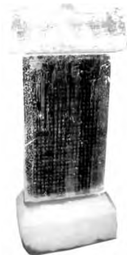
山北村王氏古墓碑