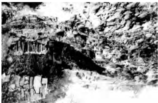
山北村王氏始祖迁徙孟县时在乱窑子山洞穴居

(1041-1048)间，自六世始迁入山西，约金太宗(1123-1137)间，十一世王先世(字云卿)始入孟，穴居县东乱窑子(王世族人称“祖家窑”)。十六世王国泰移徙山北村石头院定居。族人称入孟者王先世为