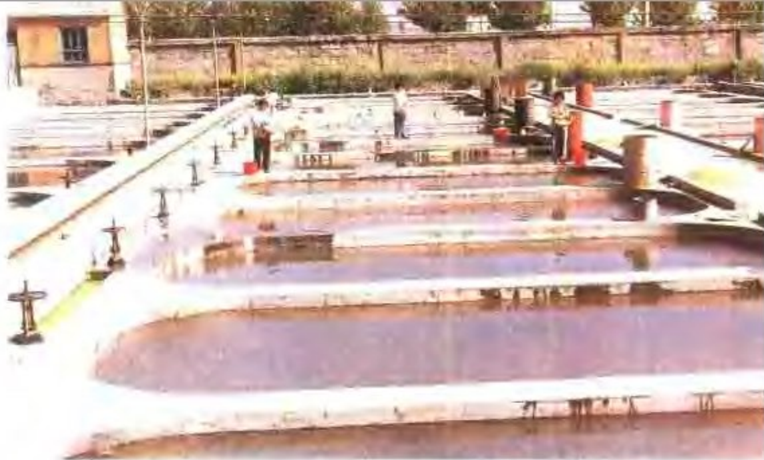
济南郊区温流水养鱼