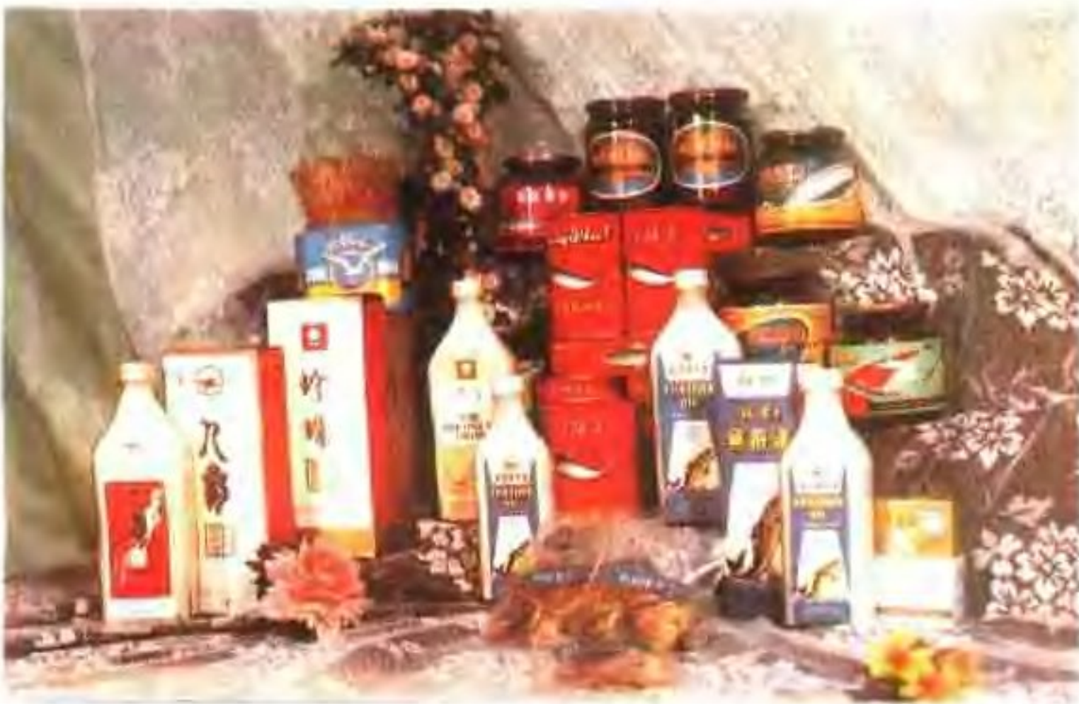
青岛海洋渔业公司部分水产加工产品