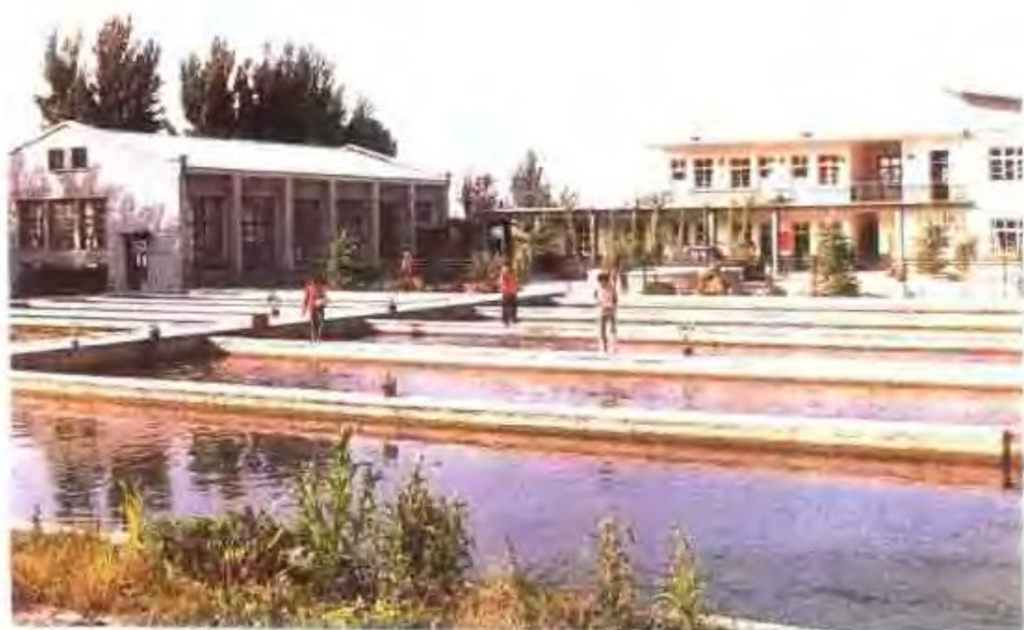
临朐老龙湾网模试验槽 及办公楼