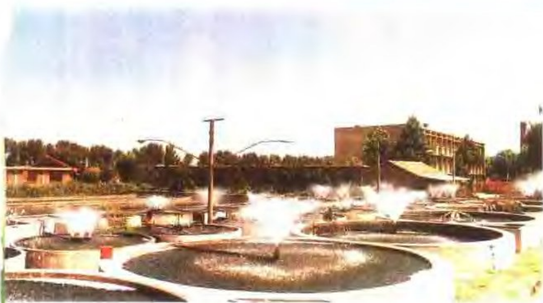
山东青大 水产研究所 温流水养鱼