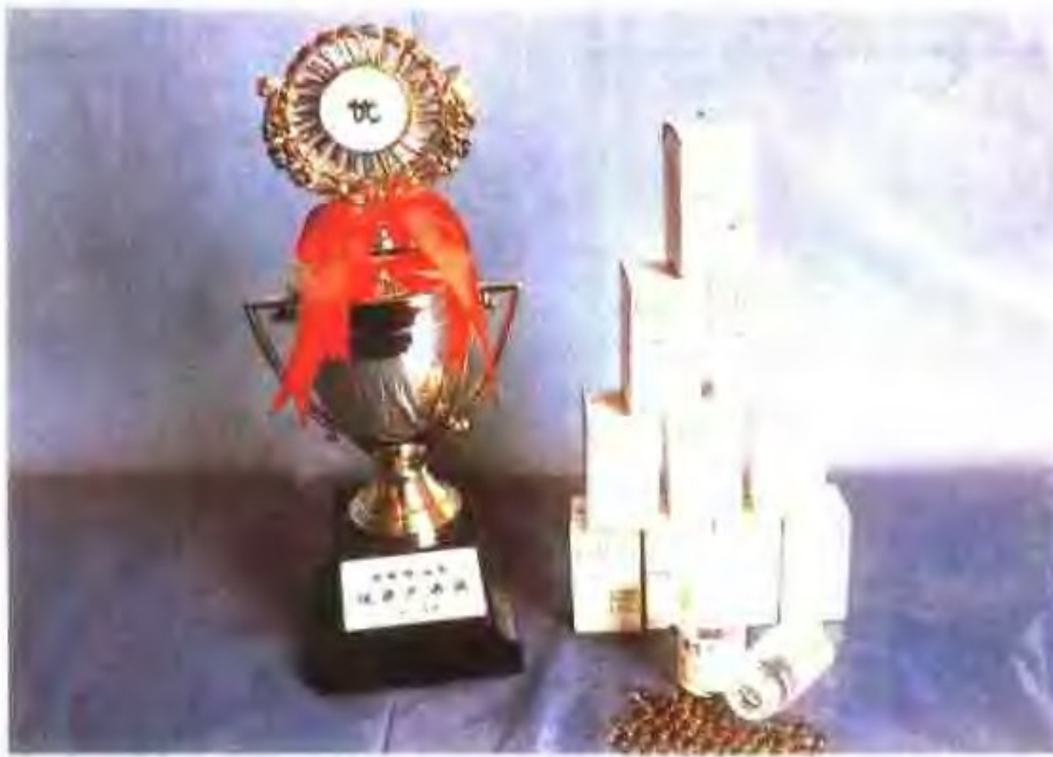
青岛海洋渔业公司获部优奖产品