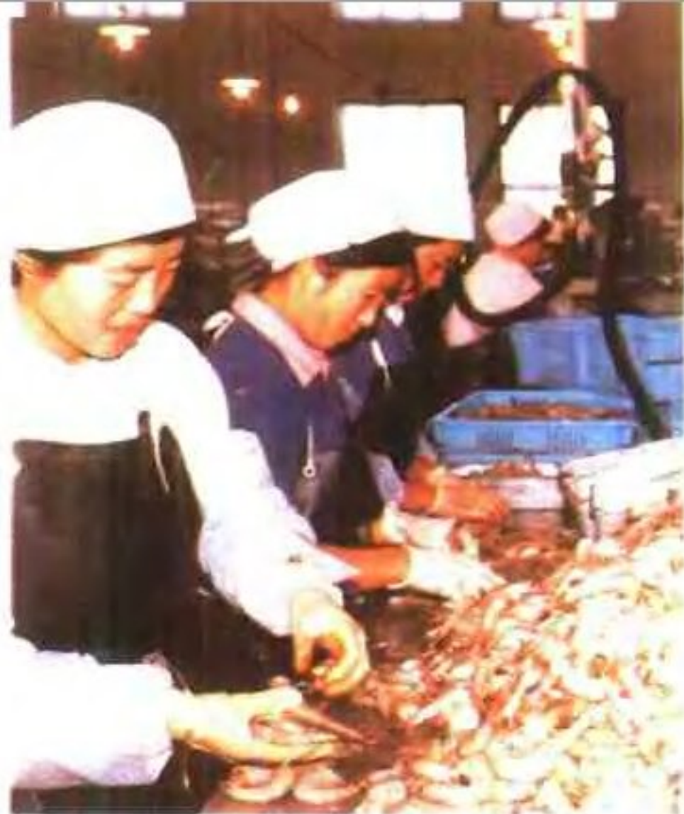
光口水产冷藏厂加工出口 寺元头对虾车间一角