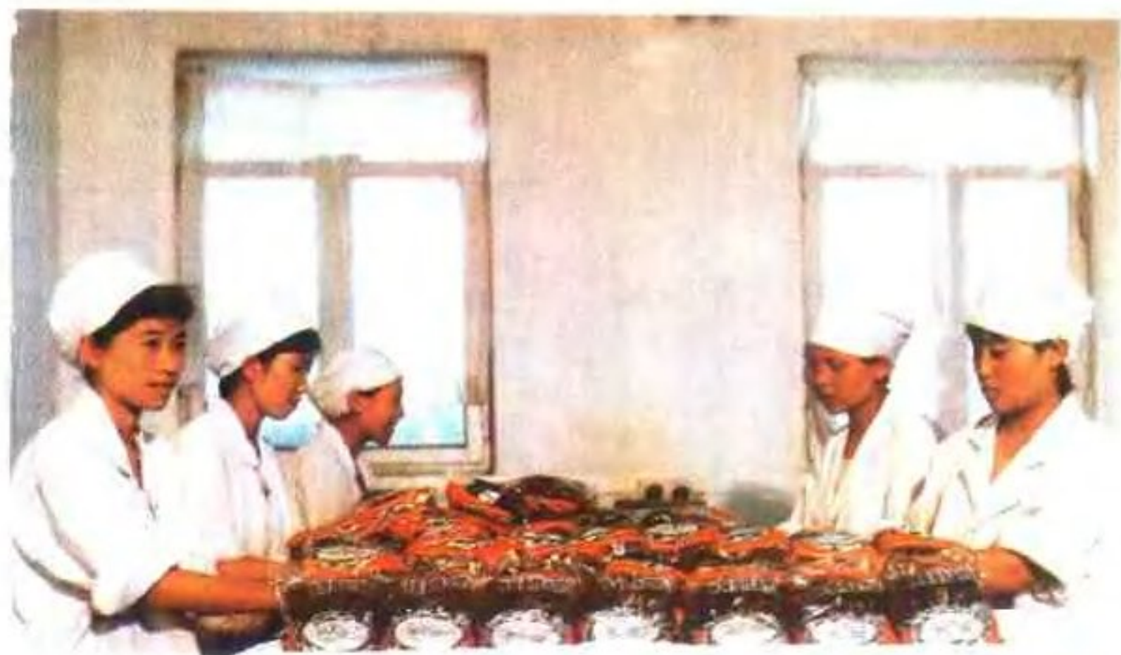
青岛海带小包装食品生产