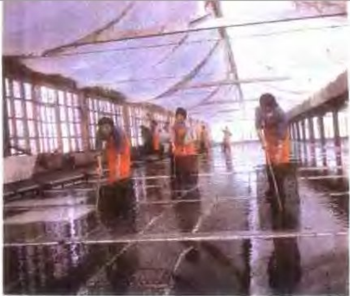
荣成海带自然光育苗室