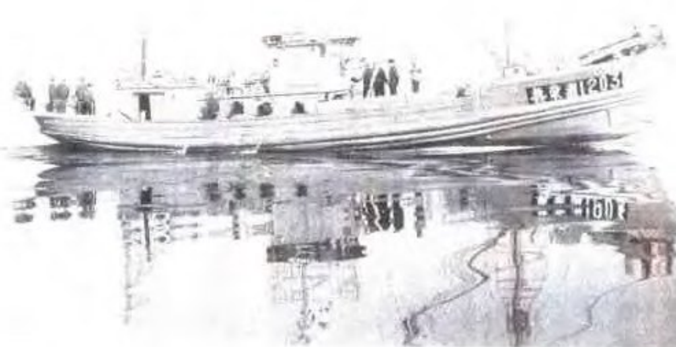
三三三型185马力木质渔船