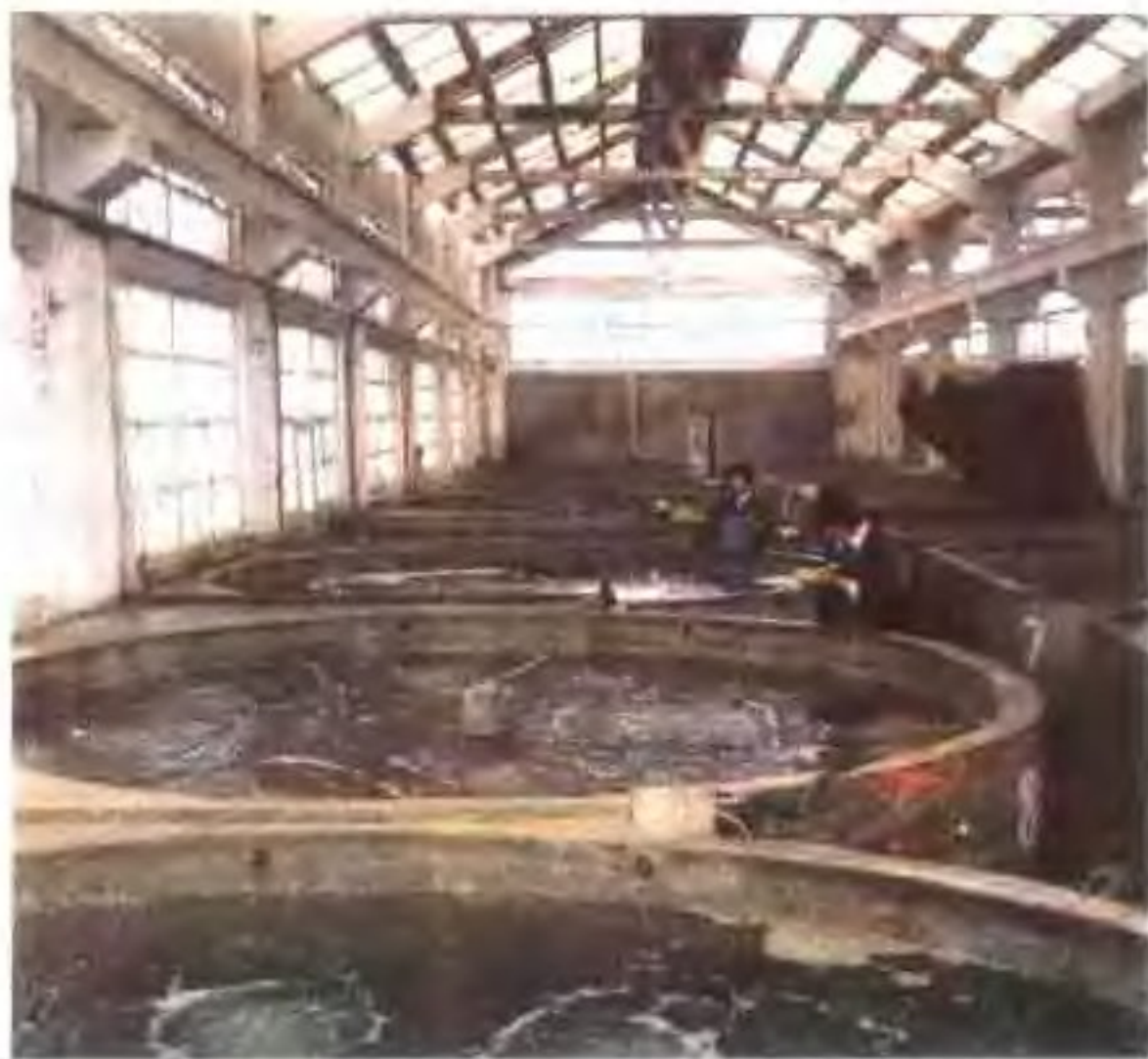
对虾工厂化育苗室