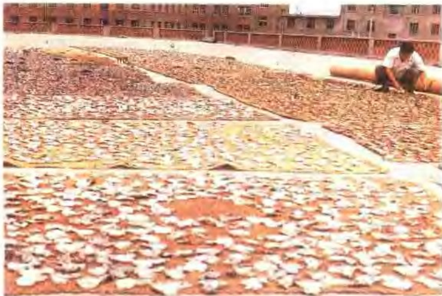
荣成县水产供销公司晒鱼场