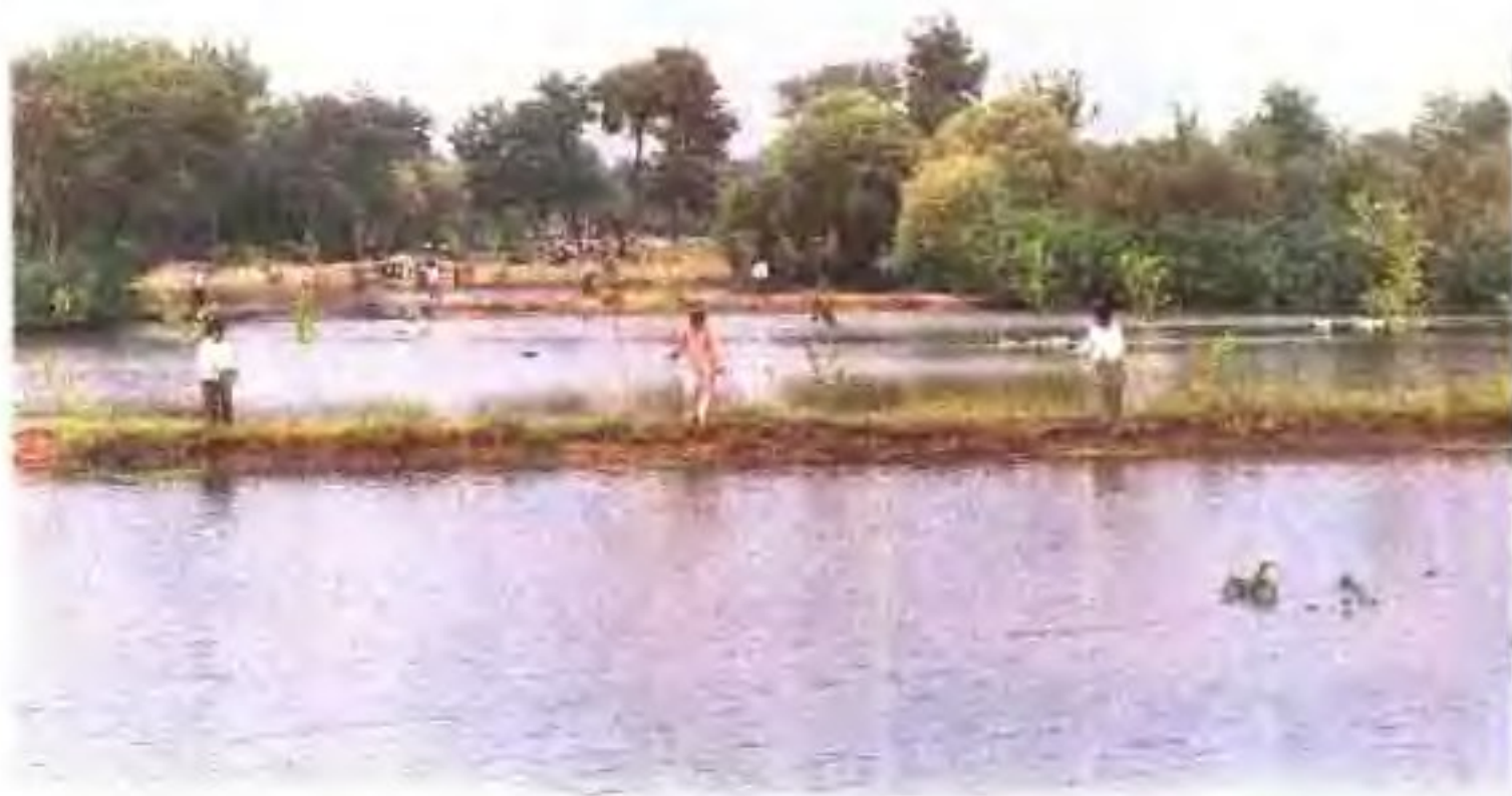
临沂万亩连片池塘养鱼一角