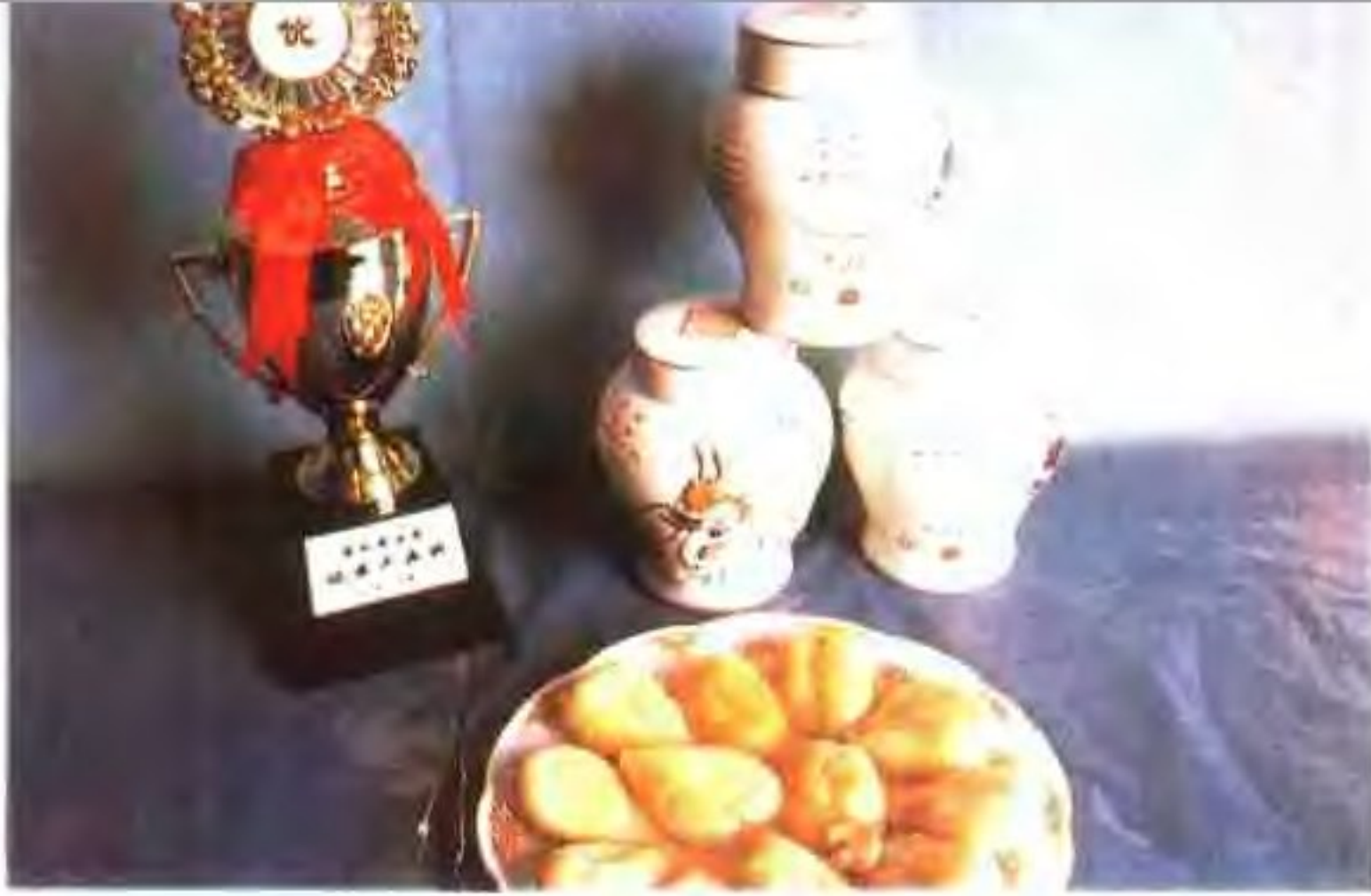
海味一绝——日照乌鱼蛋