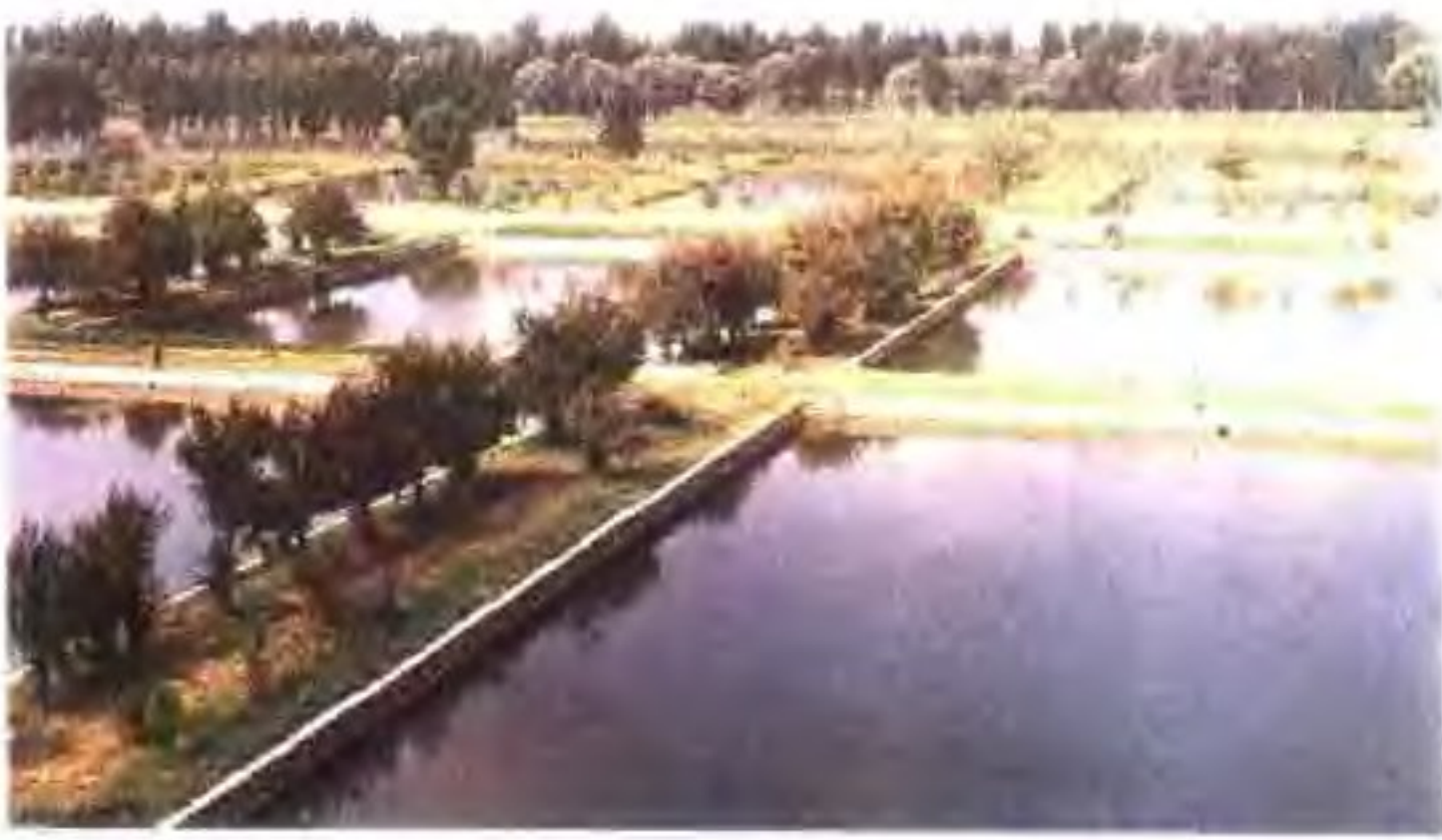
国营郟城水产良种场一角