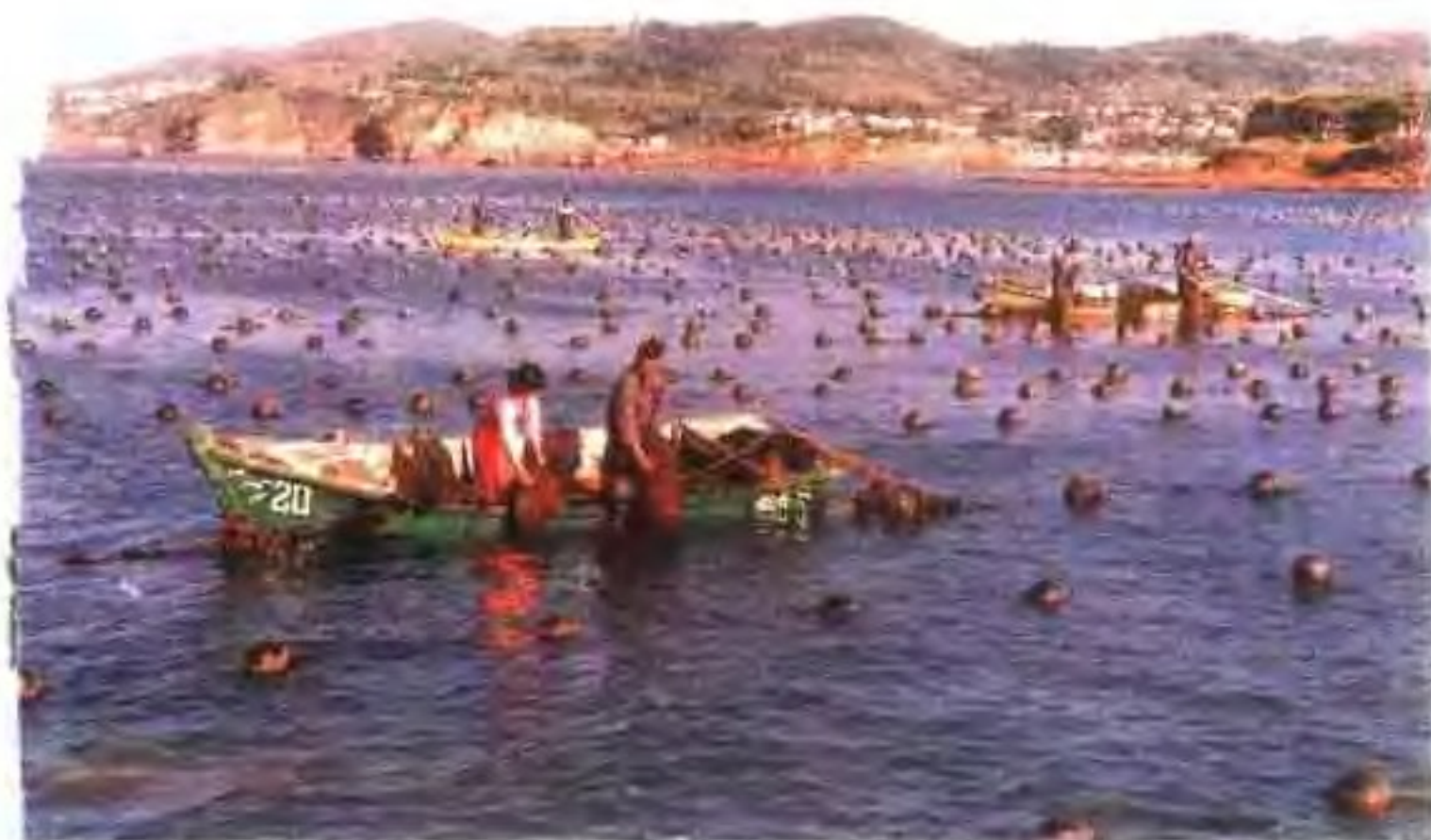
长岛贻贝人工养殖