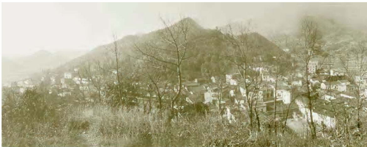
■ 图0-5 三门源

龙游三门源古村落位于浙江衢州市龙游县北石佛乡境内,距龙游县城大约20余公里。该村落三面环山,山涧溪流自北向南穿村而过。自北宋末年至南宋咸淳六年,翁姓和叶姓两大家族始迁世居于此,村落由此发展演化而成,具有一定的历史价值。因坐落在群山拱卫之中,四周拥有天然屏障,使得整个村落在历经几百年的沧桑而得以较好保存,现存有明清古建筑约60幢,其中约70%为明代建筑,还有极少量的民国建筑,省级重点文物保护单位一处——叶氏建筑群,建筑形制类型虽不多,但尚存有祠堂、楼上厅、“楼接地”、过街楼等形制。村落中占据很大比重的住宅,虽非文物,但都是记载着丰富的历史文化信息的真实物质实体,先民们利用他们的智慧将思想深深地镶嵌进村落建筑中的一砖一瓦、一草一木中,白墙黑瓦,轻巧淡雅。建筑造型朴素大方、典雅秀丽,装饰华丽精美,石雕、砖雕、木雕雕刻工艺细腻,人物造型栩栩如生,题刻、书法、彩绘技艺熟练,在建筑艺术方面具有很高的价值。特别是叶氏民居门楼上雕刻的23块地方婺剧戏曲砖雕,楼台亭阁、山水动物、