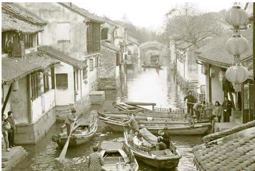
■ 图0-2 周庄

四川羌藏地区,气候全年少雨,历史上战乱不断,寨房多为石砌平顶房,开小窗,且离地高,防御性较高,房顶四角或一角常垒有一“小塔”,供奉一块卵状白色石头,祭奉白石神。整体布局依山而建,错落分布,靠山面水,山上居住,山下为良田,每个羌寨、藏寨中总有几座或几十座碉楼建筑,气势宏大。譬如:桃坪羌寨、丹巴等地。