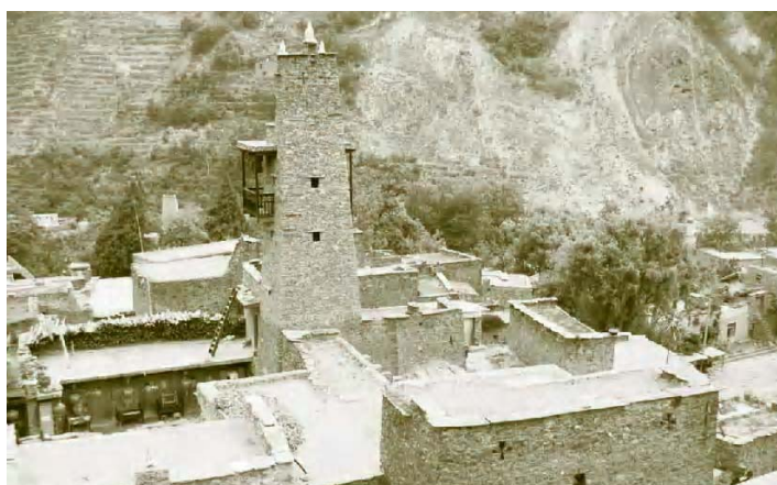
■ 图0-3 桃坪羌寨