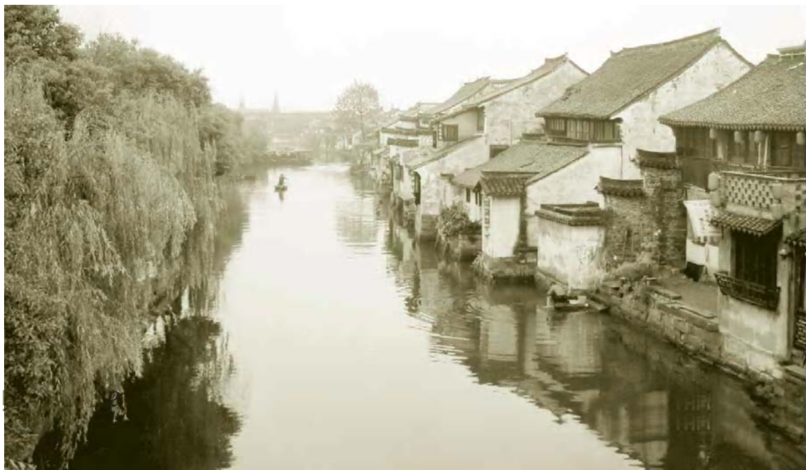
■ 图 0-1 西塘

譬如,江浙一带全年雨量充沛,水系发达,水道遍布,河道如织,四通八达,其村落多沿河道两侧布置,以带状最为见长。空间布局前街后河,人家枕河而居,临河有门,有踏级石,多桥,弯曲的小河上有着可四处穿梭的小舟。建筑多为楼房,坡屋面,巷道窄而幽深。例如:嘉善西塘、江苏周庄等地。