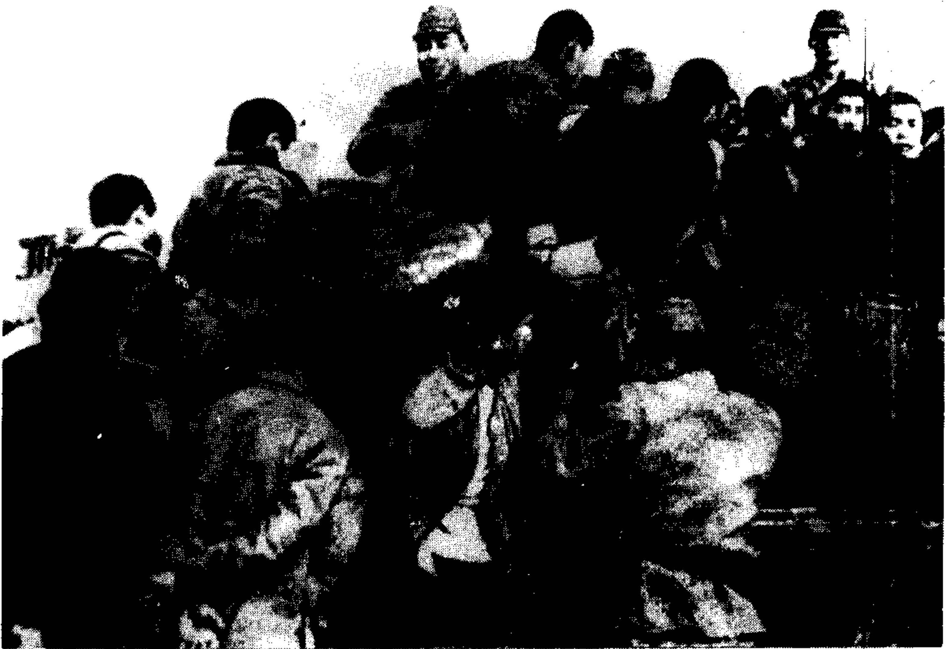
日军在南京将被捕的大批青壮年用卡车押往城外集体屠杀。