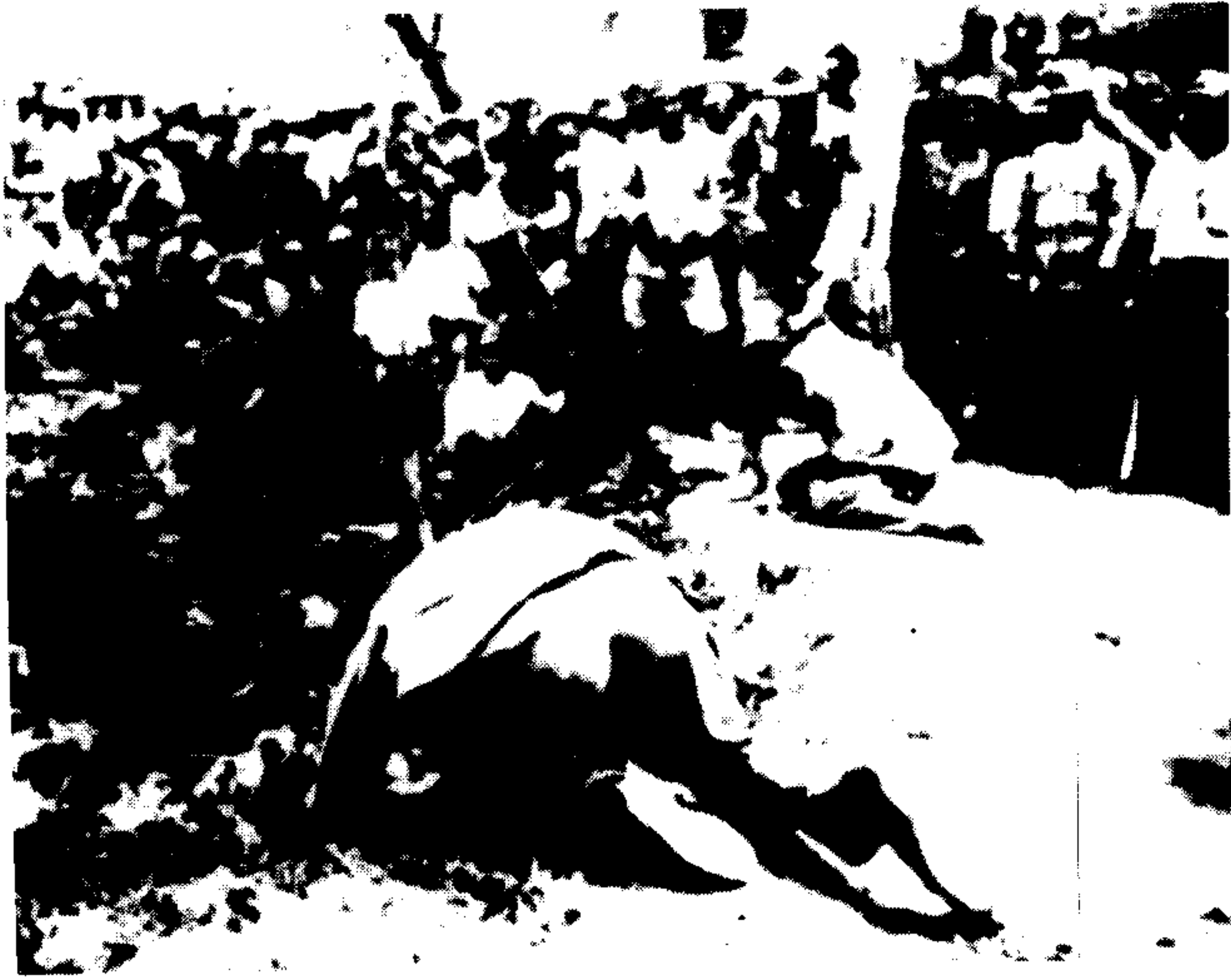
日军砍杀被俘南京军民。日军自行拍摄。此片系国民政府国防部审判战犯军事法庭存件。