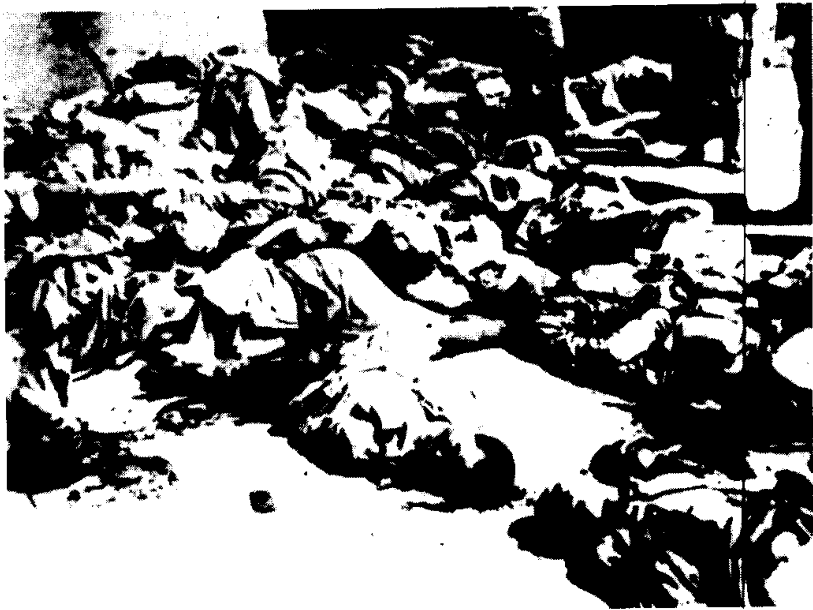
惨遭日军集体杀戳的中国人尸体。日军自行拍摄。此片系国民政府国防部审判战犯军事法庭存件。