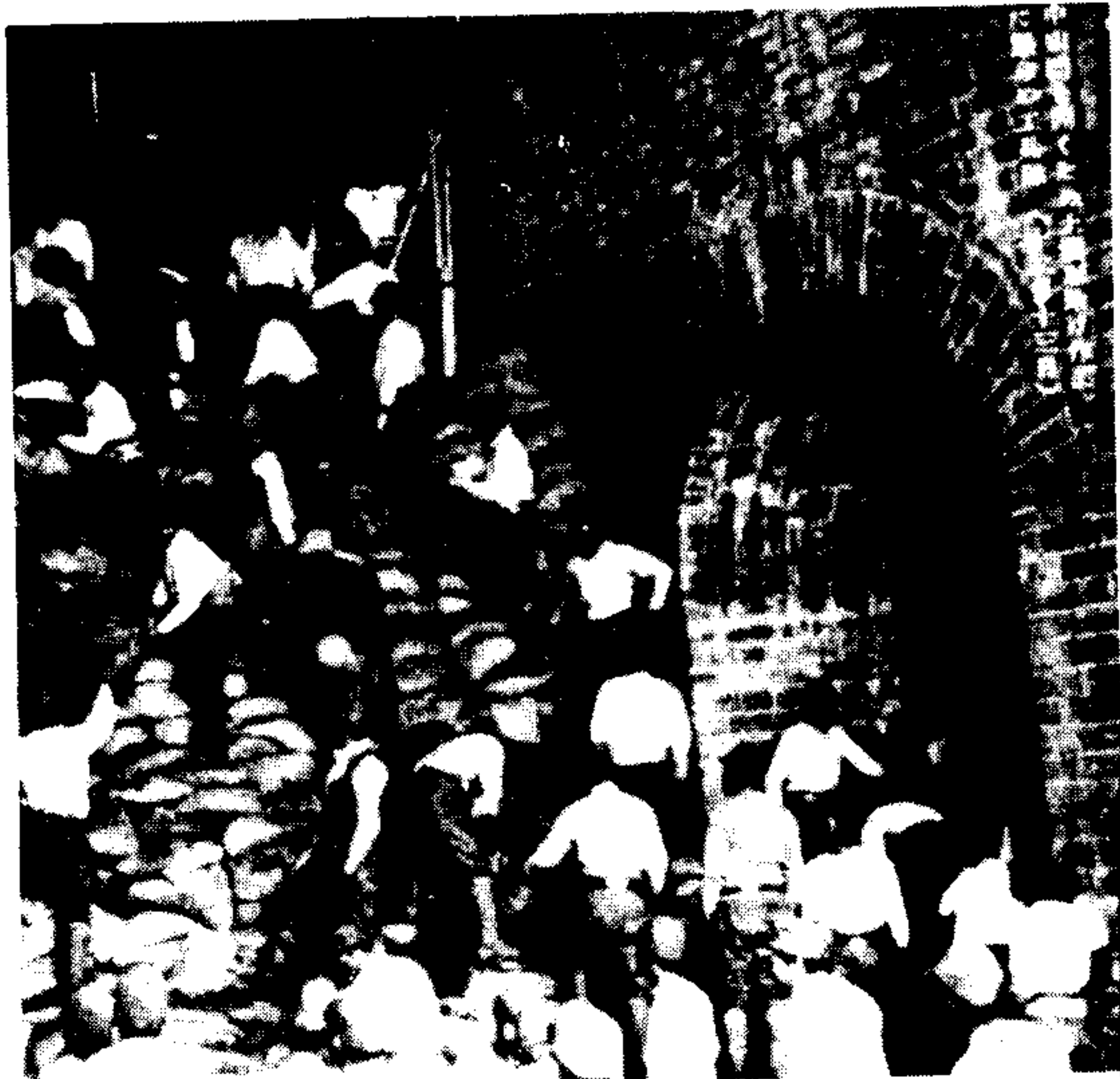
日军工兵队为打开南京中山门搬除堆在城门的土袋 (1937年12月13日)