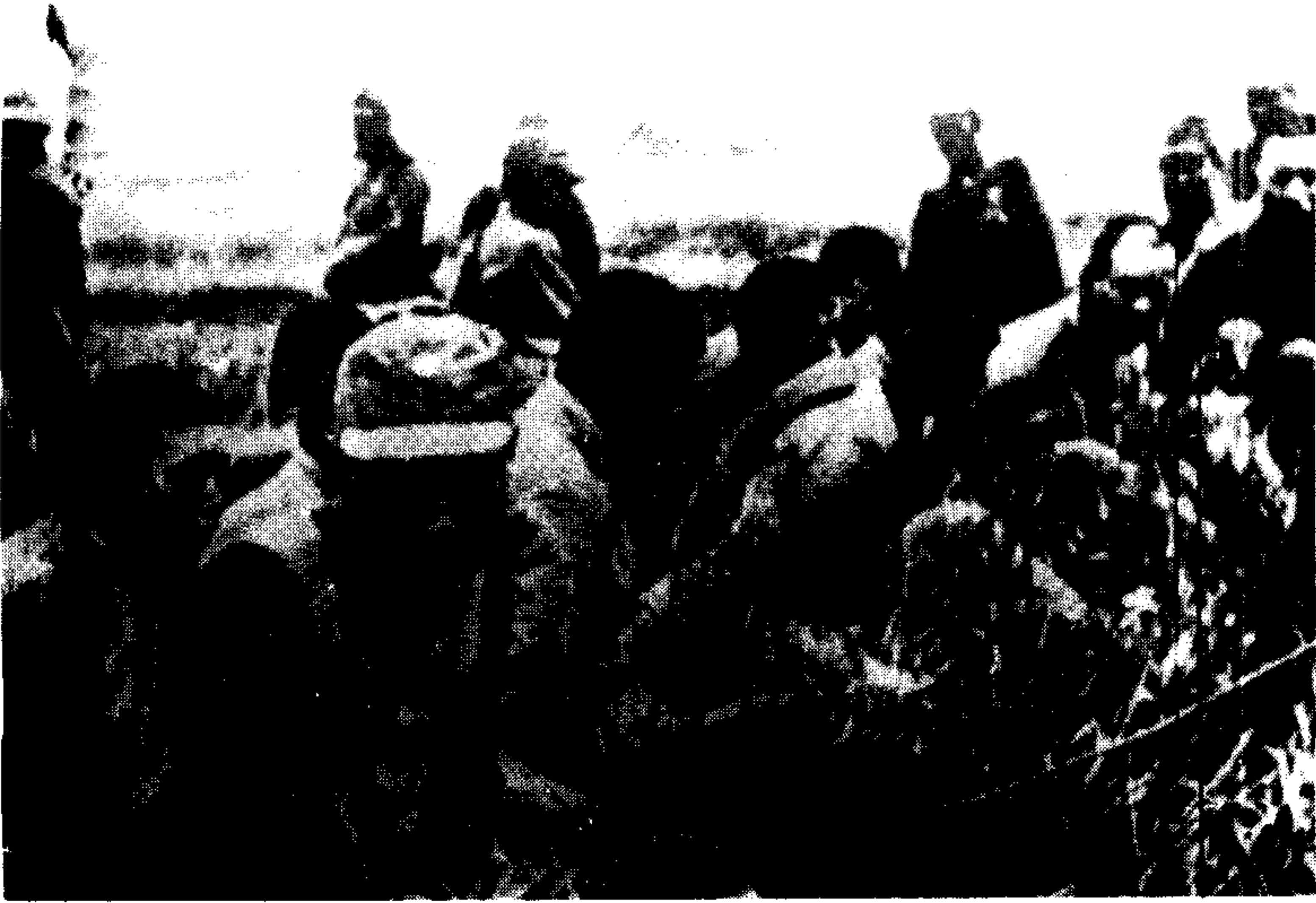
日军在南京长江江边将被捕的市民和士兵集体屠杀。