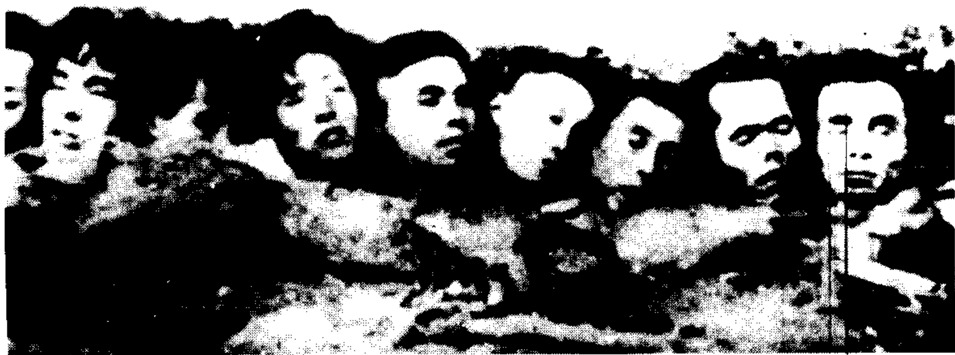
被日军集体屠杀的难胞头颅。日军自行拍摄。此片系国民政府国防部审判战犯军事法庭存件。