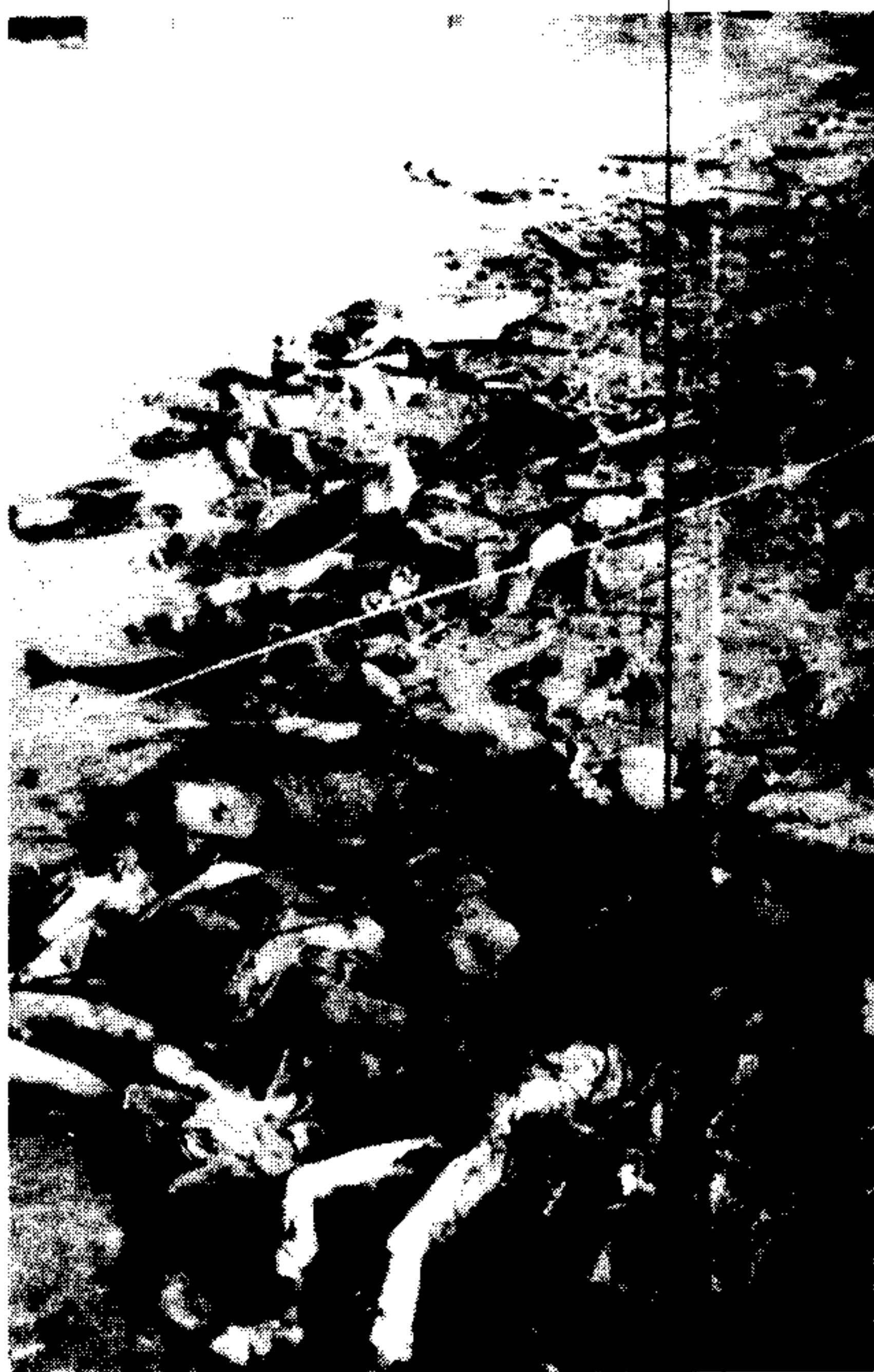
日军在南京市下关长江江边集体屠杀军民，江边的尸体事后被日军投入长江。采自日本东京青木书店《证言·南京大虐杀》1984年版。