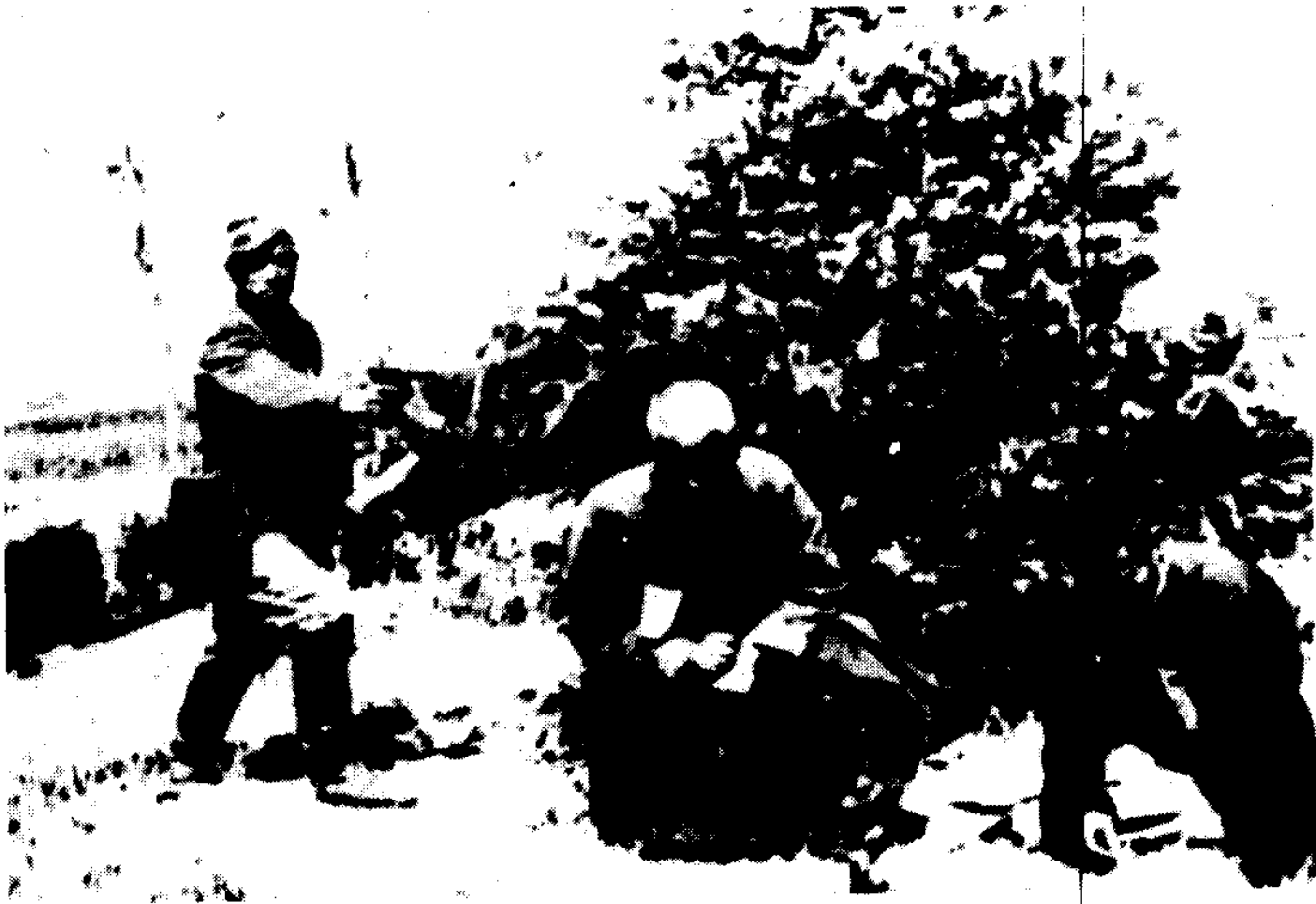
日军枪杀贫民和僧侣。日军自行拍摄。此片系国民政府国防部审判战犯军事法庭存件。