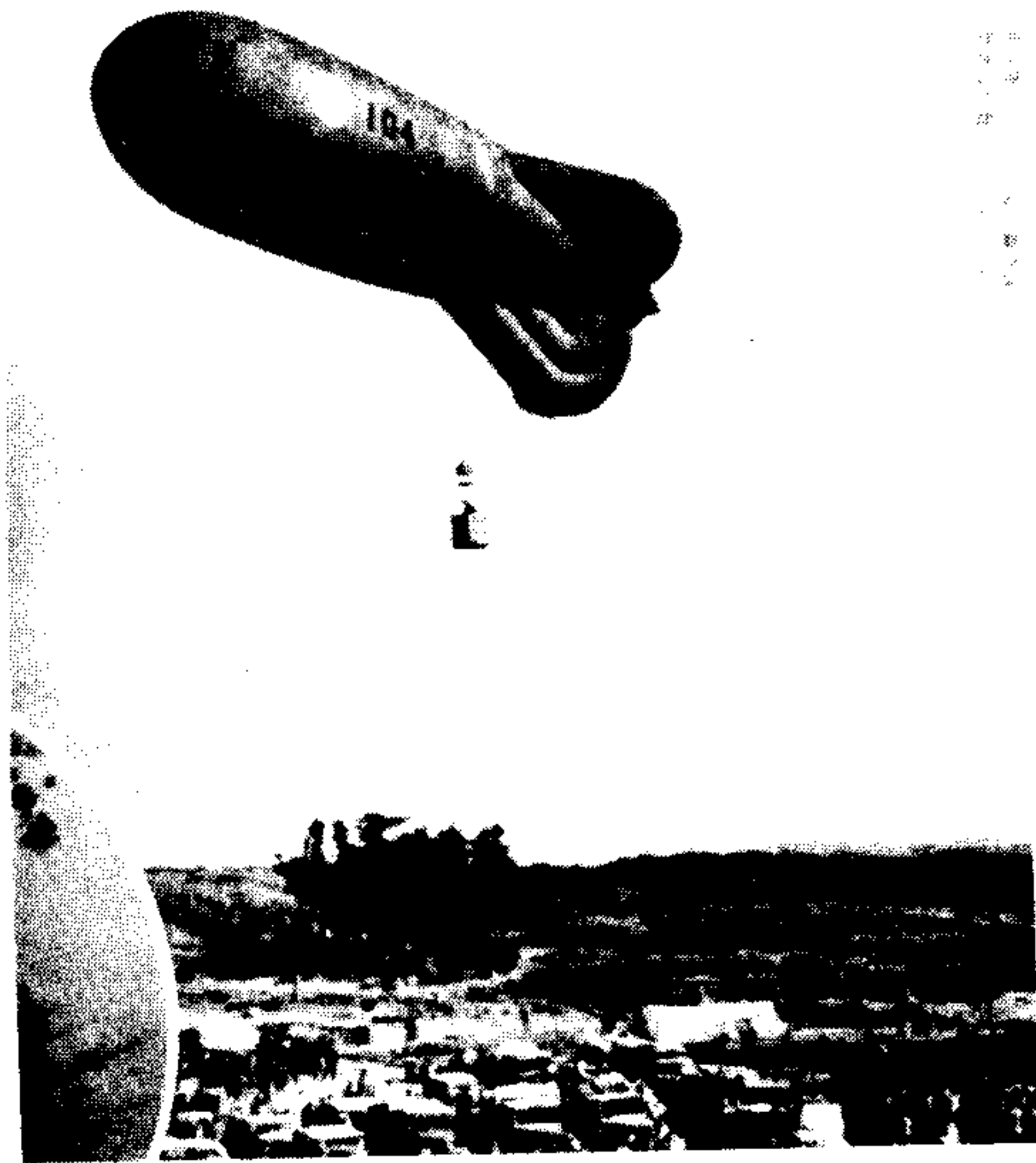
悬在南京郊外的日军观测炮击情况的气球 (1937年12月11日)