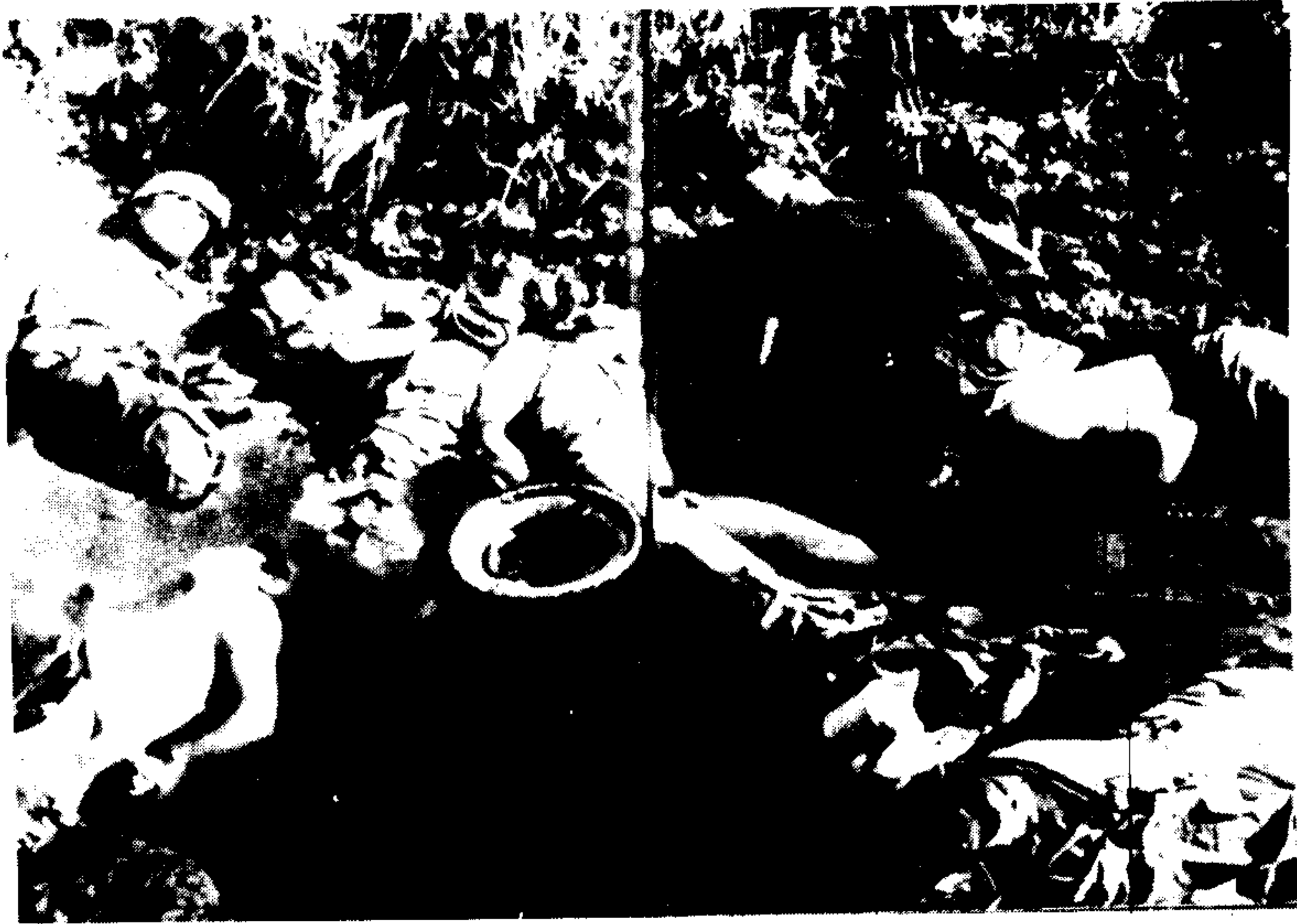
日军将市民及失去战斗力之士兵反绑双臂集体杀戳后掷入水池中，这是被杀后的血池，此血池中尸体达三百余具。