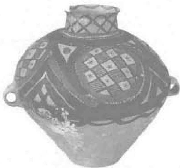
双耳漩涡纹彩陶罐 (马家窑文化半山类型)