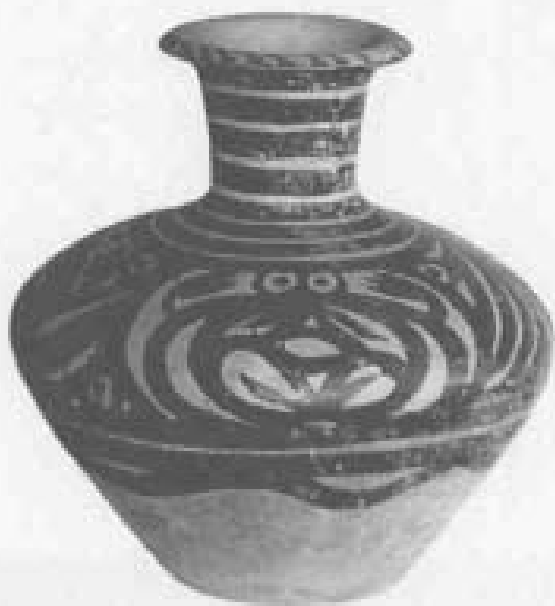
彩陶蛙纹瓶(马家窑文化,漳县出土)

马家窑文化的陶器造型独特而精美,花纹图案绚丽多姿,多以简洁明快的色彩,灵动流畅的笔触,柔美多变的线条绘画于橙红色的陶器之上,其图案类型,有反映农业和植物采集的草叶纹、花卉纹、禾穗纹、豆瓣纹;有反映渔猎的网格纹;有反映多子生育观念的葫芦纹、鱼纹;有反映大自然的流水漩涡纹、水波纹、起伏山川纹;有反映社会活动的人形踏歌舞蹈纹;有代表文字雏形的“田”字纹、“十”字纹、“米”字纹等。1974年,出土于陇西县吕家坪的一件马家窑文化尖底彩陶瓶,瓶身外壁