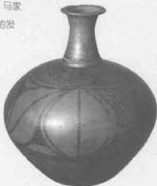
马家窑文化时期的风纹彩陶瓶 (1975年出土于通渭县温家坪)

马家窑文化以其光彩夺目的彩陶器而著称于世。当时人类的生产技术和生活经验较前有了很大的发展,作为主要生产工具的石器,根据各种不同用途而制造,因而更为适用,如石斧、石铲、石刀、石锤、石杵、石镰。而随着种植业、饲养业的发展和生活的相对稳定,人们的审美心理也与时俱进,创造了马家窑文化的先民们制作的陶器不但比以前更多、更精美,而且以他们无比智慧的艺术才华将史前彩陶文化推到了一个巅峰,从而使马家窑文化在新石器的彩陶发展史上具有了里程碑式的意义。