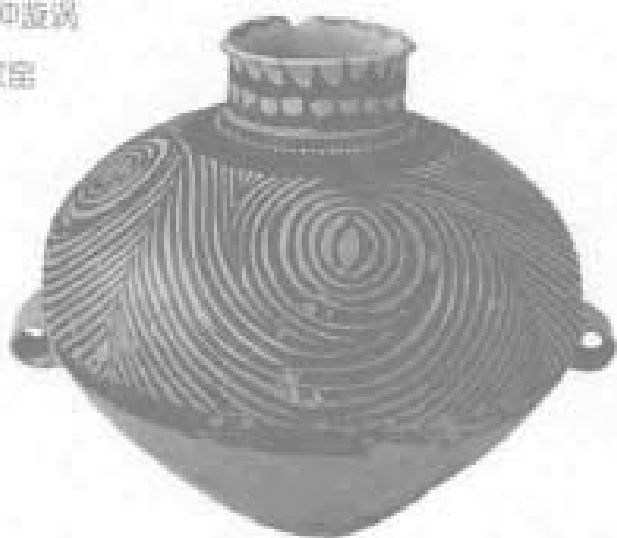
双耳漩涡纹彩陶罐 (马家窑文化半山类型)