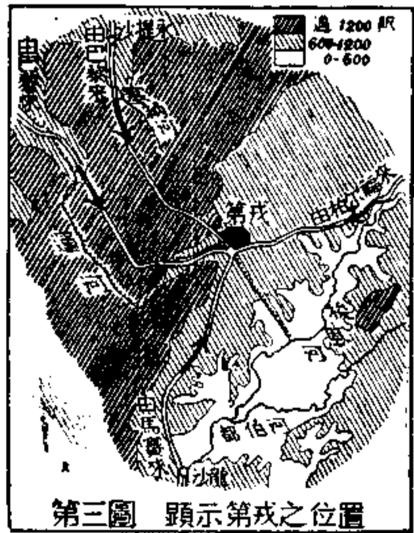
第三圖 顯示第戎之位置

假如我們不從地中海進入法蘭西，而出發地點，乃是西班牙。那末，橫阻於前的，是 庇里尼斯那條長的山 ——一條新近摺皺的大山脈。山脈中，道路