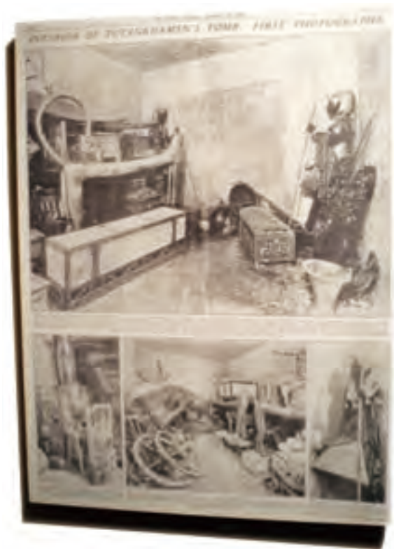
这是当年发掘现场的一组照片，真实地反映了当时的场景

经过仔细审视墙壁之后，他们在两尊塑像之间的墙上发现了第三个封闭的门。人们已经迫不及待地想立刻打开看一看，但卡特突然清醒过来，他意识到必须先把这些东西清理之后，才能进行下一步的工作。因为现已发现的这些文物绝不能立即运走，因为许多文物是极容易损坏的，在迁出之前必须进行保护性处理，再加上烦琐的编目、清理、检测等一系列常规的工作，使得这一切变成极为繁重的