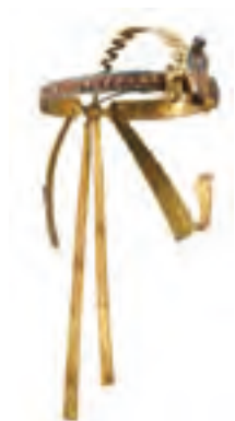
图坦卡蒙的王冠包围着他的木乃伊头部，象征着他的权威