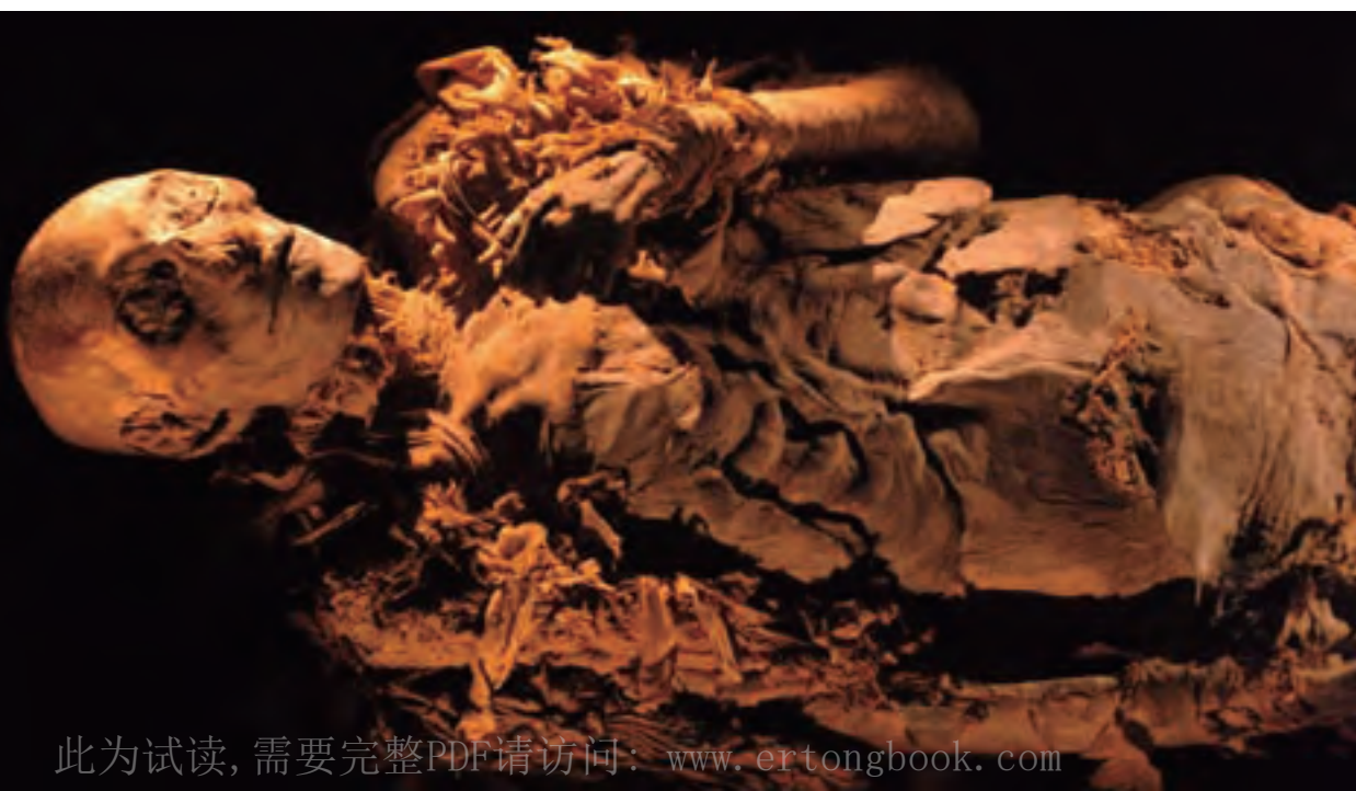
这就是卡特在帝王谷发现的图坦卡蒙的木乃伊

自图坦卡蒙陵墓被发现以来，有关图坦卡蒙的身世之谜、死因之谜便成为学术界一直争论不休的问题。