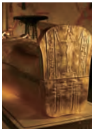
图坦卡蒙的金制棺材

1925年11月11日上午，解剖学家亚齐伯特·德利教授剪开了干尸的裹尸布。随着一层层黑布被剥下，人们发现尸体还未曾完全腐烂，最后展现出来的是年轻国王的面孔，用卡特的话说，那是“沉静而安详的面孔，一个青年的面孔”。