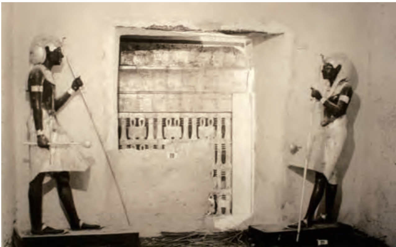
两座雕像象征性地“保护”着密封墙里的法老棺椁