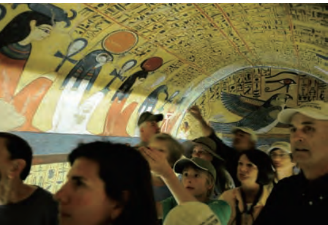
图坦卡蒙墓室墙壁的纯金浮雕让游人叹为观止

起……从神龛的第二层起就封得好好的，可以肯定没有人曾经打开过，也就是说他们将看到的是 3000 年来一直原封未动的国王的木乃伊。