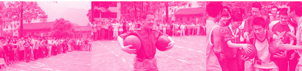
2008年5月11日，北川中学高三趣味篮球赛