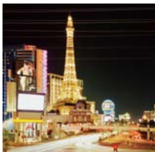
拉斯维加的夜，是美国大都市文化的又一个象征。

美国是神奇的，深刻的，任再伟大的探险者，穷其一生也无法探究这其中蕴含的万千气象。但我们还是力图把它看得更加清楚一点，认识得更加透彻一点。本书选取了美国最具代表性的事件与景观，用文字和图片带你瞬间体验时间与空间上的游历，从历史、地理、人文风情和自然风光等角度全方位的为您展现了一个客观化的美国。读完之后你会发现，那个最真实的美国，实际上就装在你的心里。