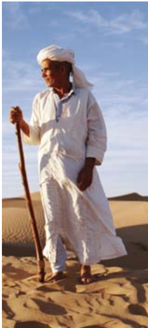
✿ 贝多因人是撒哈拉沙漠中生活的古老的游牧民族。