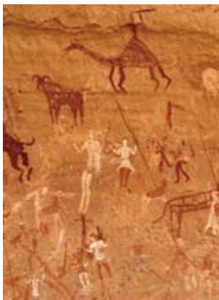
✿ 沙漠中古老的壁画，显示着这里曾是一片水草丰美的人类家园。

亮，如果你抓起一把，就会发现这里的沙子比你想象的要细得多，而且感觉就像太白粉一样柔软。当你把手伸到沙堆里，就会不自觉地惊叫起来，因为沙子并不像你想象的那样炙热。