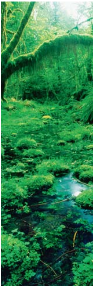
神秘幽暗的雨林，是斑斓大陆的又一种色调。