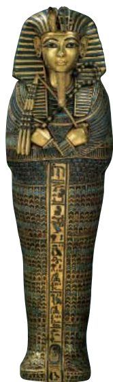
图坦卡蒙陵墓中的黄金面具是墓葬品中最著名的一件。

的大街小巷遍布着大大小小各种咖啡馆和路边咖啡摊。在简易的木炭炉上放一壶水，咖啡摊的老板会端着盘子将咖啡杯递到你手里，同时给你一个甜美的微笑。在苏丹喝咖啡要有耐心，不然你就无法品出苏丹咖啡的味道，也就很难熟悉苏丹人的生活习俗，无法了解苏丹人的内心世界与情怀。