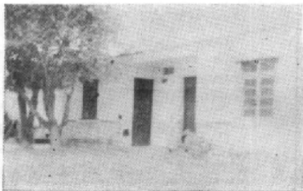
图为黎族人民领袖王国兴故居（琼中县红毛镇番响村）