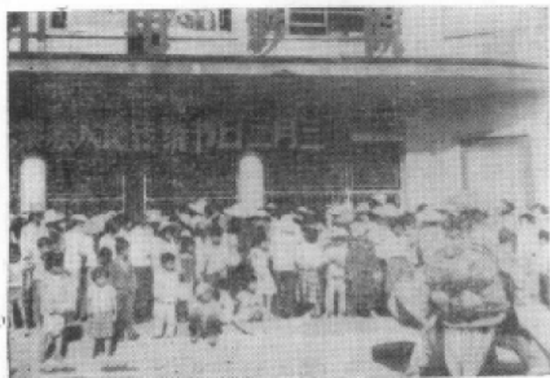
图为琼中县营根地区各族人民纪念黎族传统节日“三月 三”