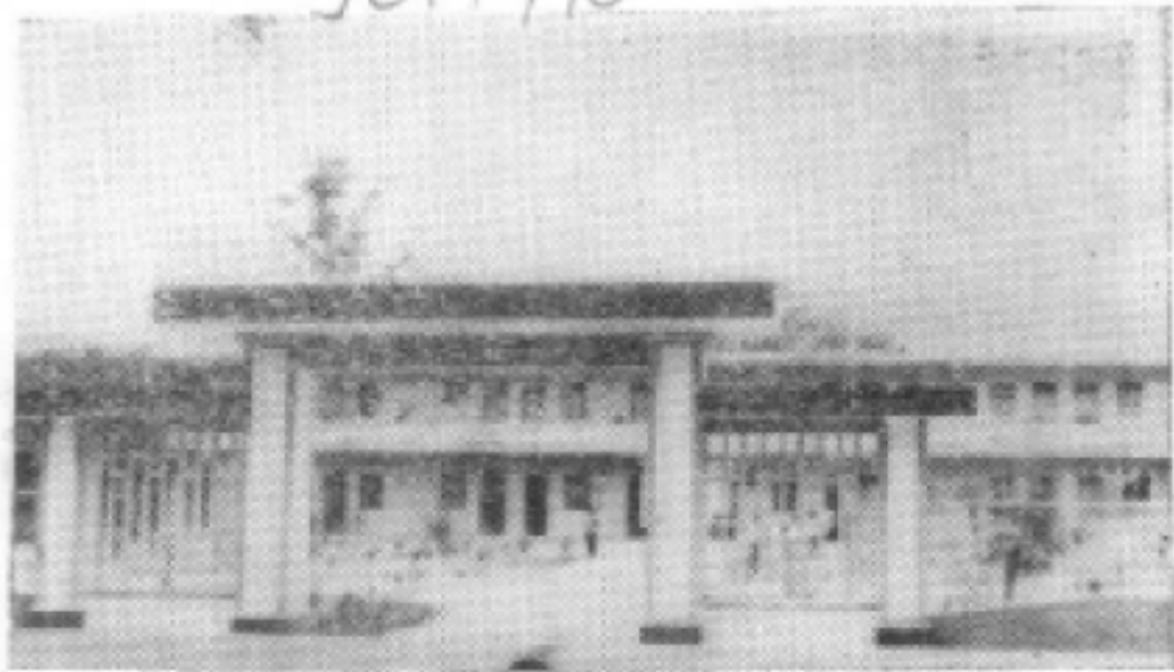
上图为解放后建设的琼中县毛阳镇卫生院