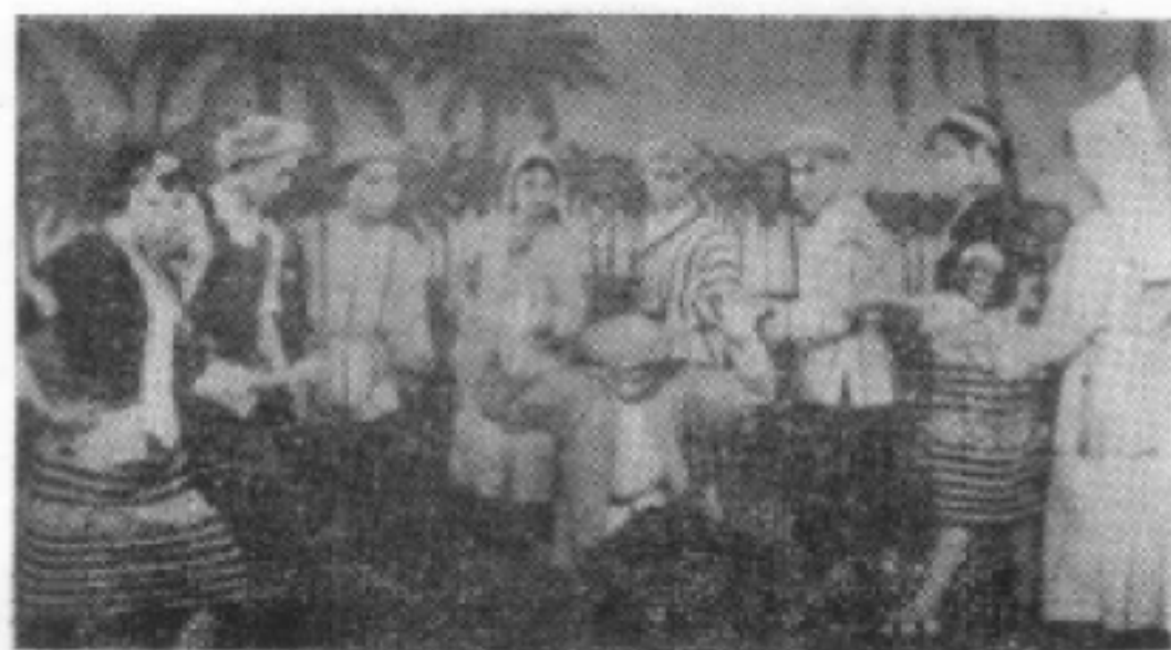
△《五指山抓飞贼》海南岛黎族表演唱