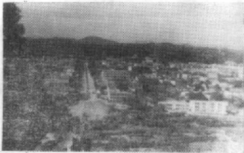
下图为琼中县县城（营根镇）一角