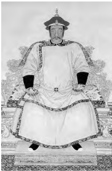
太祖努尔哈赤 1559 - 1626