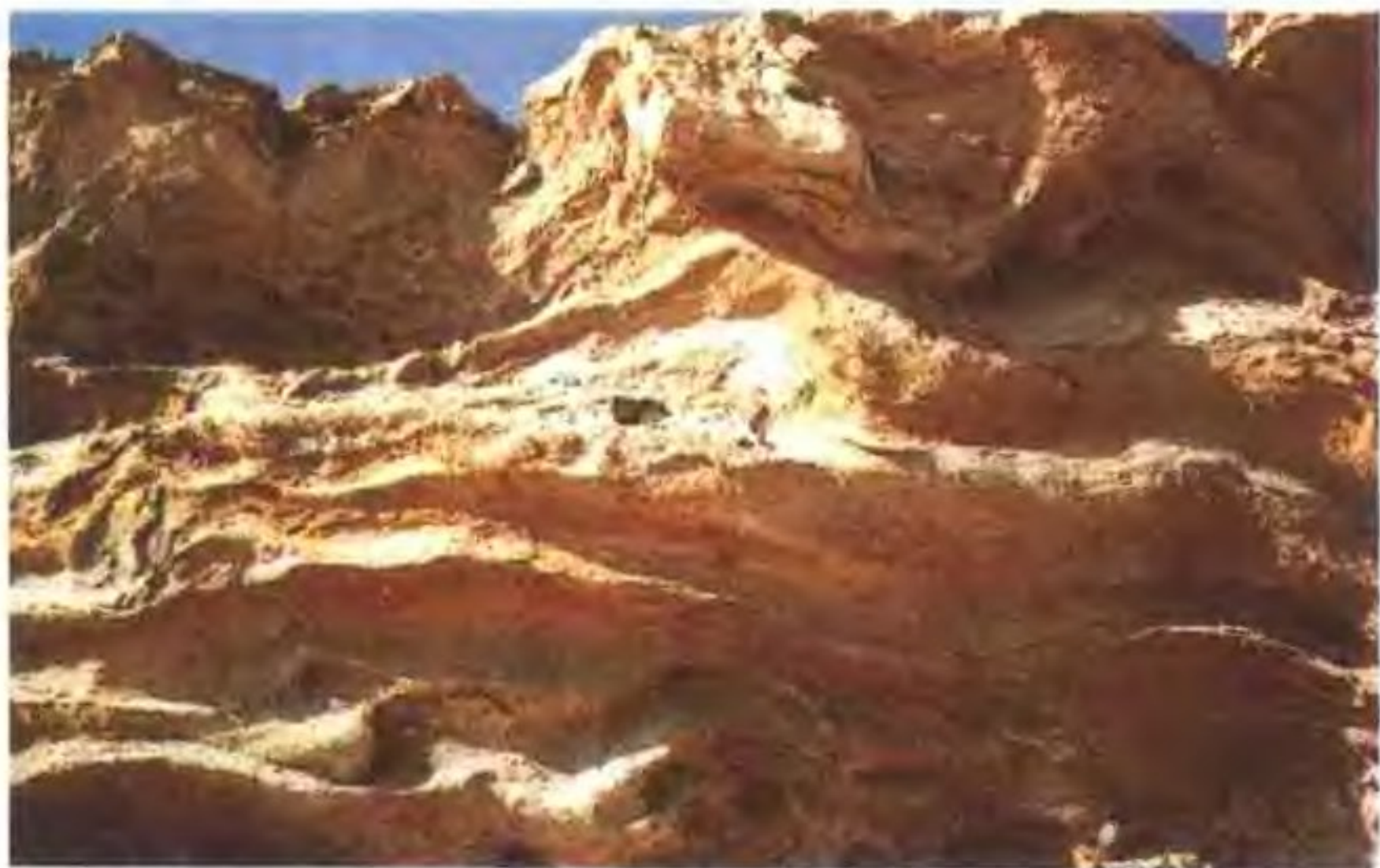
二百万年前的河底沉积