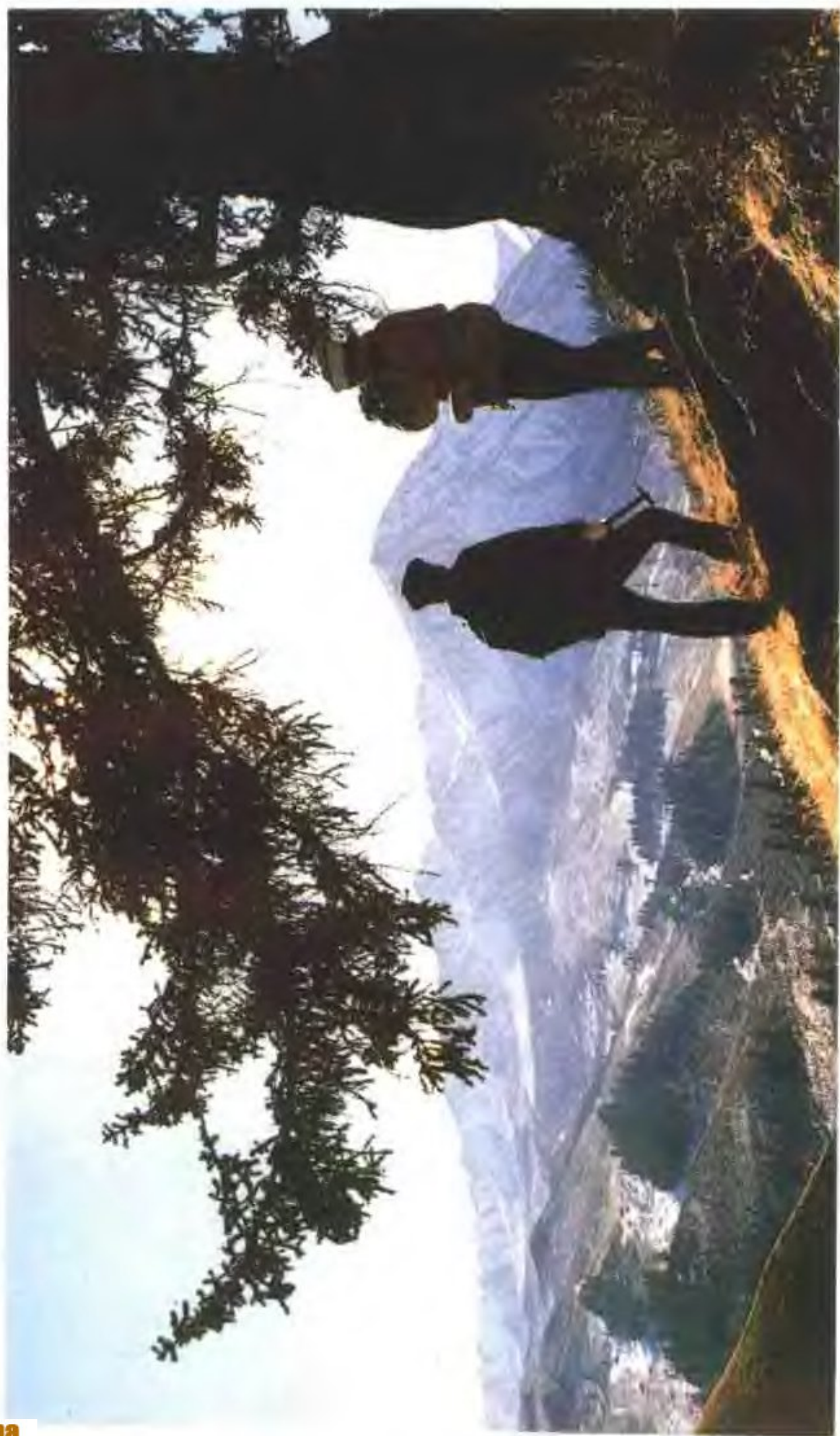
勘探队员在祁连山