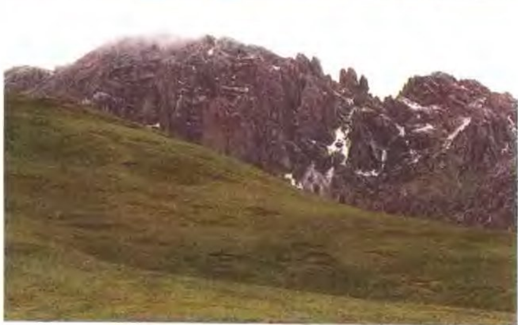
昆仑山的雨蚀地貌