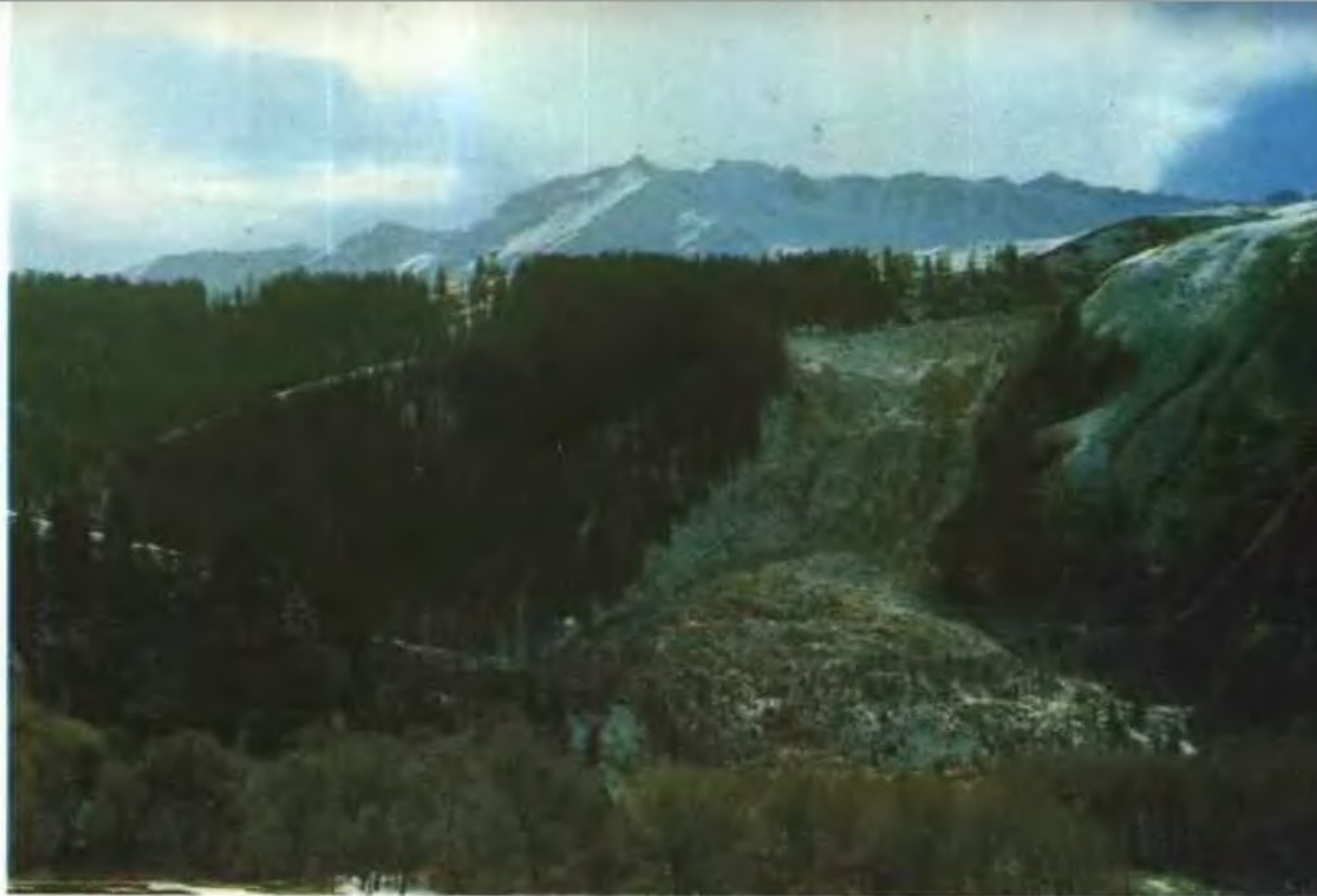
祁连山的泥石流