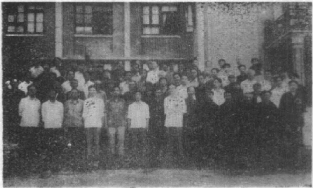
青川县首届文史工作会议与会全体人员合影