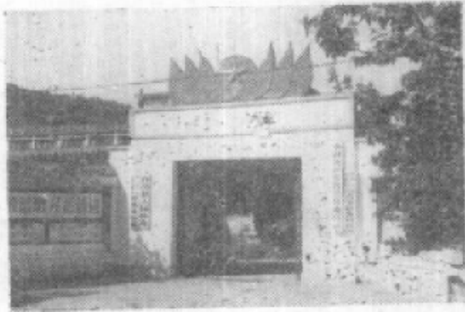
中共青川县委会大门