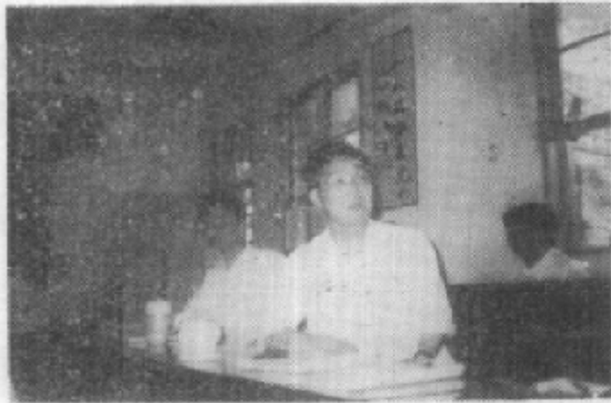
中共青川县委书记付兴培同志于一九八四年七月三日在首届文史工作会议上讲话