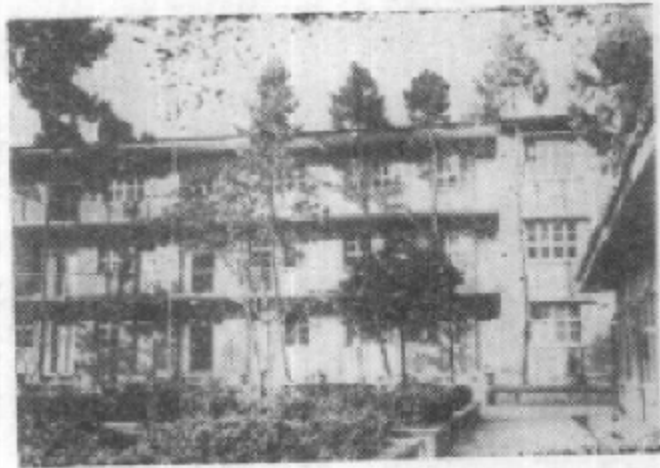
青川县政协办公楼