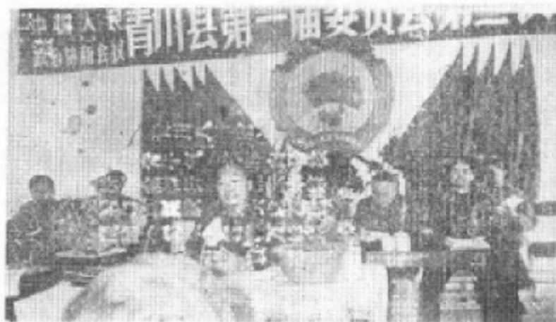
一九八六年五月三日政协青川县第一届第三次会议在政协三楼礼堂隆重召开。