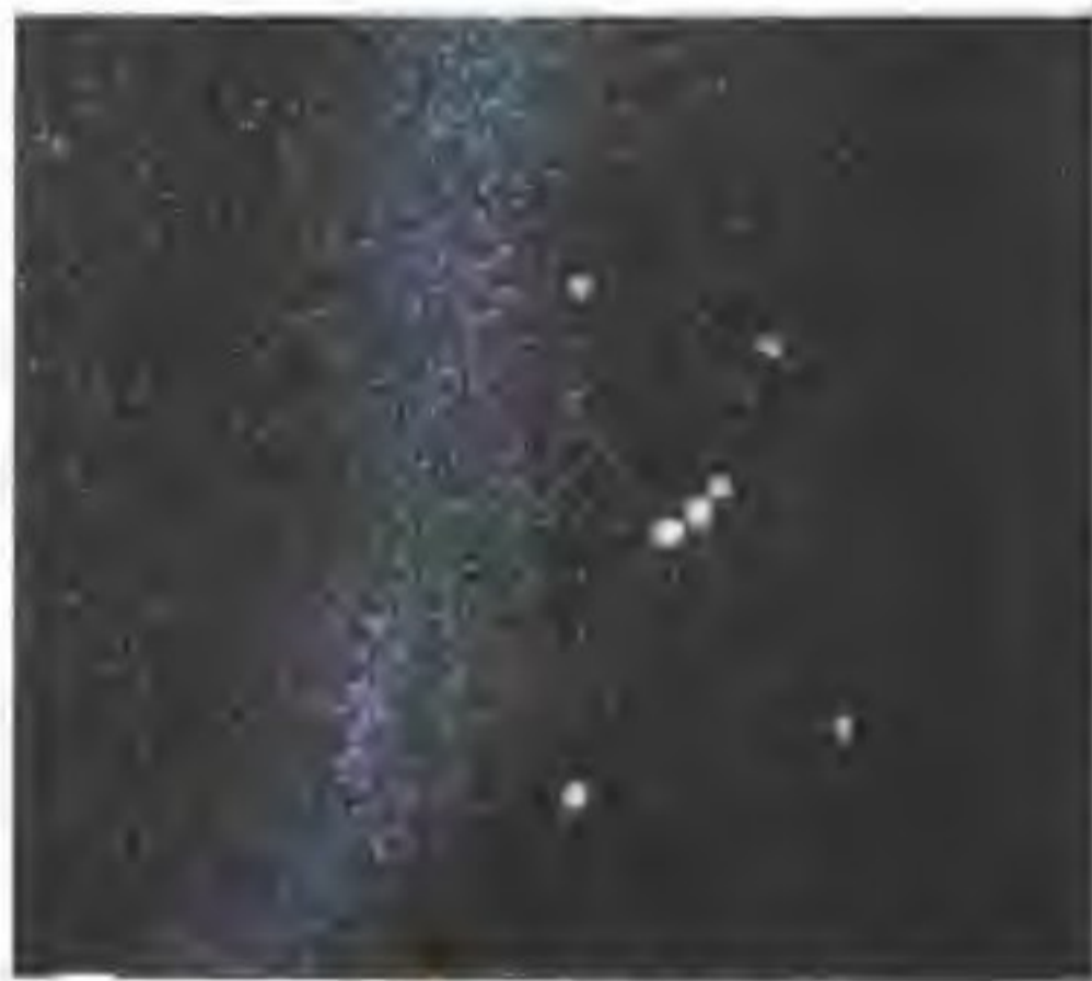
🔥 银河旁的猎户星座

除了建筑上的成就，金字塔所表现出来的建造者的天文学知识更令人拍手叫绝。大金字塔的轴线刚好呈东西和南北走向，与罗盘上的南北两极相一致，其精确度就连现在的建设者们都自愧不如。金字塔完全是按猎户座的三颗星星的位置排列的，它是夜空在沙漠里的真实反映。在3月21日和9月21日两天，这些金字塔会沿着轴线形成一条巨大的阴影带，使其成为一个奇异的“永久时钟”，人们可以通过它来进行时间确定。