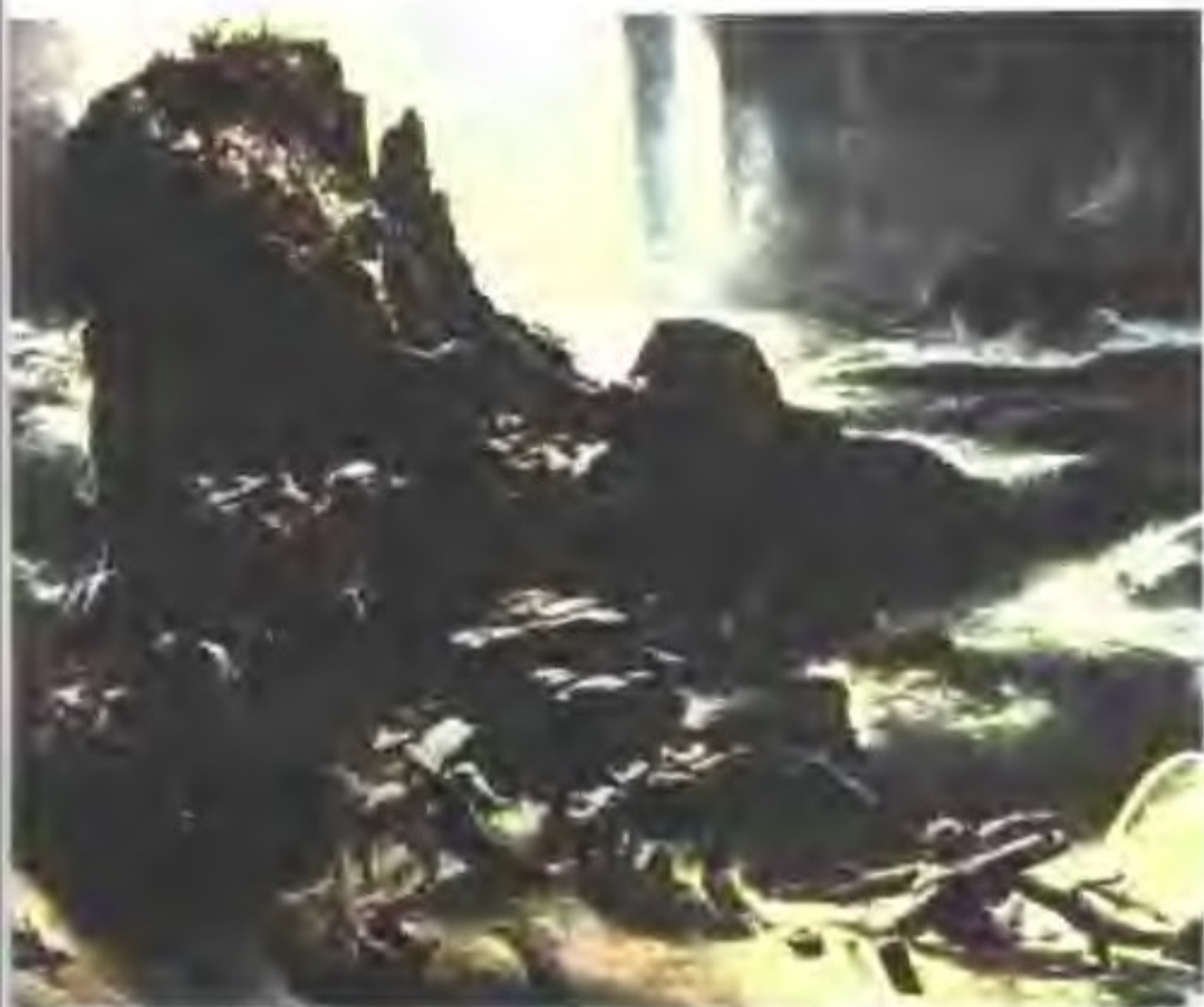
洪水淹没亚特兰蒂斯王国