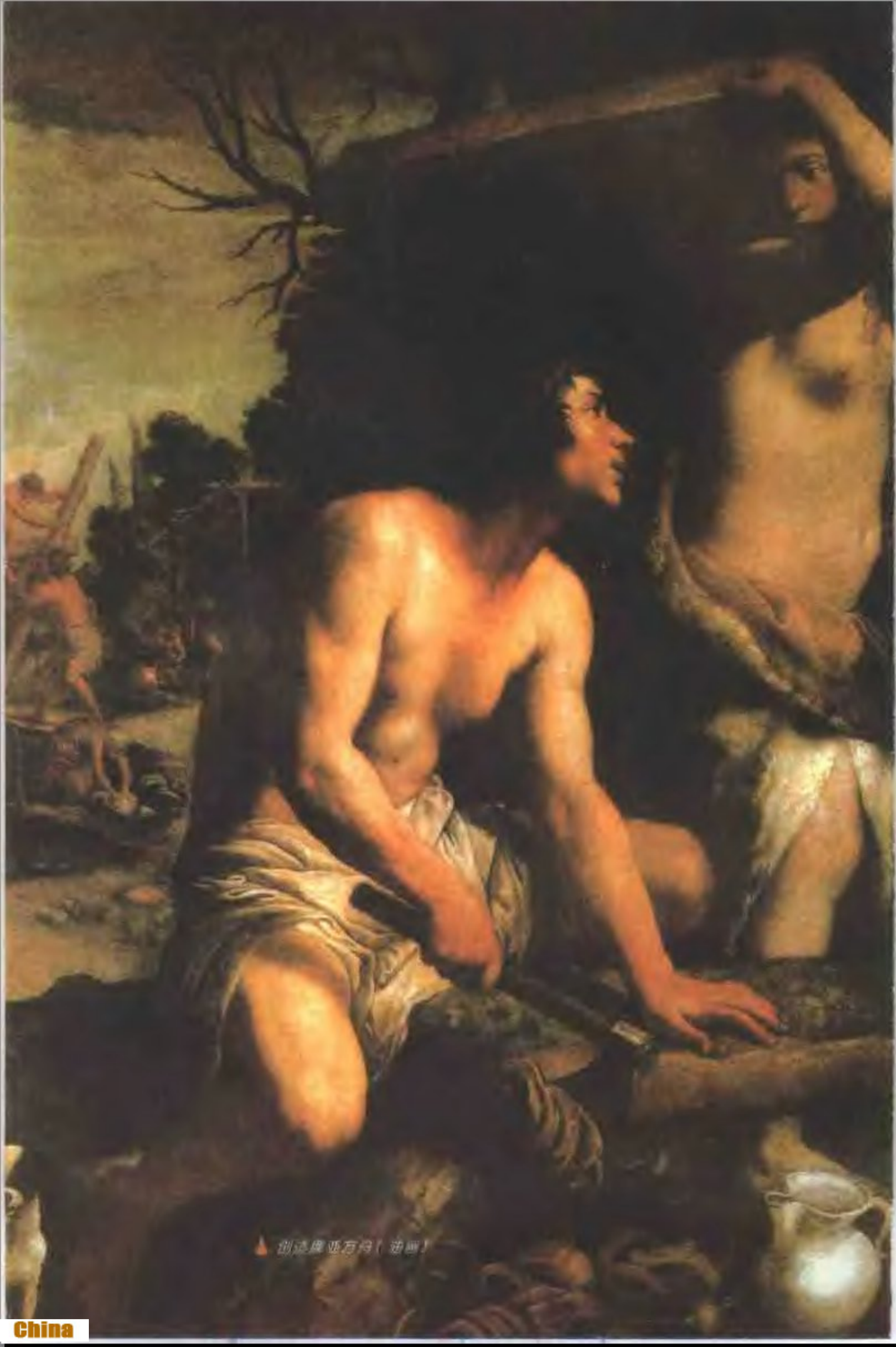
▲ 创透庞贝万均（油画）