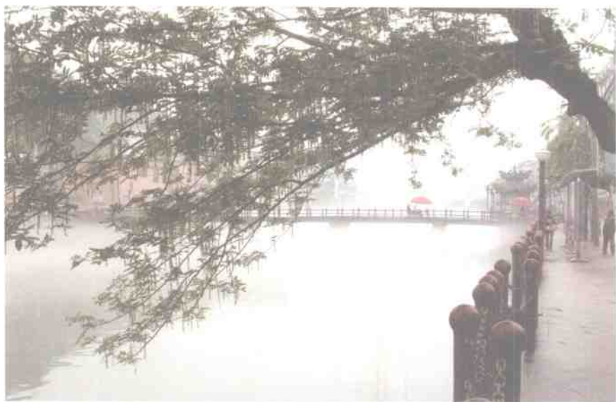
南溪风光