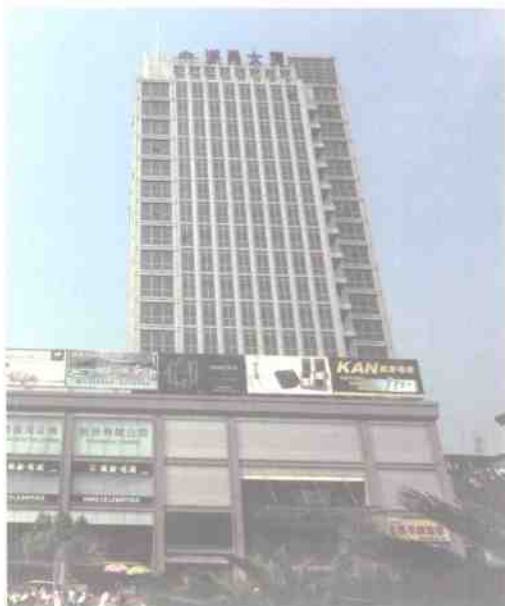
县城北街口上新建的遂昌大厦

最近的这一次，则是应中共遂昌县委宣传部的邀请而去，旨在开掘遂昌的人文风物底蕴，首推亮点自然还是汤显祖。历史上在遂昌做过县太爷的人不少，遂昌老百姓独独记住了一个老汤。除其当年政绩外，了不得的戏文《牡丹亭》恐怕更有说道，所以在遂昌，《牡丹亭》的影响远远超出戏曲本身，遂昌人骄傲地把家乡称为《牡丹亭》的原产地，“临川四梦”中的一梦，成了本土文化。不管别人怎么看待，我以为倘若玉茗先生在世，怕是不会反对的，既然曾在“仙县”