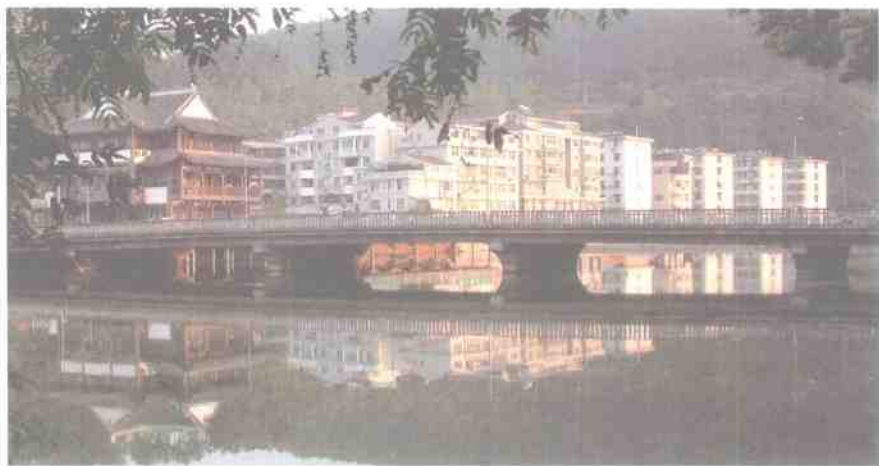
叶坦桥头

为“仙令”，又把自己在此地做过的事，如下乡劝农之类，写进了戏里，遂昌这个地方在汤显祖看来，用句现在时髦的话说，也就是第二故乡了。