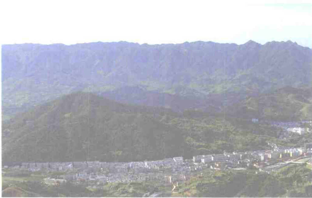
遂昌县城鸟瞰