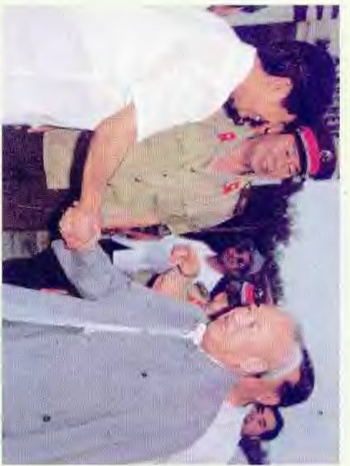
1988年8月中顾委常委余秋里视察盘锦