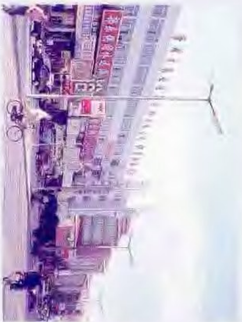
盘锦市农业生产资料公司