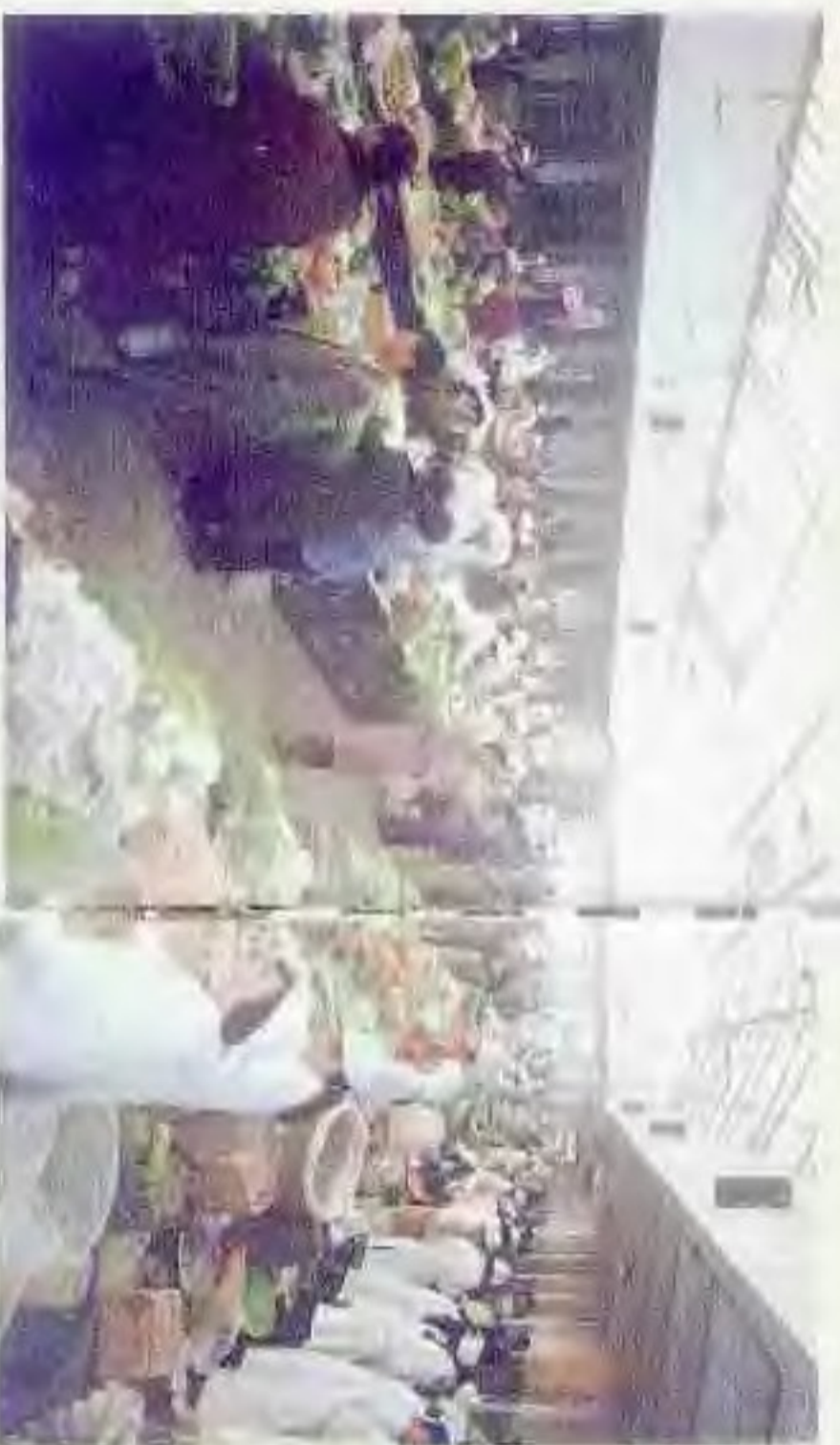
东风集贸市场大厅