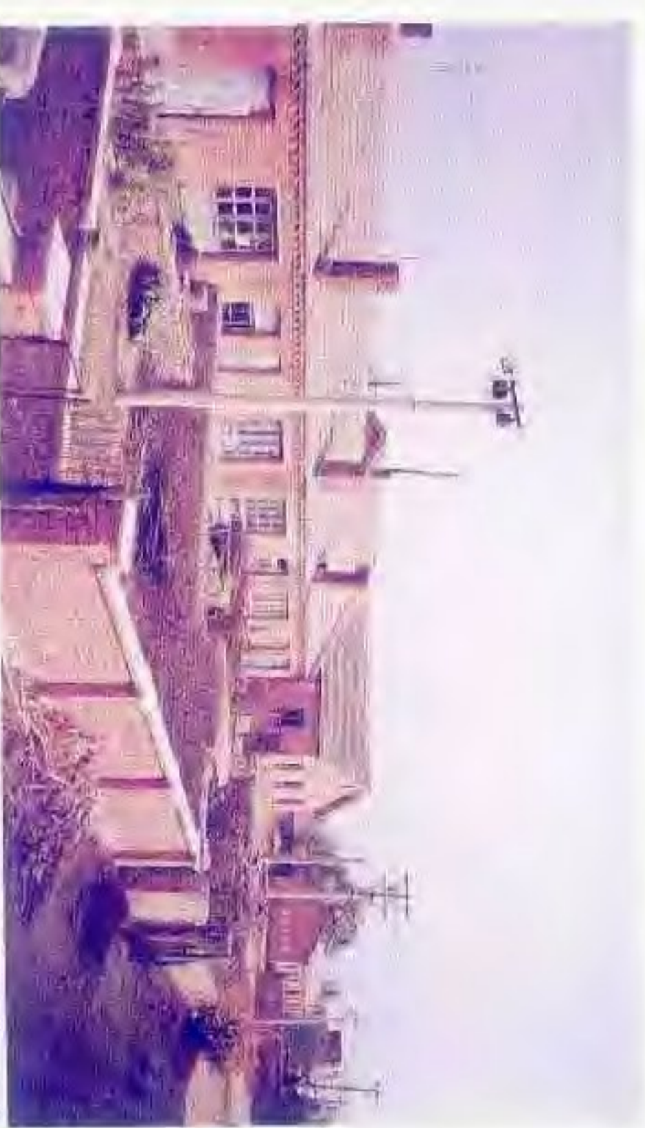
文革时期国家商业部“五七干校”旧址(今盘山县大荒乡后鸭子厂村),姚依林时任部长,曾在干校劳动