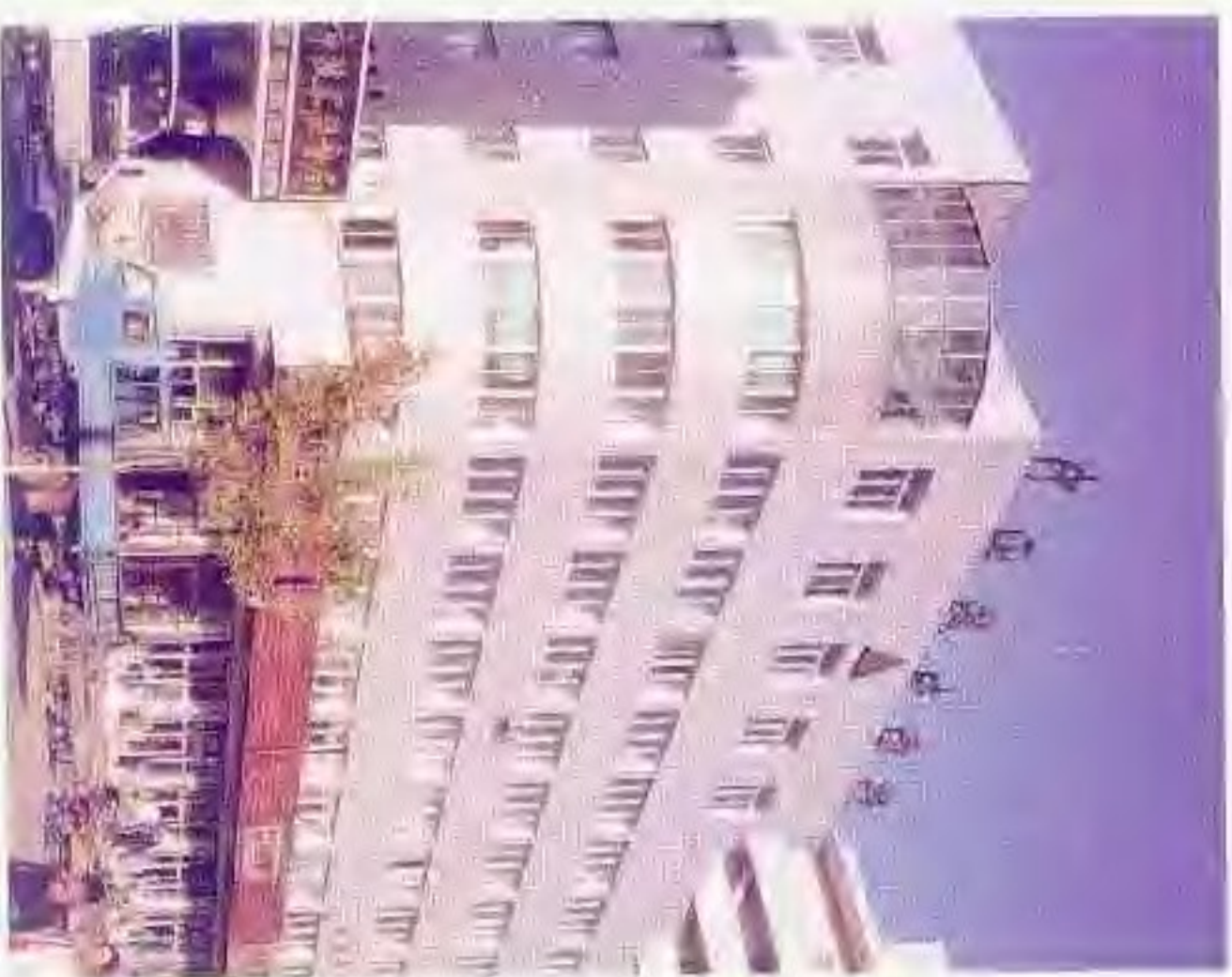
盘锦市技术监督局