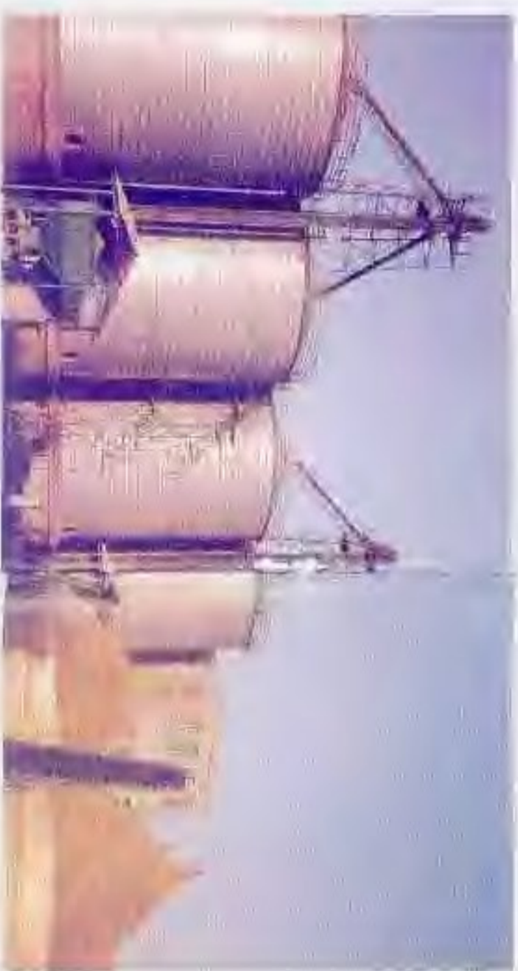
80年代建成物铁皮仓库