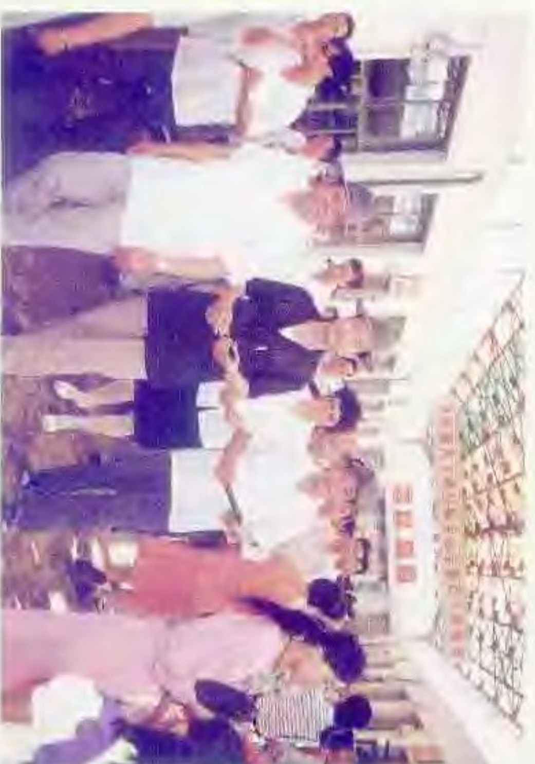
建市初期的第三产业发展与交流