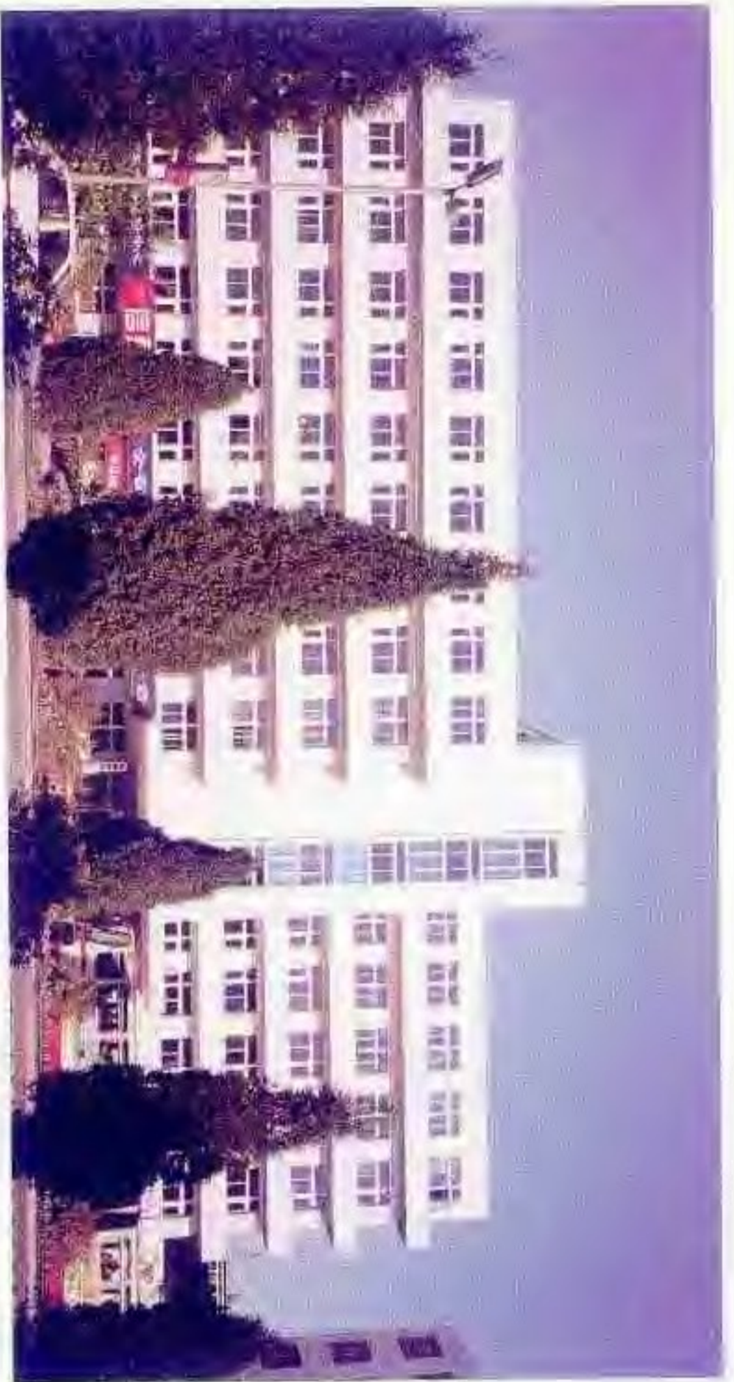
盘锦市计划经济委员会