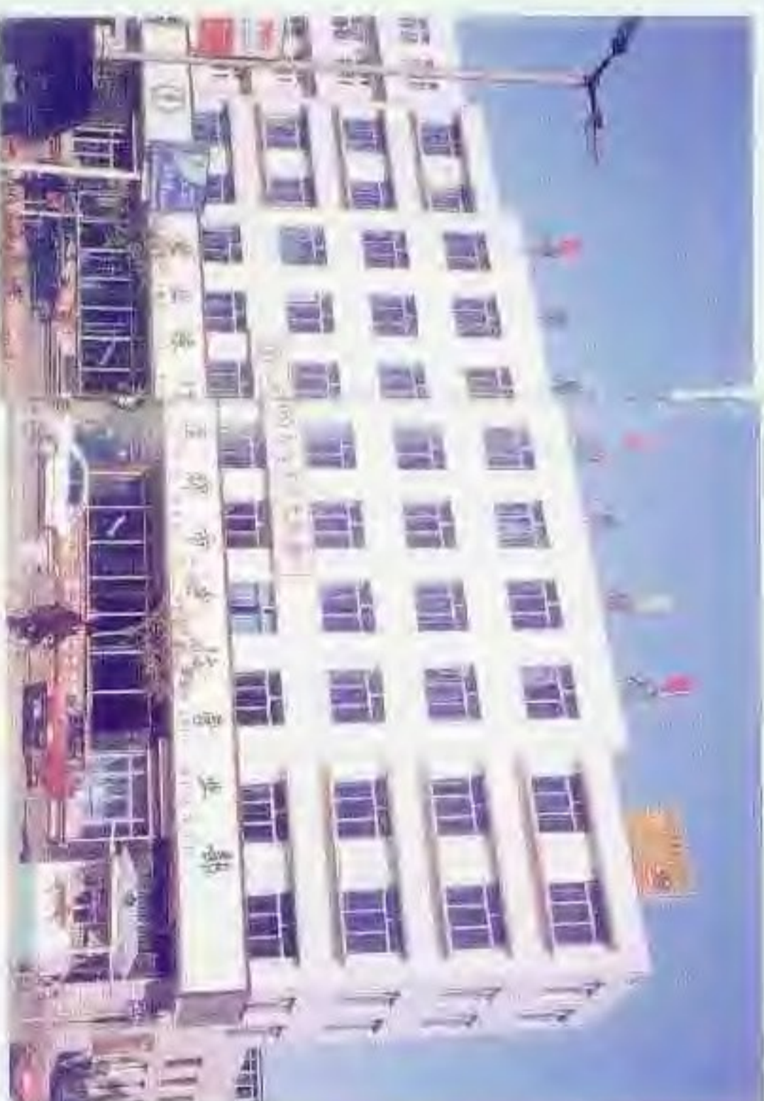
中国农业银行盘锦市分行营业部