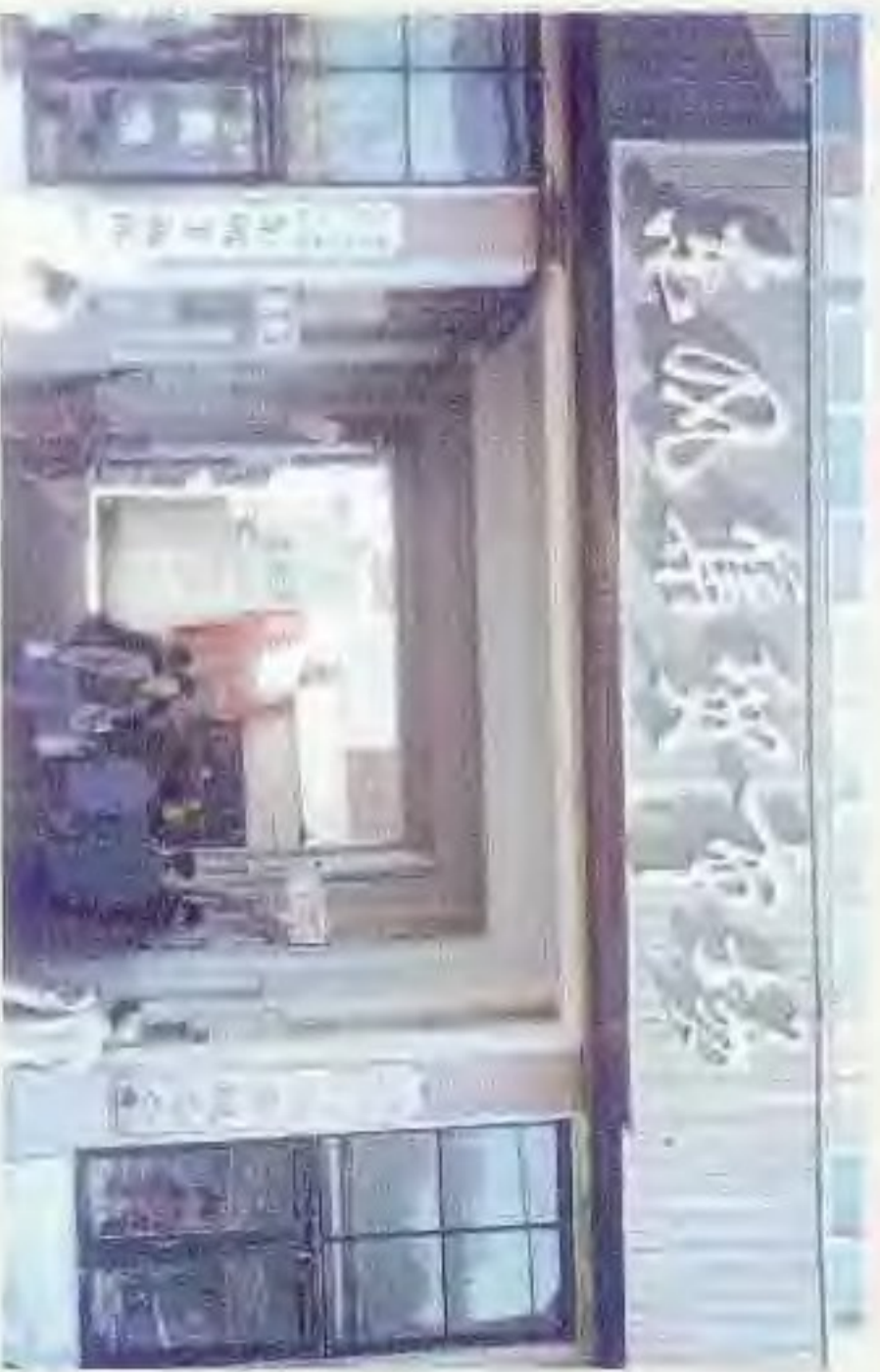
双台子东风集贸市场