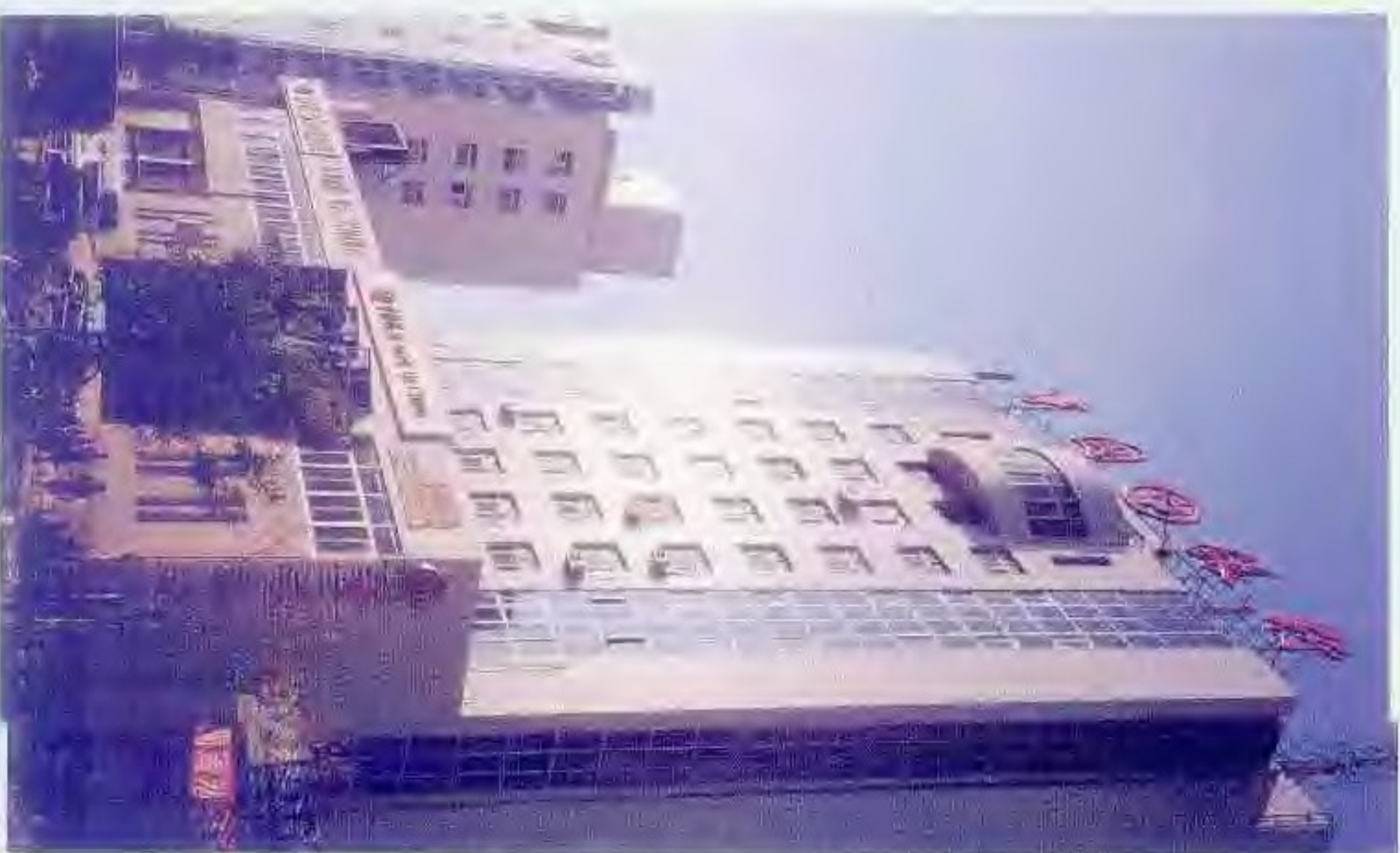
中国银行盘锦市支行