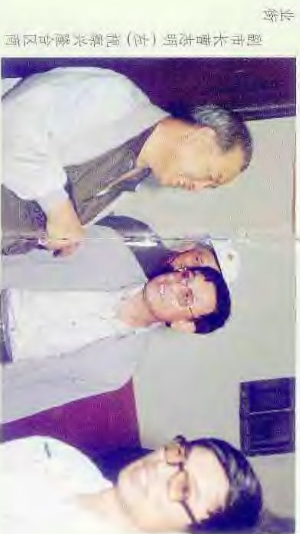
副市长曹志明(左)视察兴隆台区商业街