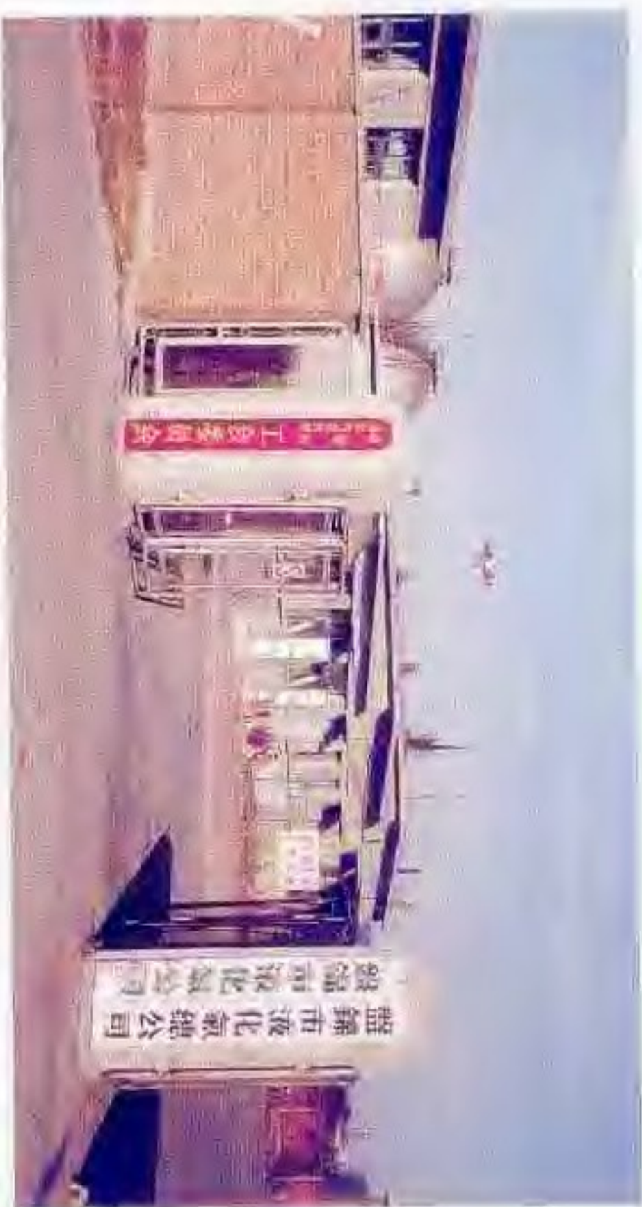
盘锦市液化气总公司