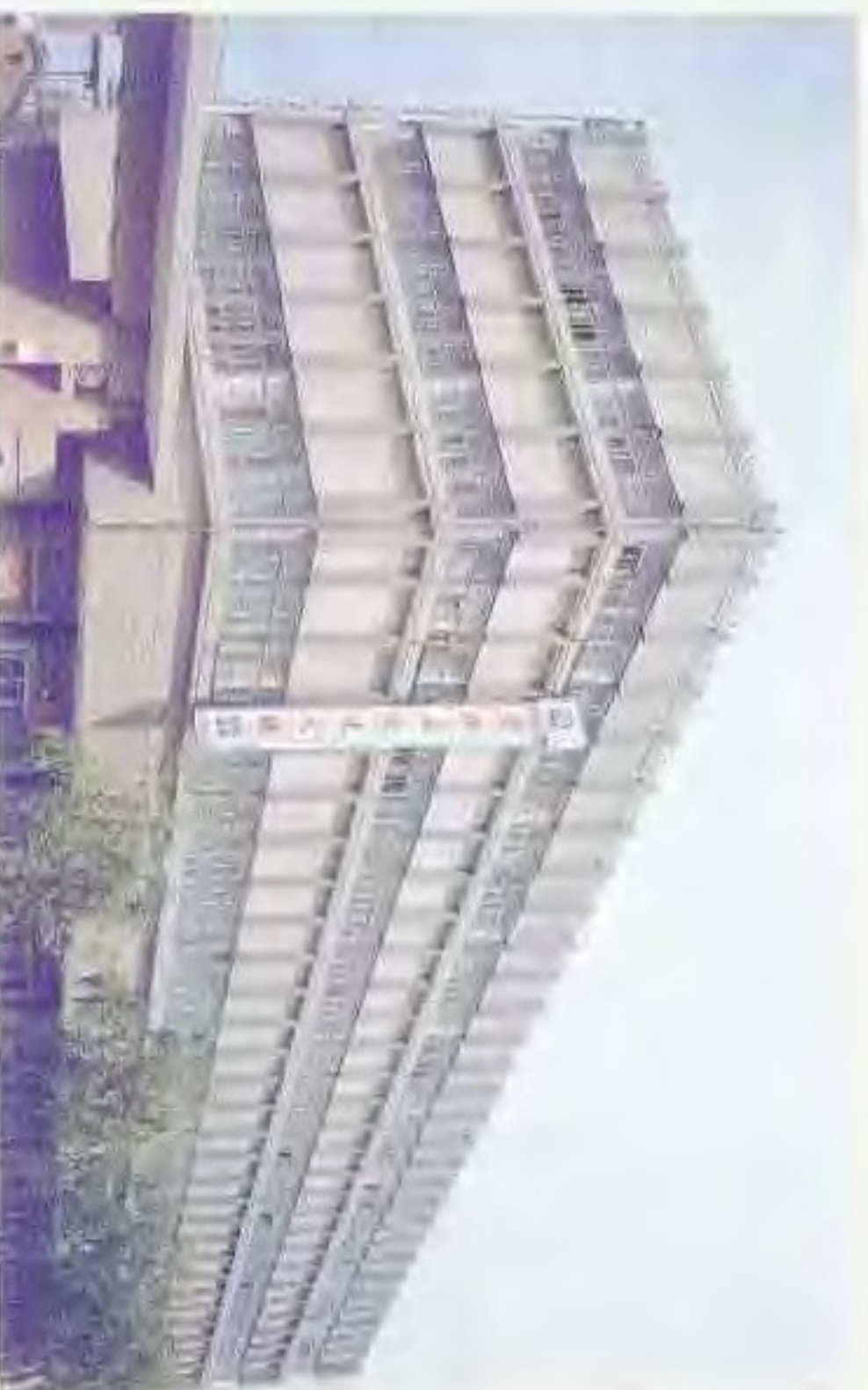
盛德五金交电化工公司