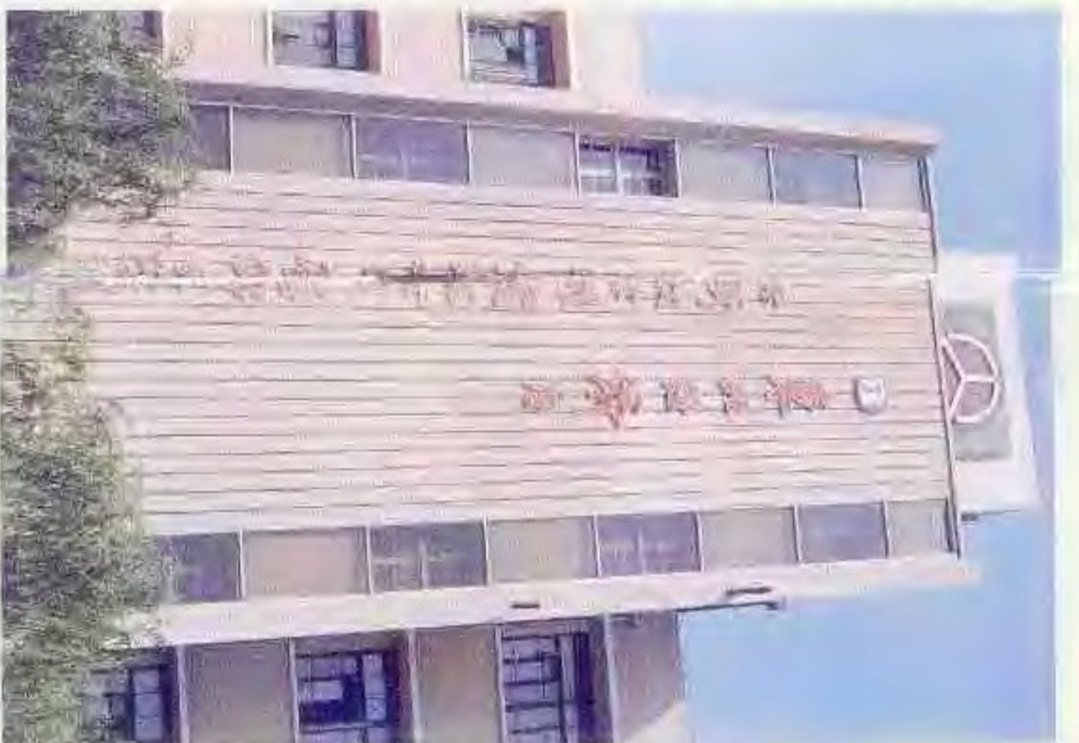
东北经济区经济技术开发总公司盘锦分公司