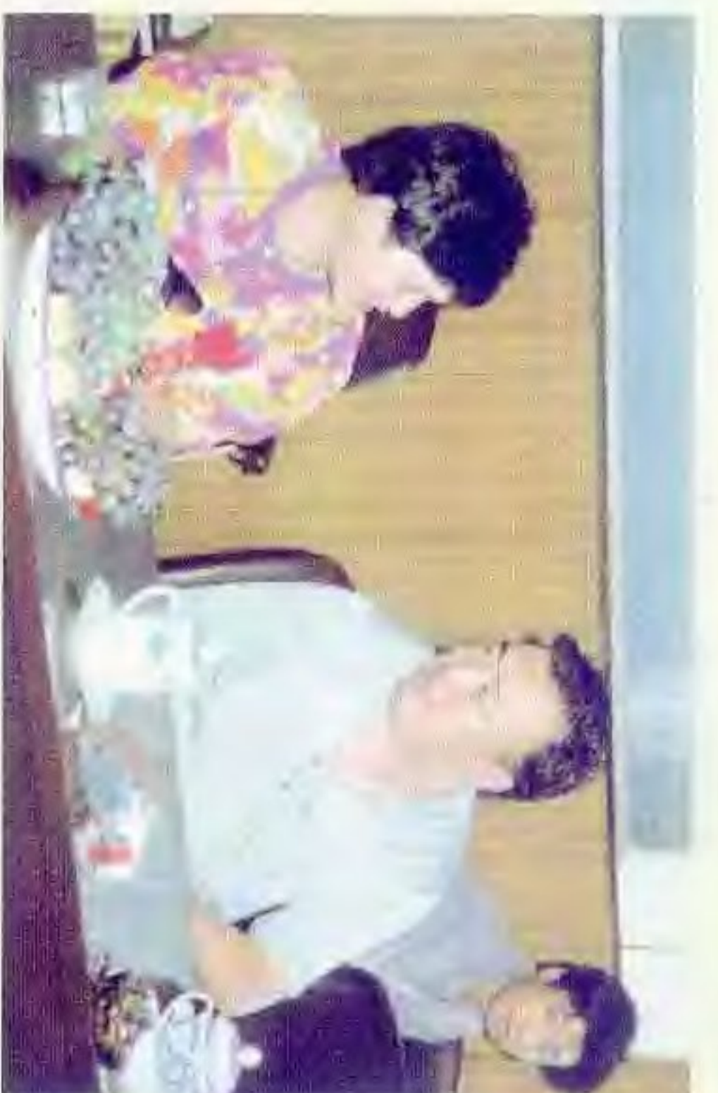
市领导张要武(右)与台商会谈