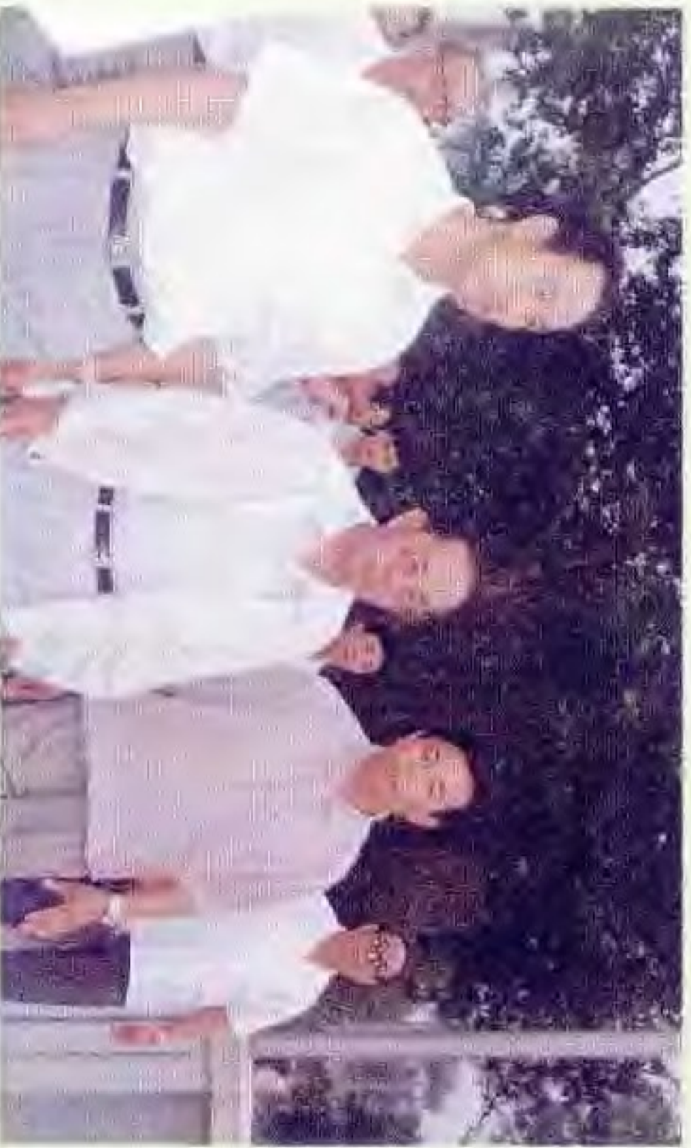
国务委员陈俊生(左二)视察盘锦