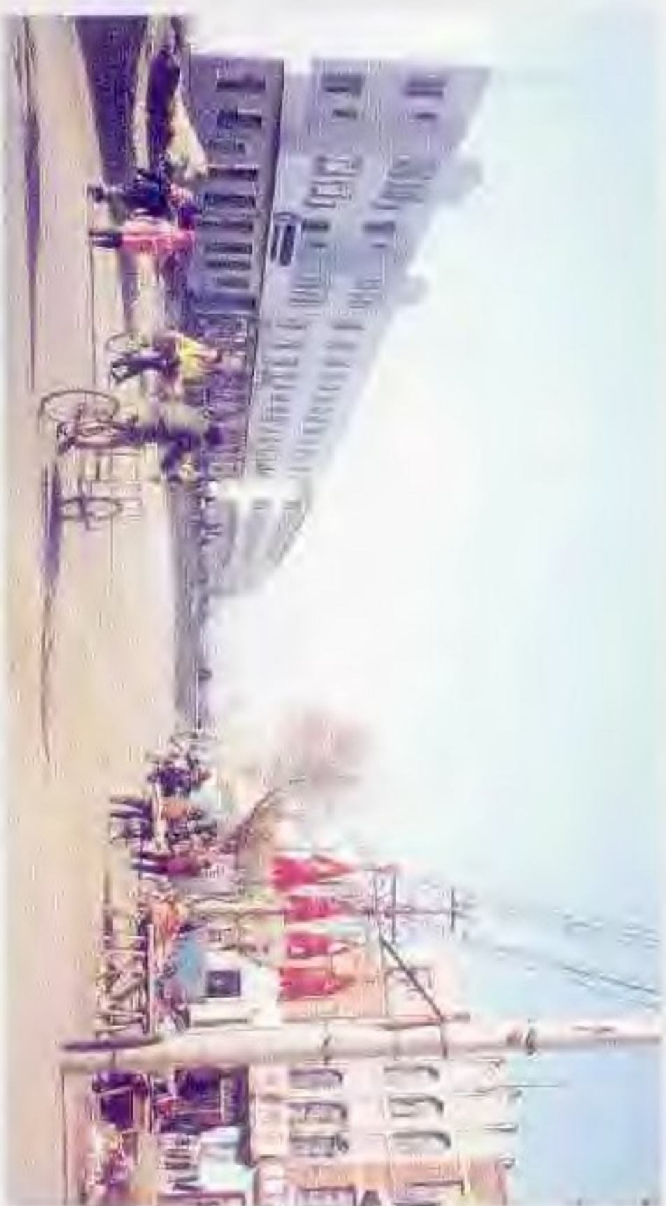
域内商埠——田庄台古镇新姿