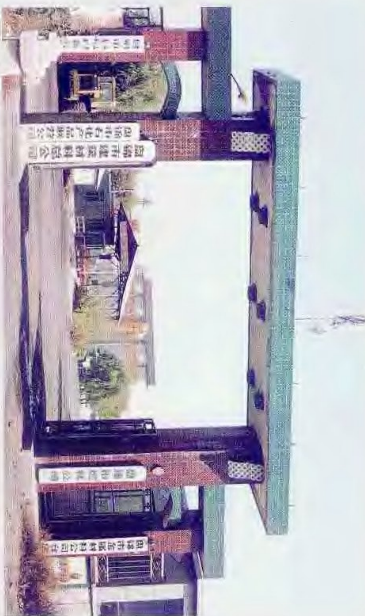
盘锦市各物资供应公司