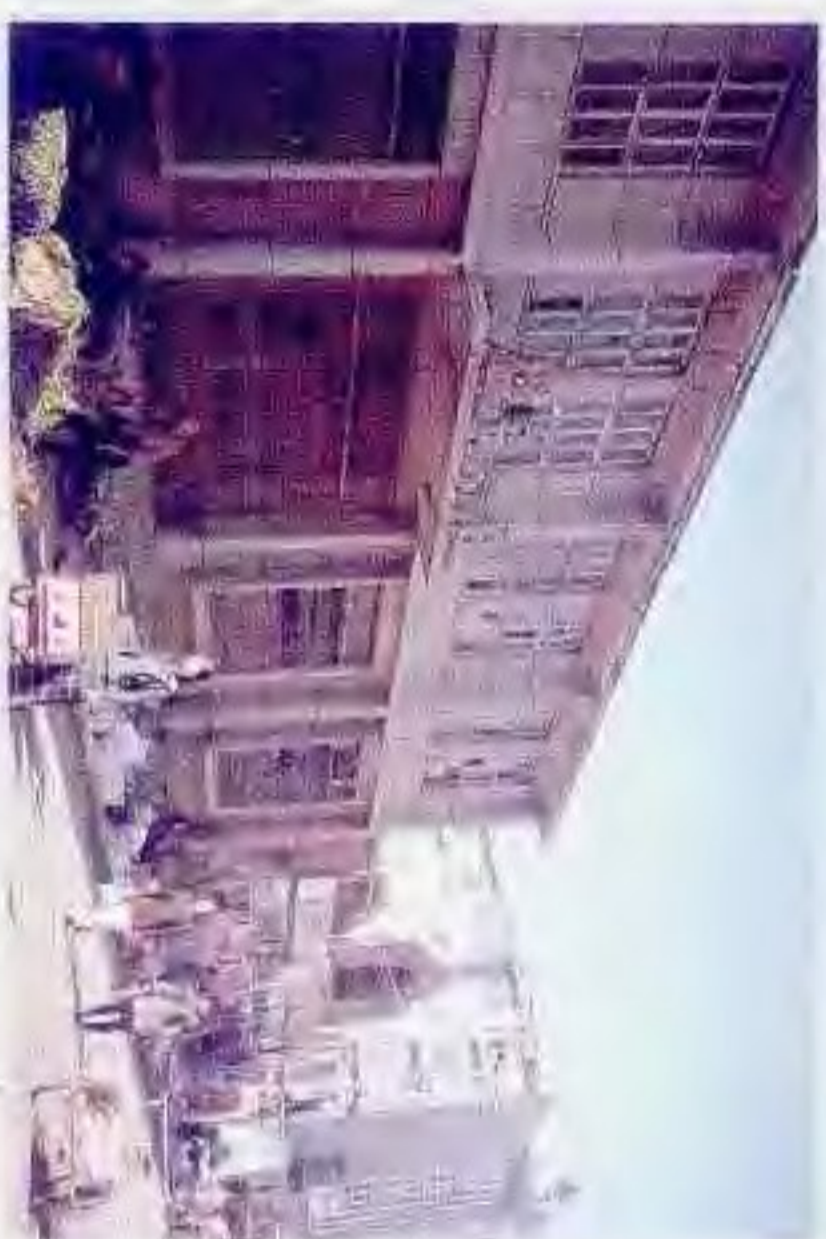
盘锦第一百货商店