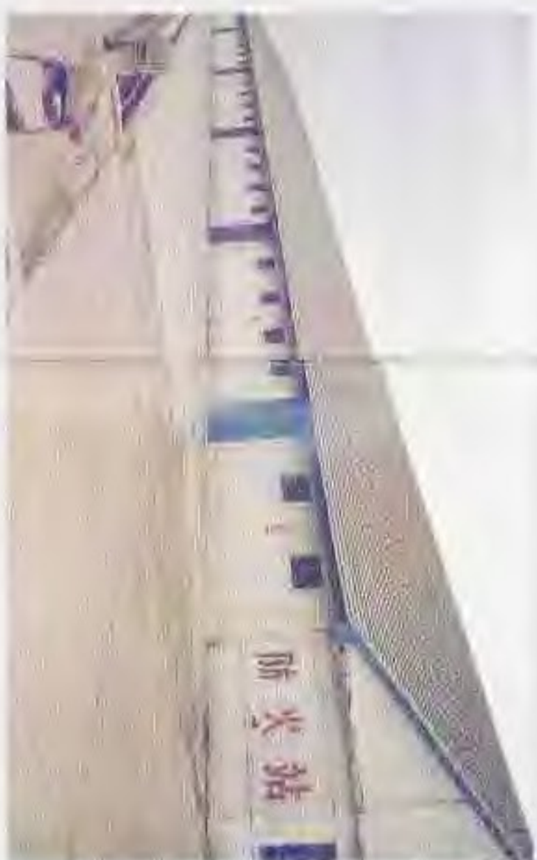
50年代建造的储粮仓库