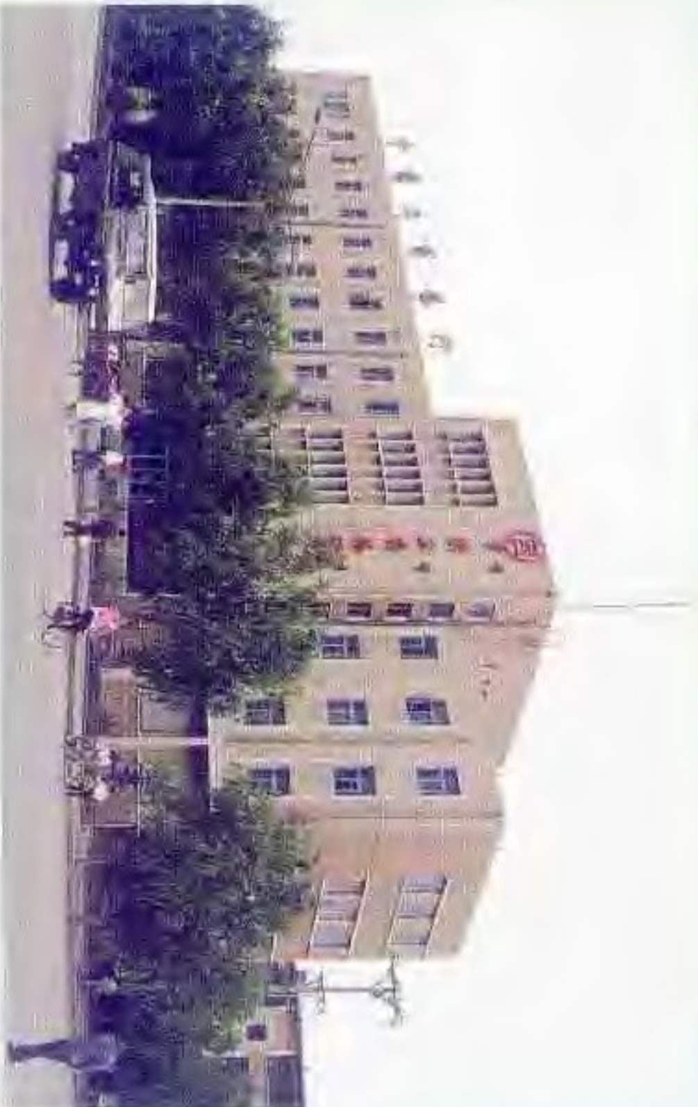
中国工商银行盘锦市支行