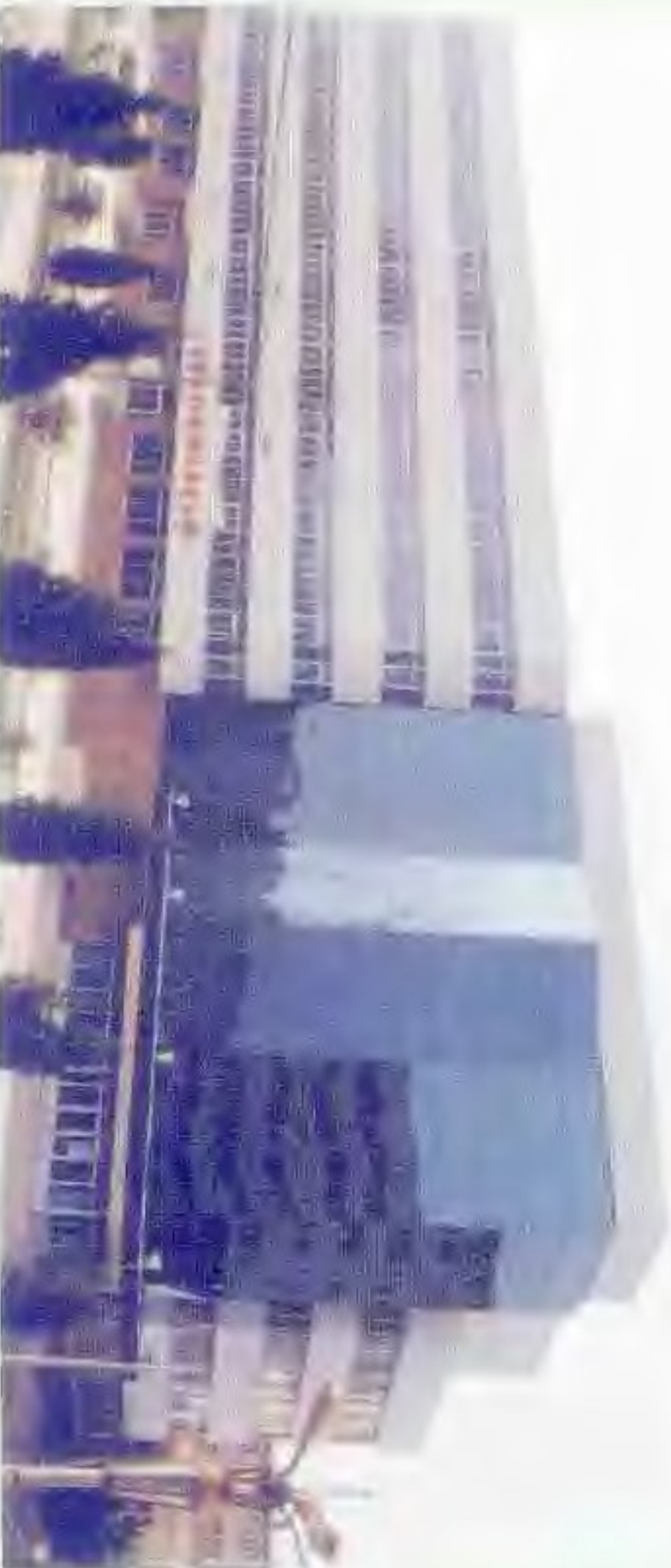
中国人民银行盘锦市分行