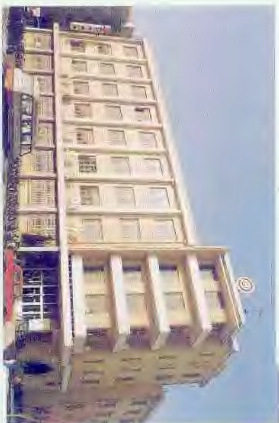
中国人民建设银行盘锦市中心支行