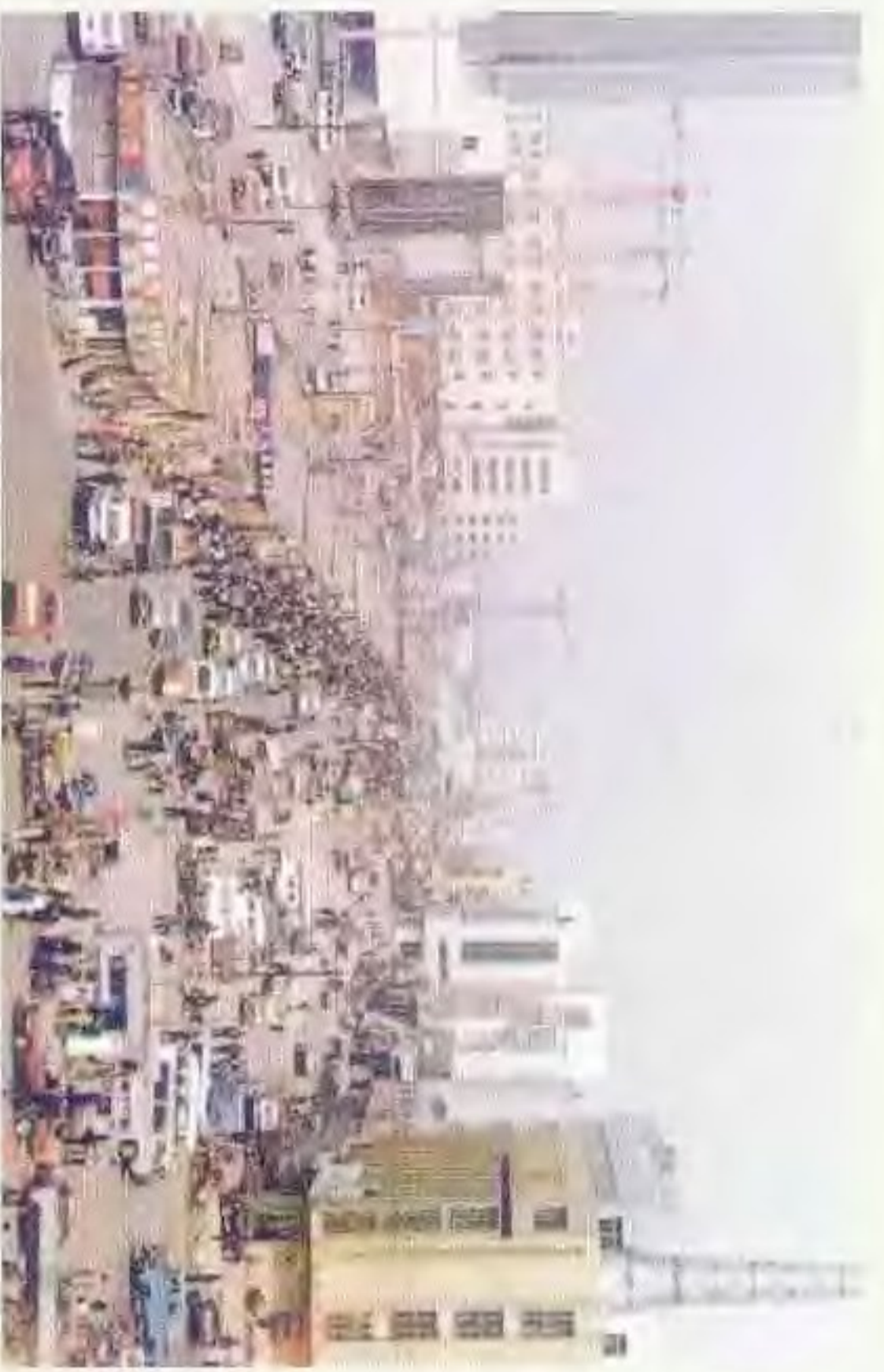
兴隆台路盘商业街