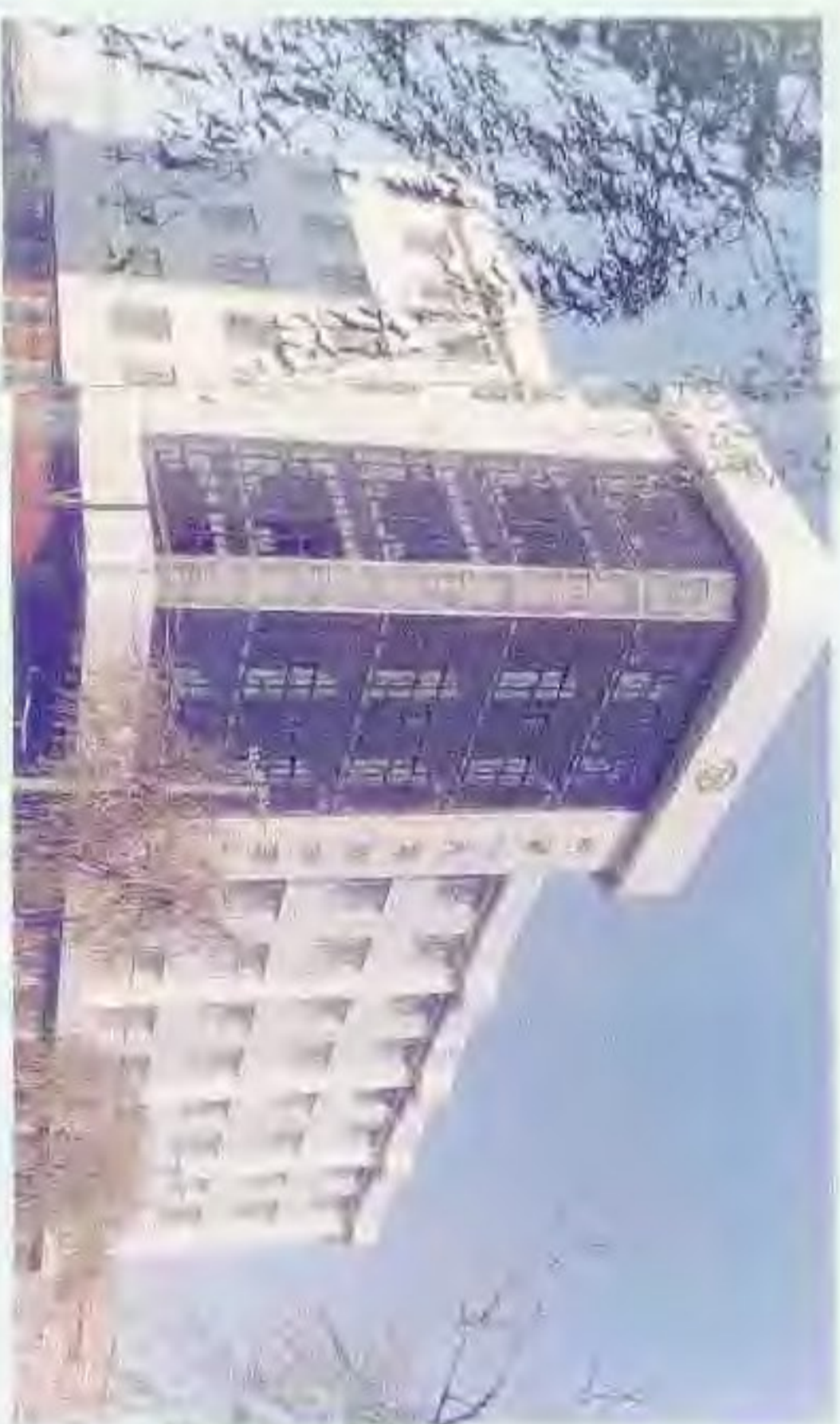
中国人民保险公司盘锦市支公司