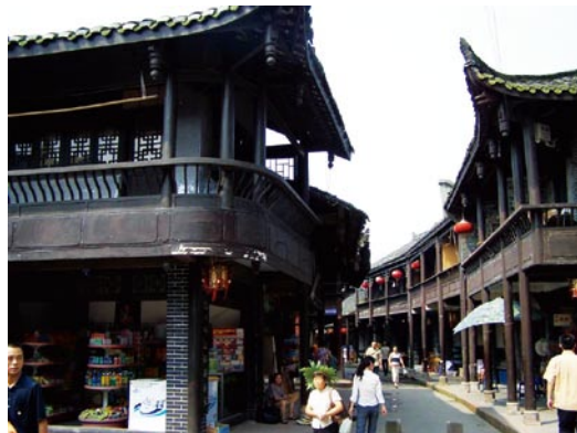
— 黄龙溪远离尘嚣，人们生活闲适。

给人一种静穆之感。旭日东升，熠熠泛光，薄雾消散，吊桥投下深长的影子，像要飞翔的天使。8点过后，街市像睡醒了一样，人渐渐多了，店主开门，挂店旗，生火。中午时分，人们三三两两地来到街上，你会看到这样的场景：鹤发的老人倚门而坐，用背篓背着孩子的阿嫂挎着竹篮兜售当地特产；巴士、牛车、人力车在同一条路上行驶，自行车“叮叮铃铃”渐行渐远；这里的妇女极爱织毛衣，不仅坐着织，站着织，还不时看到妇女们一前一后边走边聊边织。夜幕降临时，色彩斑斓的街灯把牌坊、古街、古房装点得绚丽多彩，大道两侧的树上挂满了红灯笼，向远处延伸开去，把夜晚的古镇点缀得古意盎然。古镇还保留着800年不变的打更古民俗，夜深人静，清脆的打更声会使游客们睡得分外安静。