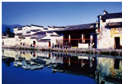
○ 碧水倒映白墙黛瓦。

村内鳞次栉比的层楼叠院与旖旎的湖光山色交相辉映，呈现出一片静谧空灵的景象。承志堂位于村中上水塘，建于1855年，是清末宏