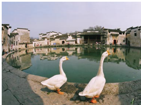
令人艳羡的田园风光。

宏村明清民居建筑群整体价值体系：以传统的风水理论为指导的独特的村落选址、布局和建筑形态，与自然环境协调统一，体现了天人合一的中国传统哲学思想；独特的水系是前人综合实用与美学于一体的水利工程典范，体现了人类利用自然、改造自然的才能；特别是有意识地强化自然界中“牛”的形态，体现农耕民族对牛的崇拜与依赖，经过几百年的规划发展、精心营造的一处令人叫绝的古村落。