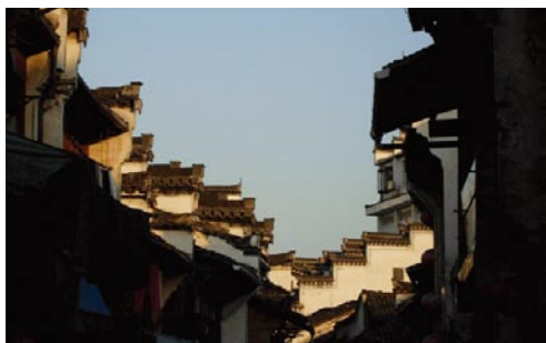
鳞次栉比的古建筑。