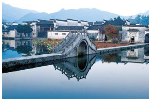
宏村南湖波平如镜。