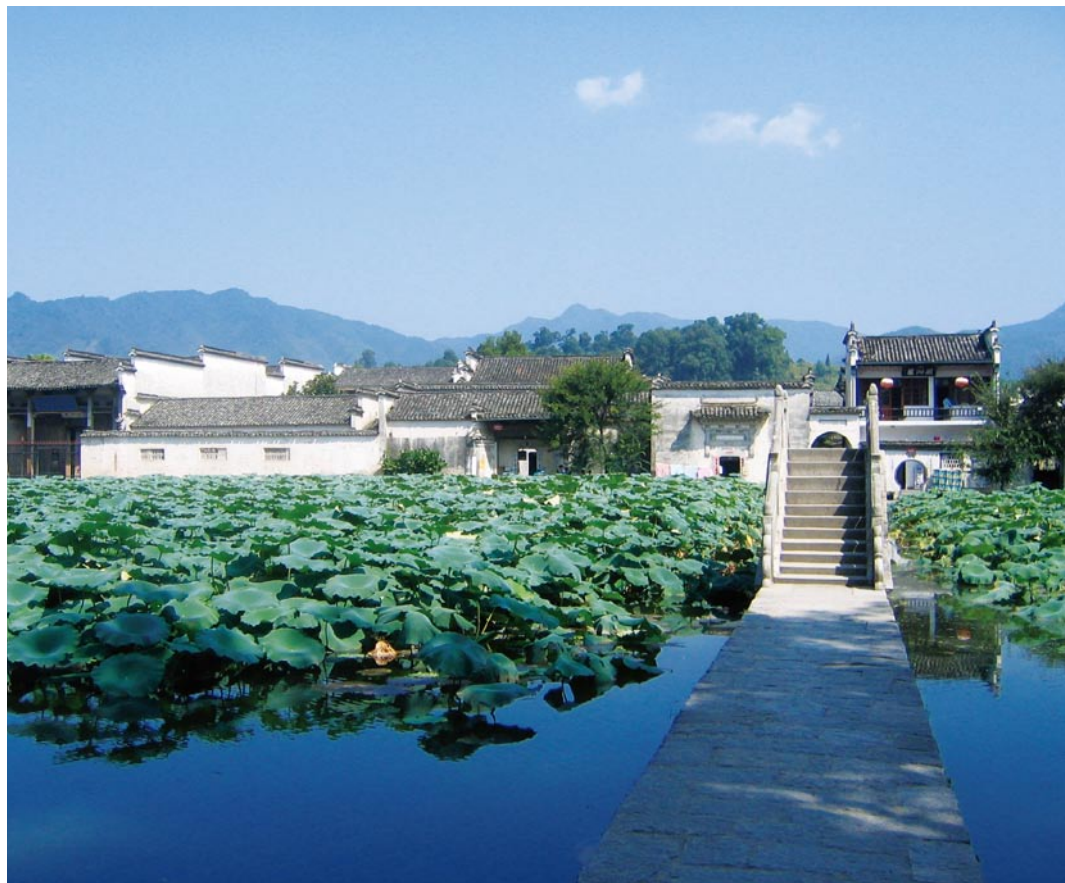
宏村南湖，莲叶满塘。

西递村原名西川，又称西溪，因在徽州府西曾设铺递所（邮局），故名西递。据记载，唐昭宗李晔之子因遭变乱，逃匿民间，改为胡姓，在西递繁衍生息，形成聚居村落。因此，西递村是以宗教血缘关系为纽带，以胡姓为主聚族而居的古村落。整个村落仿