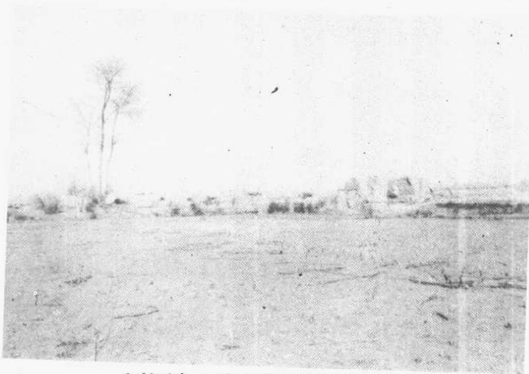
几经破坏，沙王府已成断垣残壁