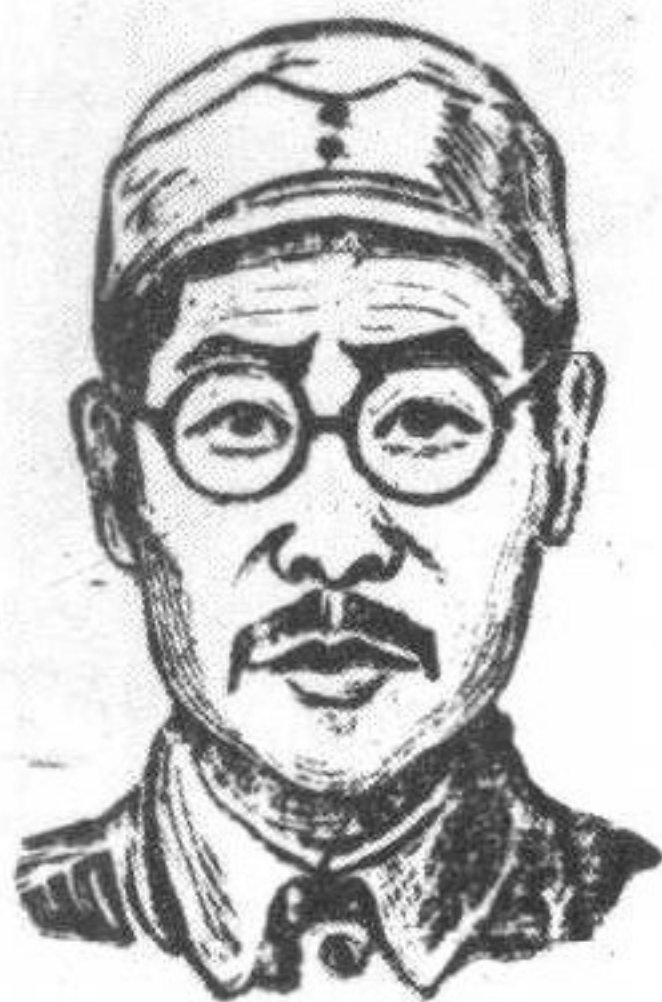
那素滴力盖 ——曾任乌审旗 任官，后至延安， 任陕甘宁边区参 议员、边区政府 委员 伊盟博物馆供稿