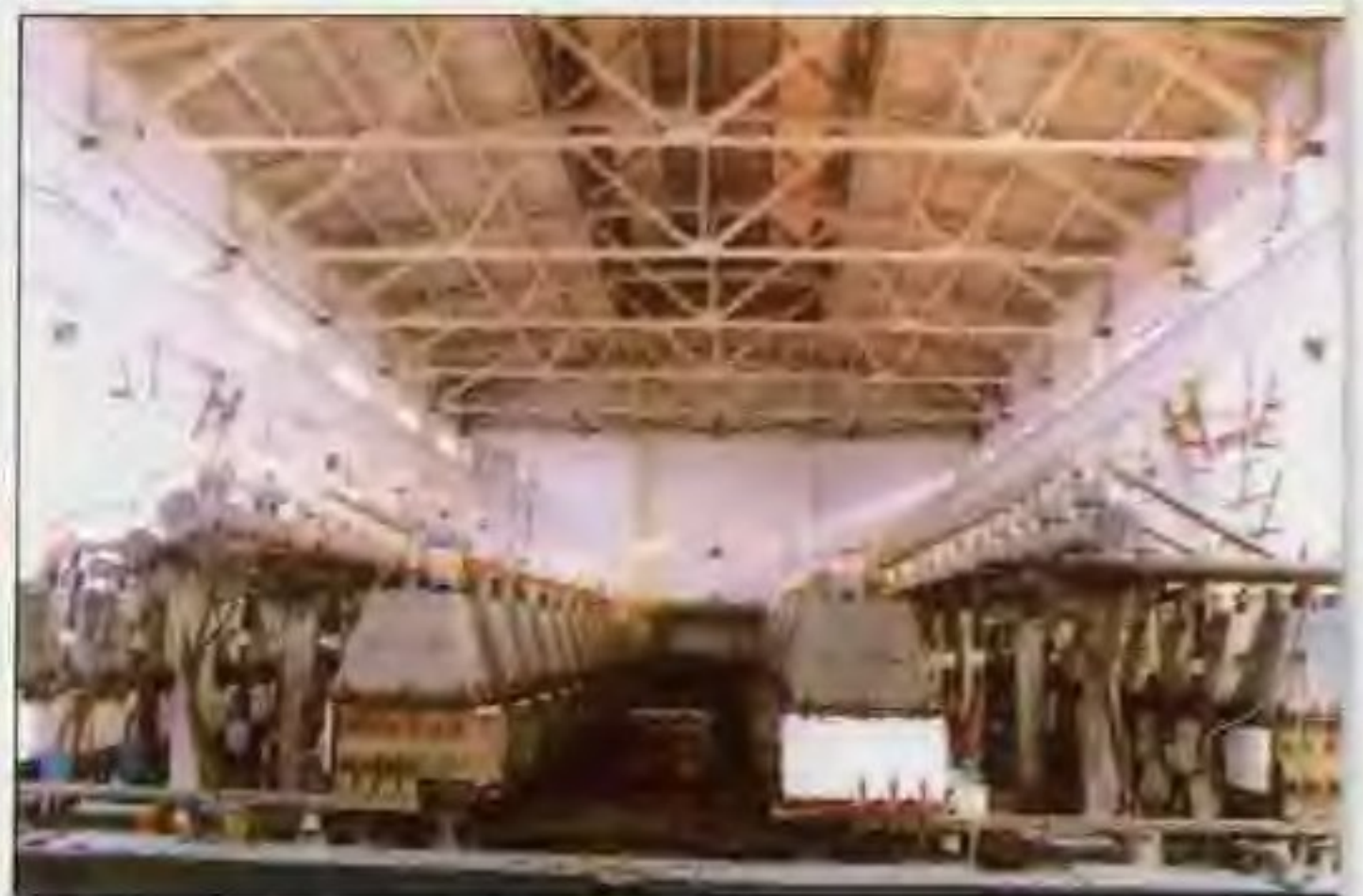
南阳石油化工厂 烧碱车间