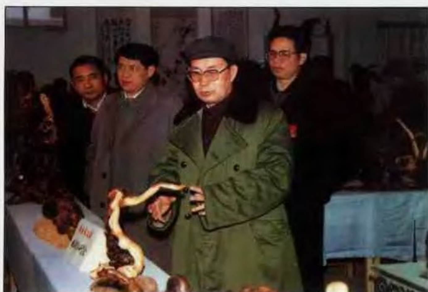
1989年12月，国务委员陈俊生在南阳视察