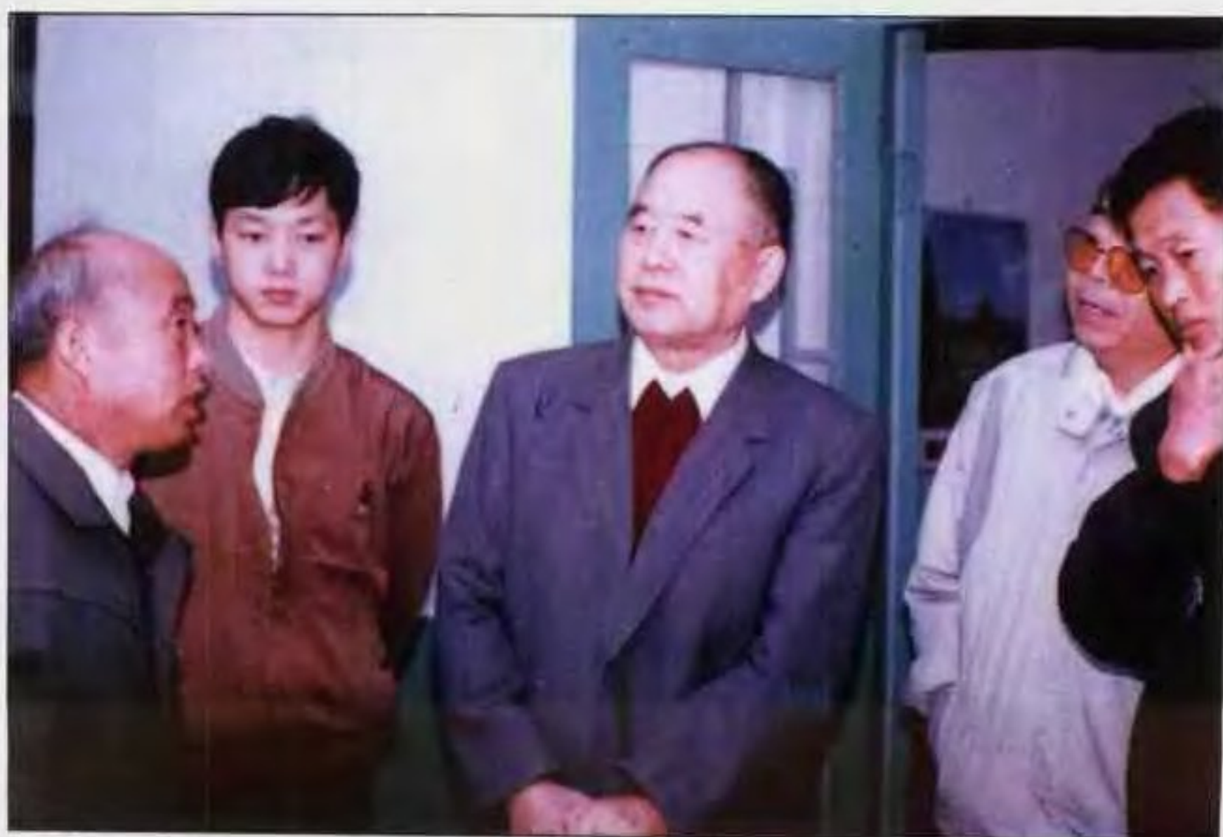
1992年9月，原中顾委常委李德生同志到南阳视察