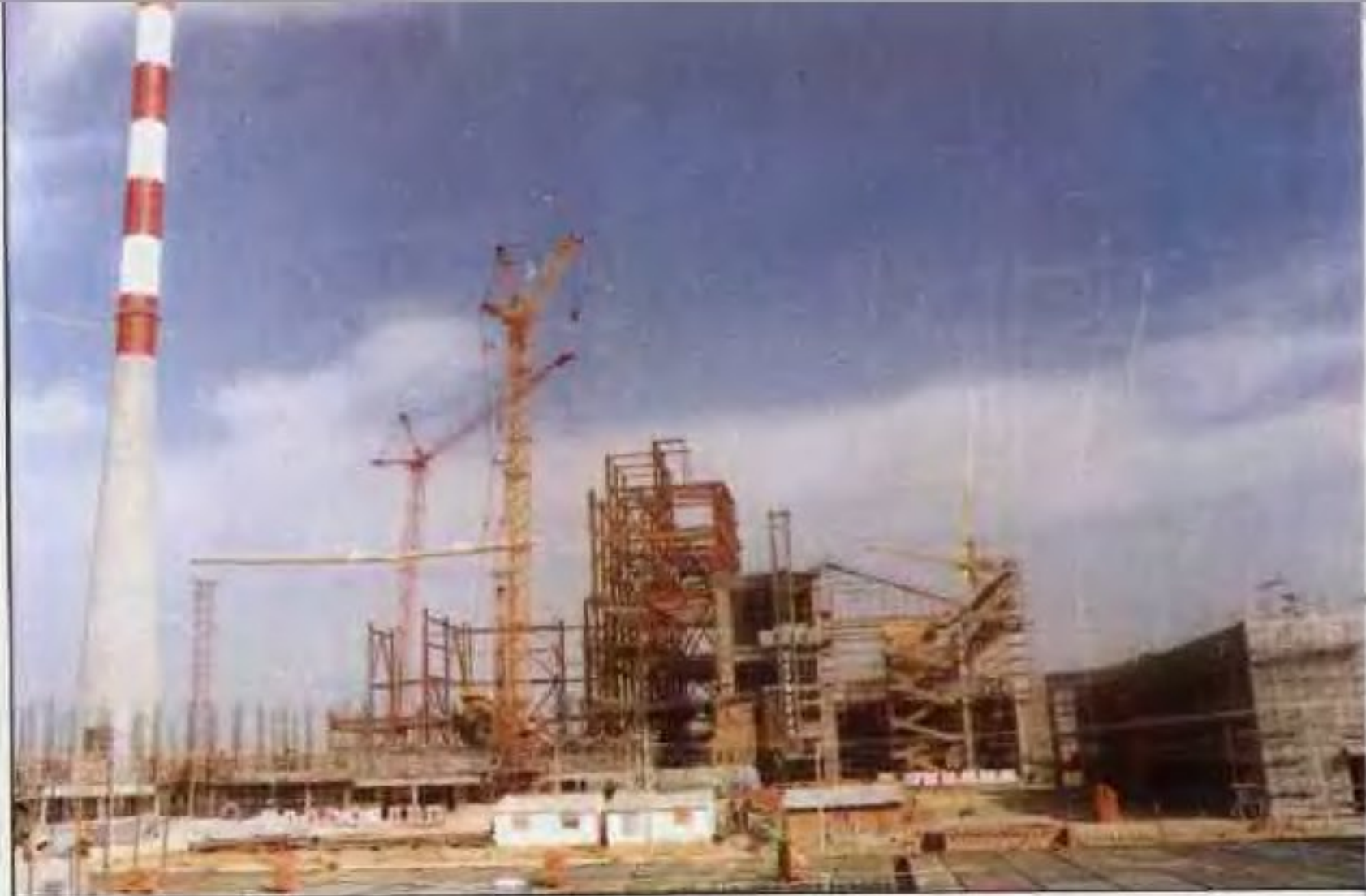
建设中的鸭河口火电厂