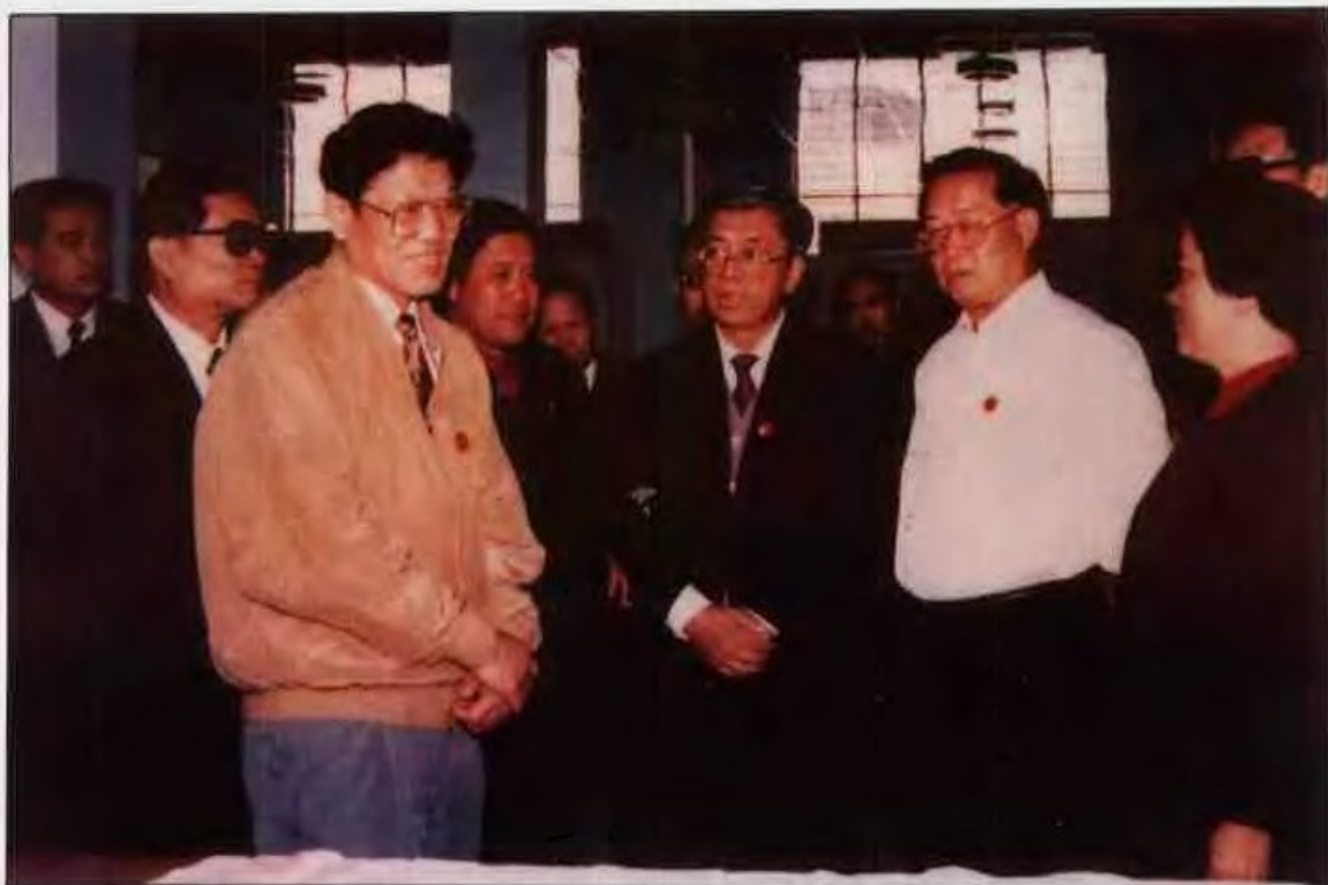
1994年10月，中共中央政治局委员、国务委员李铁映(左三)到南阳视察