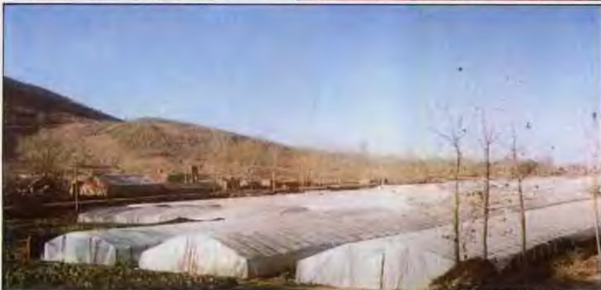
市郊温室种植蔬菜