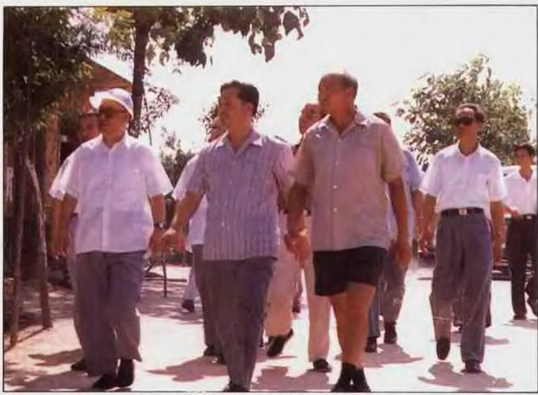
1990年8月，省委书记侯宗宾(左一)到南阳视察