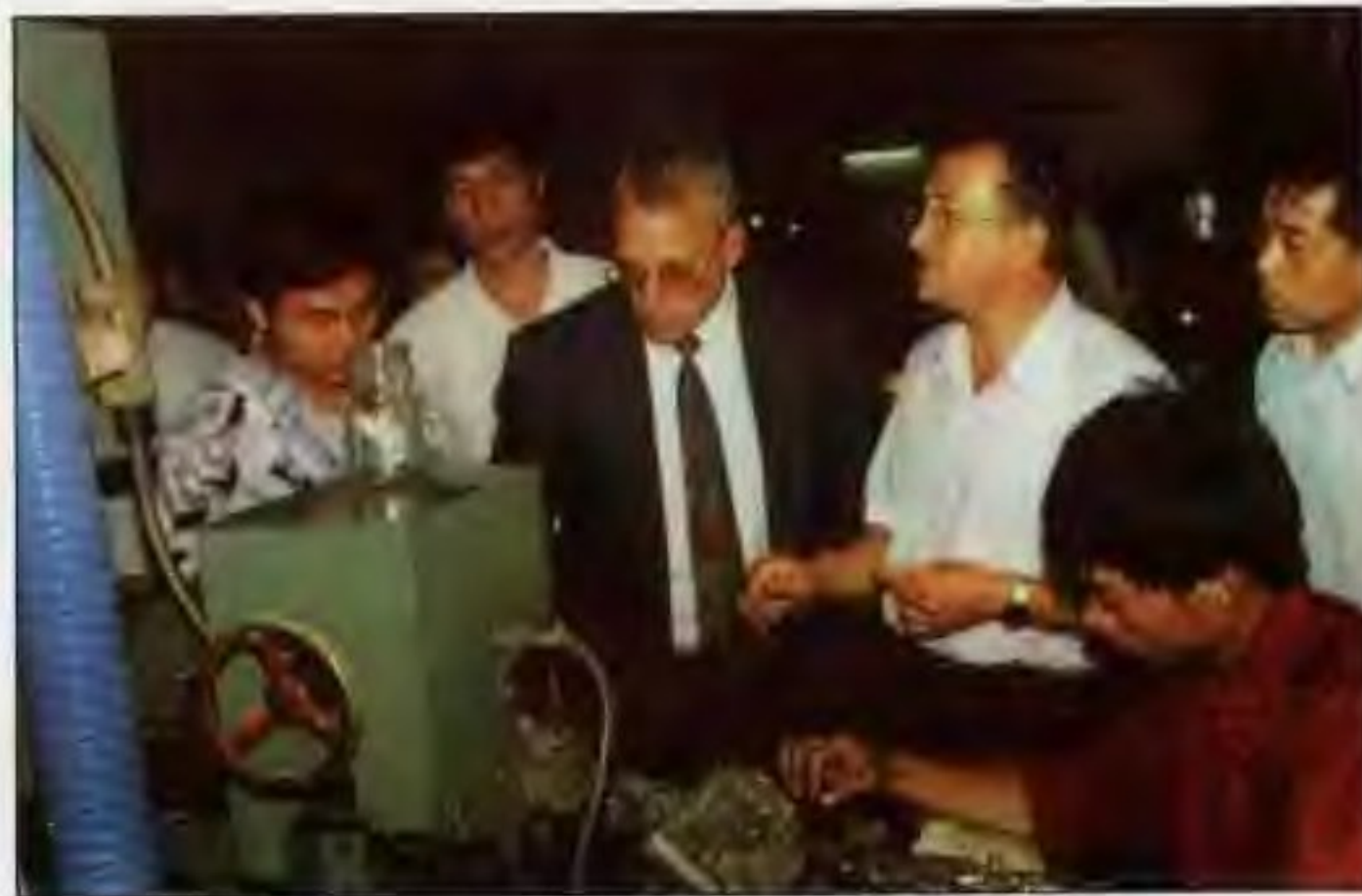
以色列加特市友好访问团参观南阳市制锁总厂