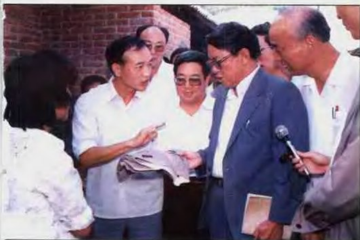
1989年10月，国务委员、国家科委主任宋健(右二)在南阳视察