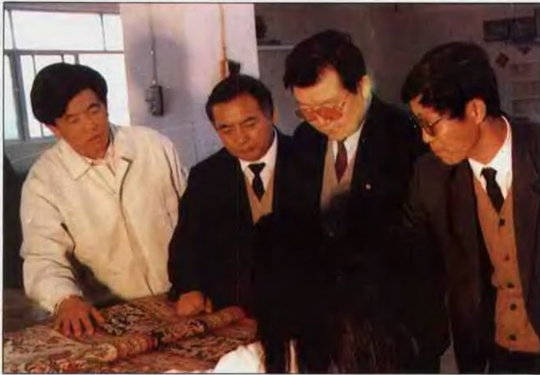
1992年元月，省长李长春(右二)到南阳视察