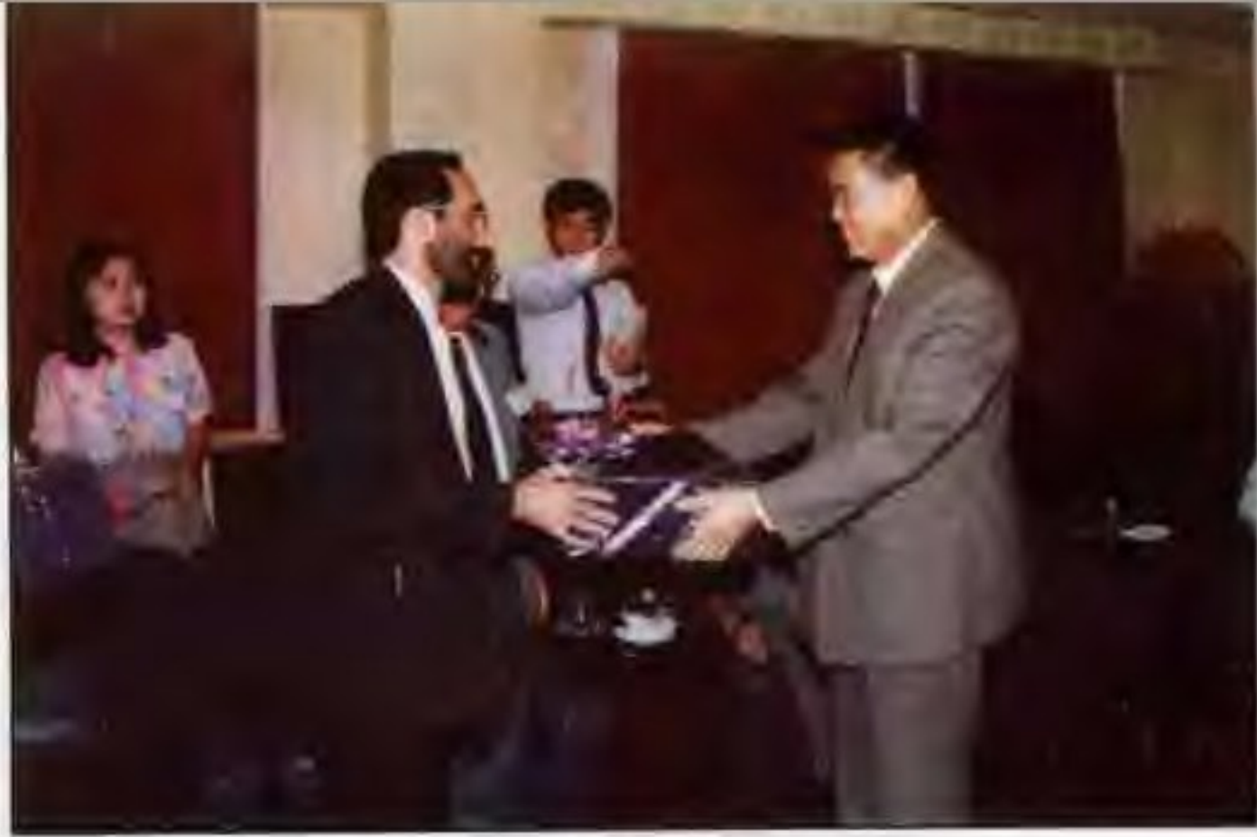
市委书记李清彪接见外商