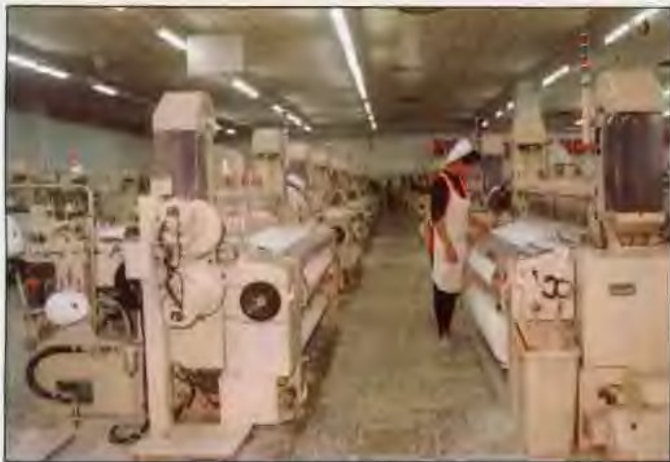
新野棉纺厂 喷气织机车间