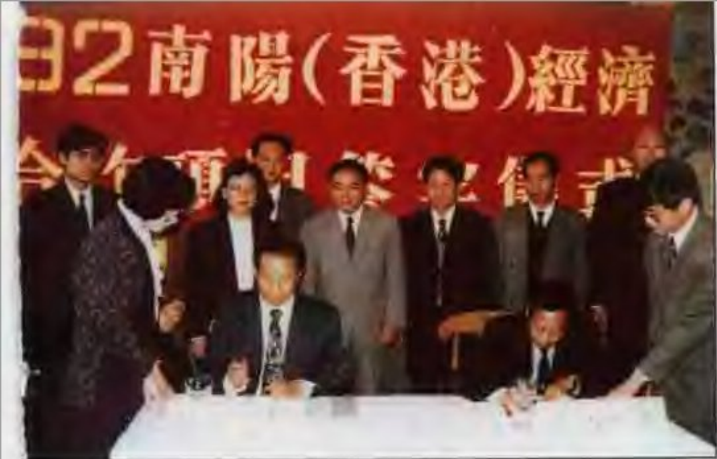
1992年南陽(香港)經濟合作項目簽字儀式