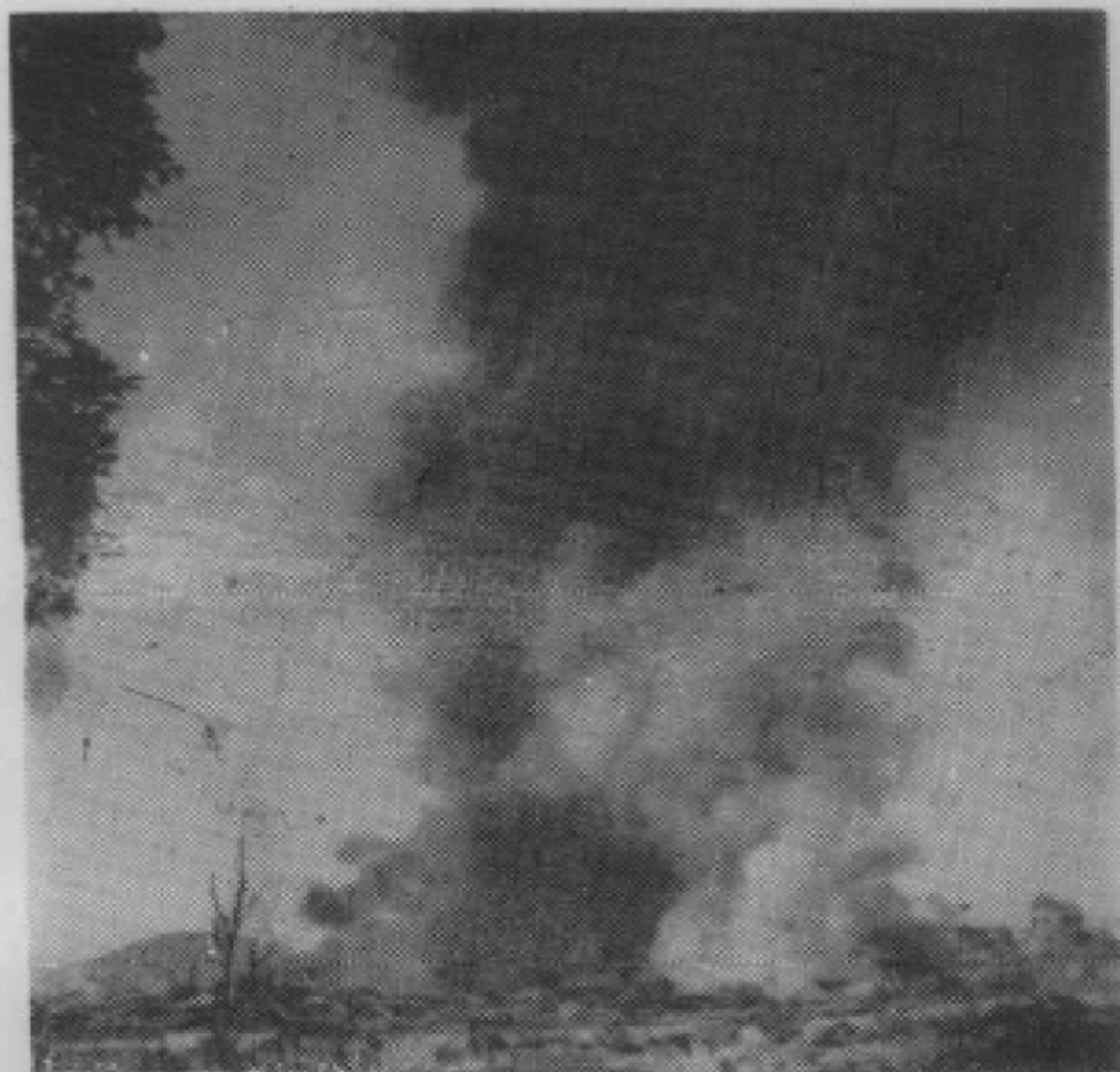
一九三九年二月四日，日机对贵阳狂轰滥炸，图为市中心被炸实况。