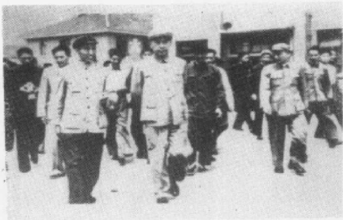
一九六〇年五月三日周恩来总理视察贵阳钢厂