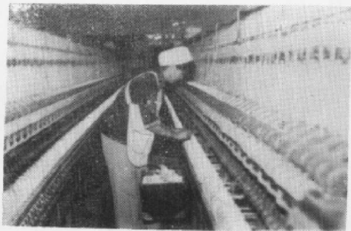
贵阳棉纺织厂细纱车间