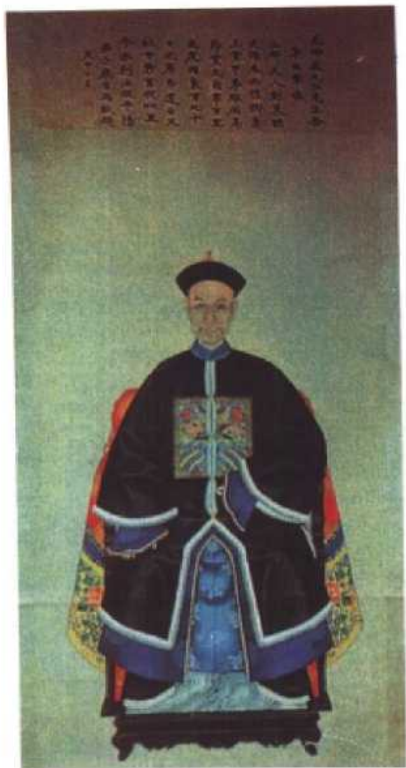
九江先生登第出宰像