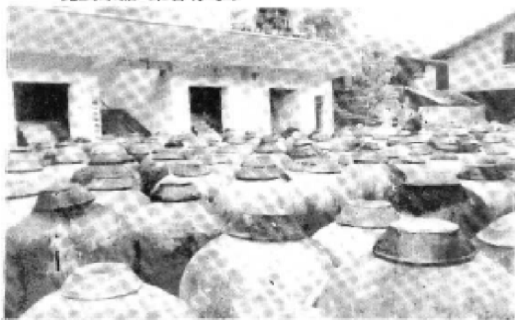
护国陈醋厂,1993年“护国陈醋”被评为“酒城消费者最喜爱商品”。