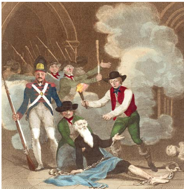
◆ 巴黎市民搭救巴士底狱的犯人。

在惩治这些杀人不眨眼的混世魔王时，市民们时刻不忘关押在监狱里的犯人，其实此时监狱里根本没有几个罪犯，最后他们只找到了7名囚犯。这些囚犯被民众簇拥着在巴黎街道上进行了盛大的游行，简直就像在举行节日庆祝一样，全城百姓无不为攻陷巴士底狱而欢欣鼓舞。