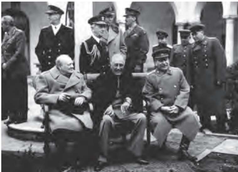
雅尔塔会议上的丘吉尔、罗斯福和斯大林。

身着笔挺的大元帅军服的苏联部长会议主席、苏军最高统帅斯大林和苏联外交部长莫洛托夫一起到机场迎接。并从机场一直将罗斯福和丘吉尔分别送到已安排好的行宫。