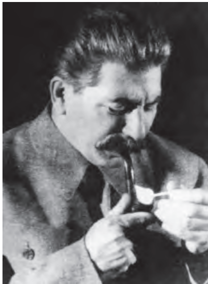
苏联最高统帅斯大林

罗斯福：“我想这是没有异议的，阁下请放心。日本现在还有陆军 400 多万人，海军 120 万人，6 艘战列舰、4 艘航空母舰等 70 多艘战舰，飞机 3000 架；美军在