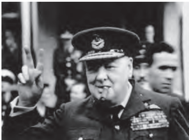
身穿戎装的英国首相丘吉尔

人宣告：“在任何情况下，我都不会让四五十个国家胡闹地染指大英帝国的领土！只要我当首相，我绝不会把大英帝国世代的财产交出去，哪怕一分一毫也不成！”他边说边毫不掩饰地任凭泪水顺脸颊流下。