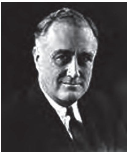
美国第 32 任总统罗斯福