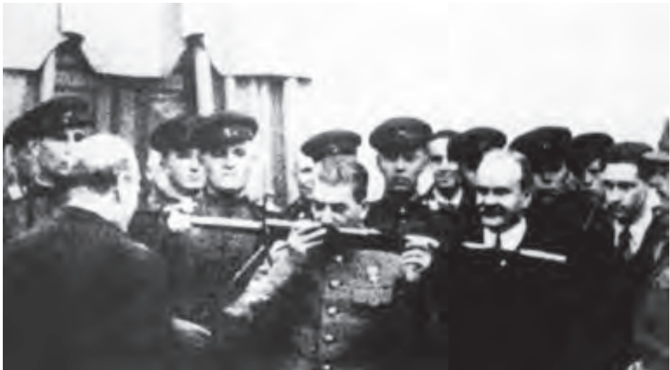
德黑兰会议期间，丘吉尔赠送给苏联红军一把宝剑。