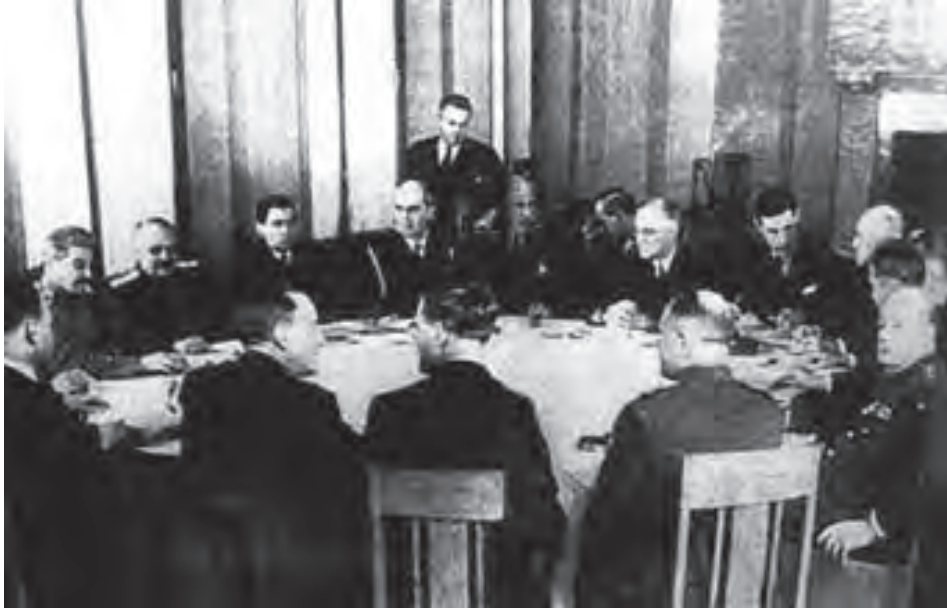
正在进行的雅尔塔圆桌会议

罗斯福：“早在1943年德黑兰会议上，大元帅就说过‘一旦德国最后垮台，就有可能把必要的支援部队调到西伯利亚，我们就能联合起来打击日本’。”