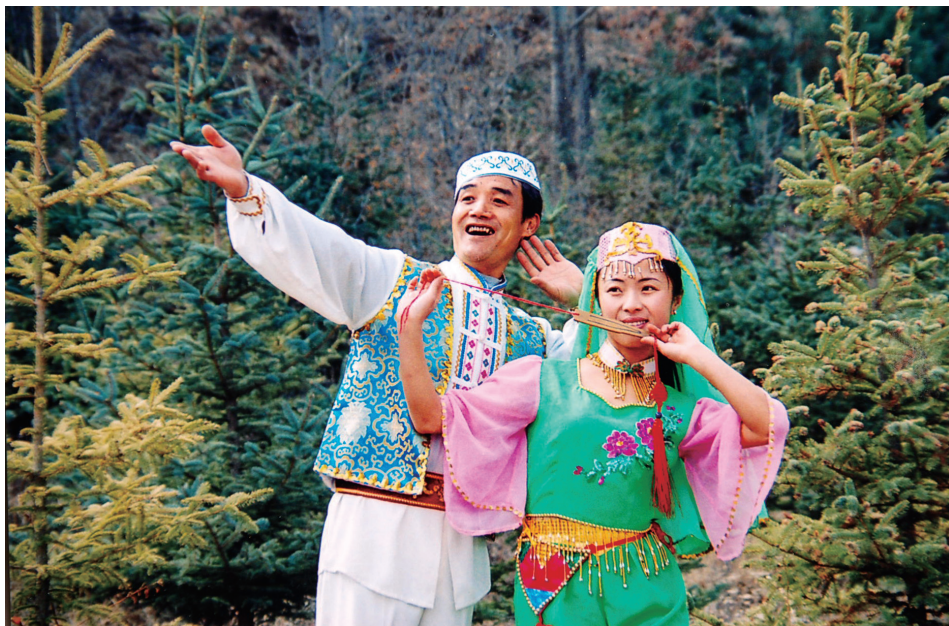
心里的“花儿”漫上来

流血流汗的整一年， 筋骨给日头晒断了； 叫三声“胡达”哭老天。 苦日子哪天算完了。 阿哥的肉呀！ 苦日子哪天算完了。