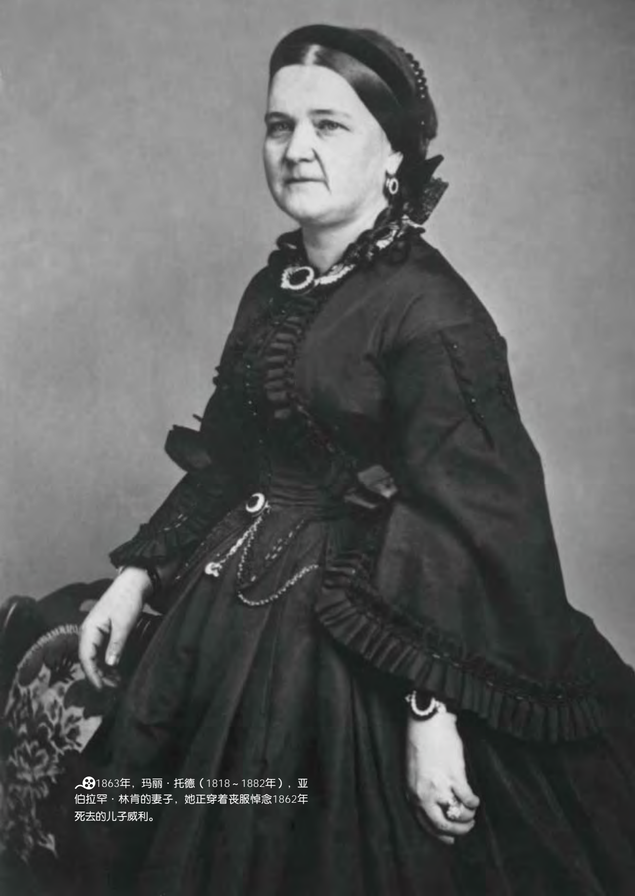
☠1863年，玛丽·托德（1818~1882年），亚伯拉罕·林肯的妻子，她正穿着丧服悼念1862年死去的儿子威利。