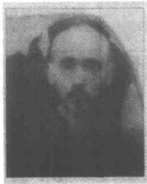
被王孟扬先生誉为“中国四大抗战阿訇”的王静斋(上左)、达浦生(上右)、哈德成(下左)、马松亭(下右)。参阅本书第 258 页。