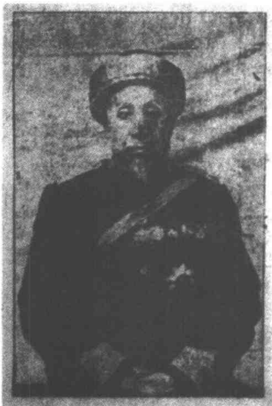
王浩然阿訇(1848—1919)是我国清末民初回族伊斯兰教界的泰斗式人物,是清末以来伊斯兰与回族教育的先驱和奠基人之一。